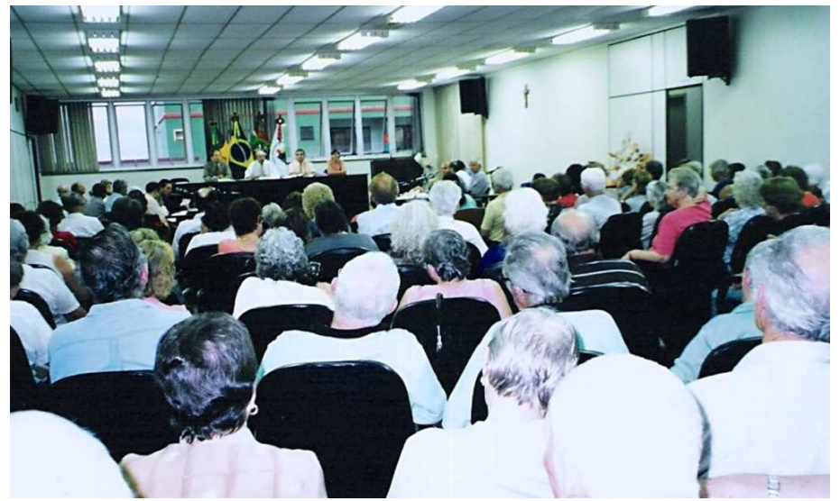
Homenagem da Câmara de Vereadores aos clubes de idosos da cidade - 2003