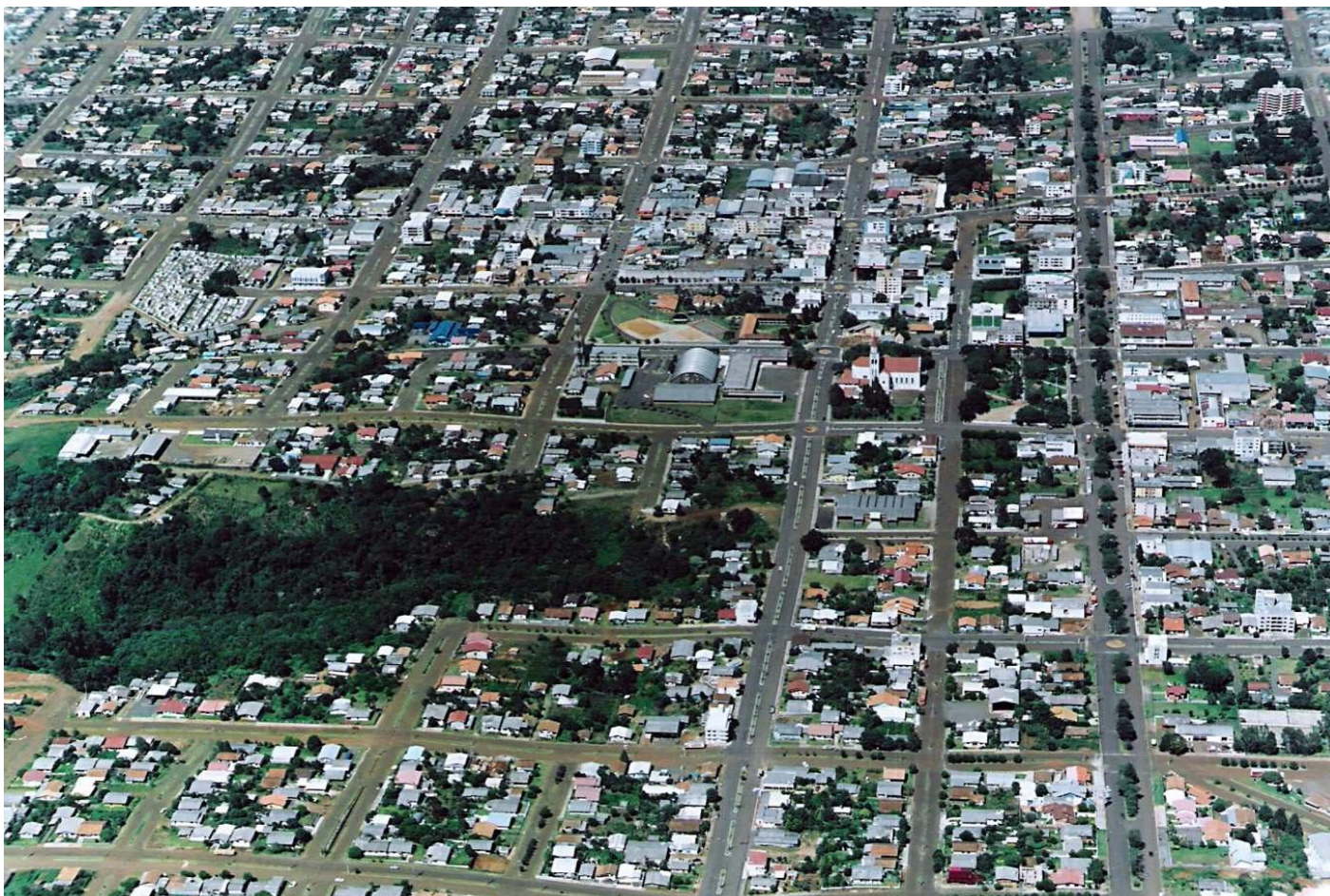
Centro da cidade de São Lourenço do Oeste - 2004/2005