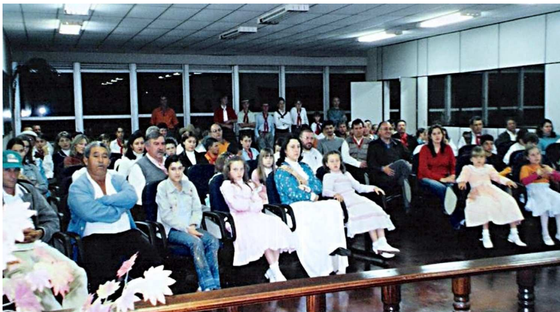
Integrantes das Invernadas Artísticas do CTG Amizade sem Fronteiras, homenageados pela Câmara de Vereadores - 2003