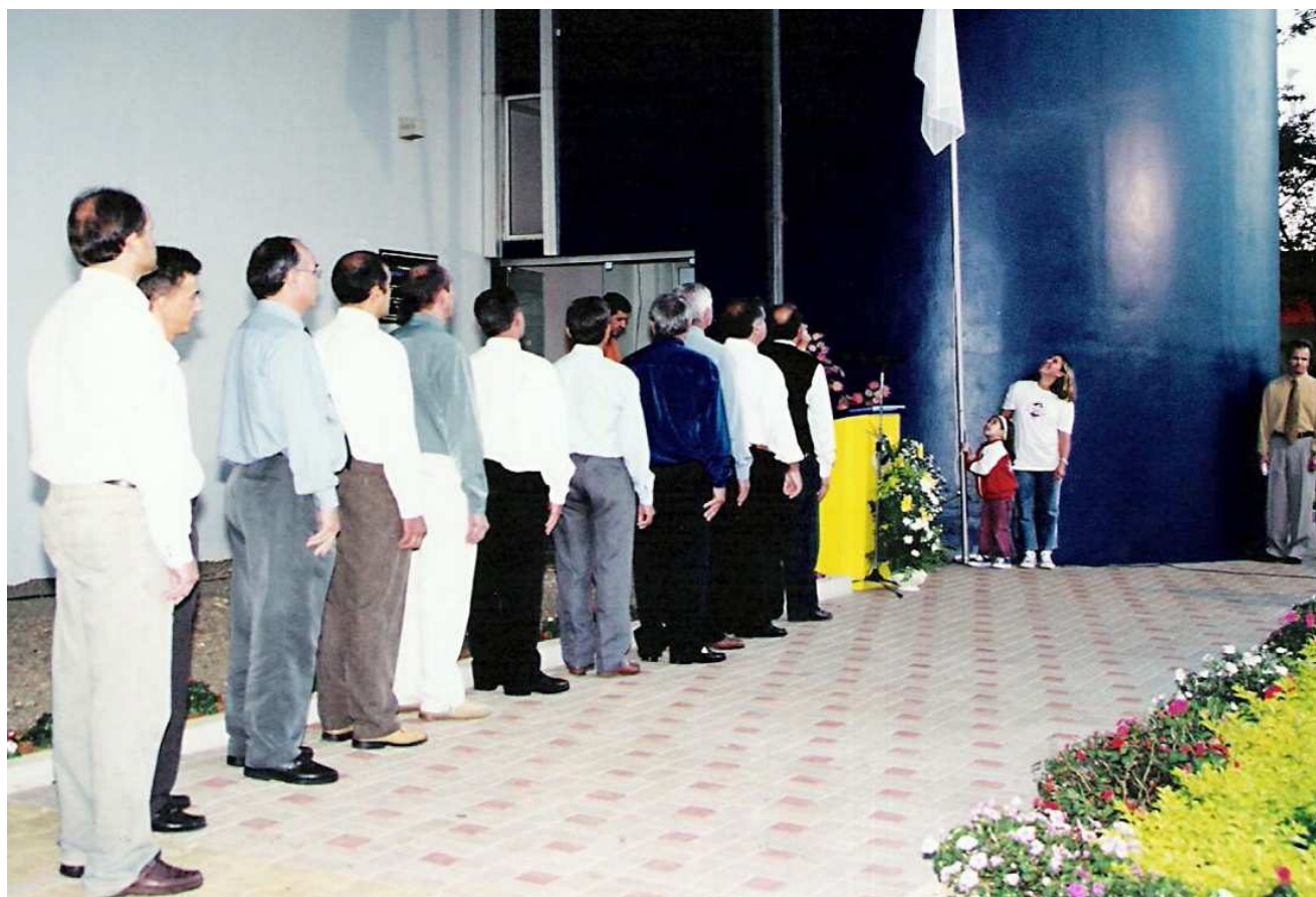
Solenidade de hasteamento da bandeira da paz - 2003

O Legislativo conclamou representantes das igrejas, das entidades e o público para um manifesto pela paz, no dia 07 de abril de 2003, durante o qual, em frente à Câmara de Vereadores, foi hasteada uma bandeira branca e lá permaneceu enquanto se desencadearam os graves conflitos no Iraque. O manifesto repudiava quaisquer formas ou atos de violência. Em sinal de solidariedade ao povo iraquiano e às famílias dos soldados envolvidos na guerra, houve apelo simbólico às autoridades para que governem com coerência, com responsabilidade e em favor da humanidade, independentemente de etnia, de credo ou ideologia.