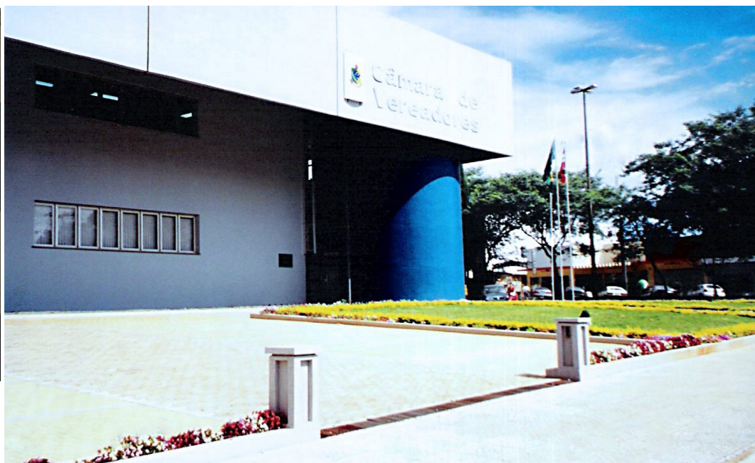
Câmara de Vereadores - 2002