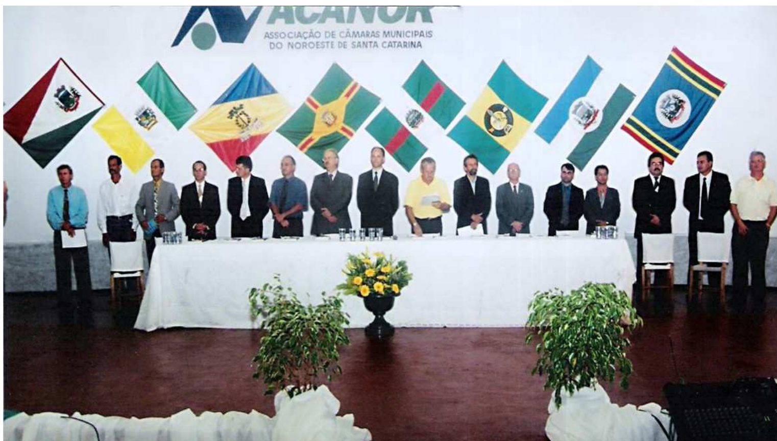
Autoridades locais, regionais e estaduais durante a fundação da ACANOR - 2002. Ao centro, o presidente da Assembléia Legislativa de SC, deputado Onofre Agostinho, conduzindo a solenidade

Esta instituição tem sido importante para a promoção de eventos voltados à formação e à qualificação dos agentes políticos, funcionários públicos e demais cidadãos, tendo como parceiros a Assembléia Legislativa de Santa Catarina, o Tribunal de Contas, o Tribunal Regional Eleitoral e demais órgãos públicos.