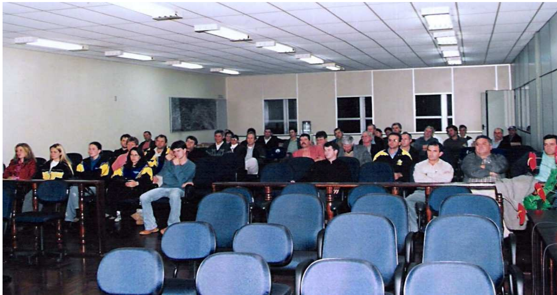
Audiência pública sobre o trânsito - 2002