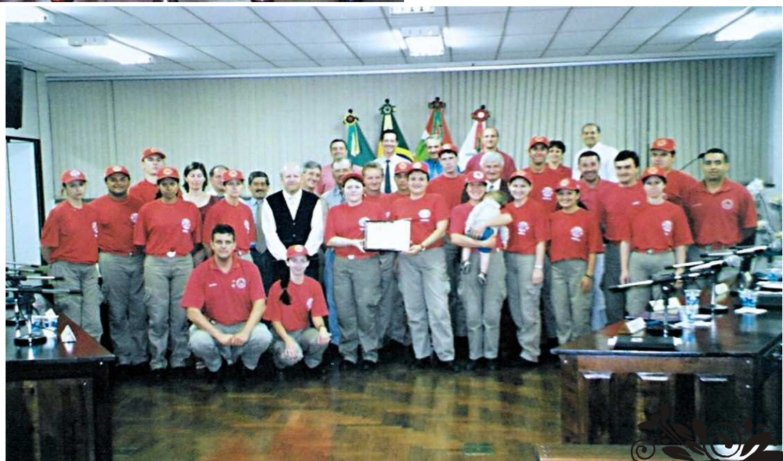
Bombeiros voluntários recebendo homenagem da Câmara de Vereadores - 2003