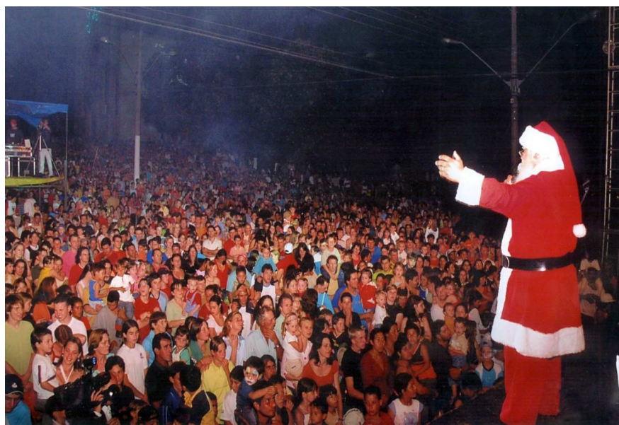
Chegada do Pai Noel - Natal /2004