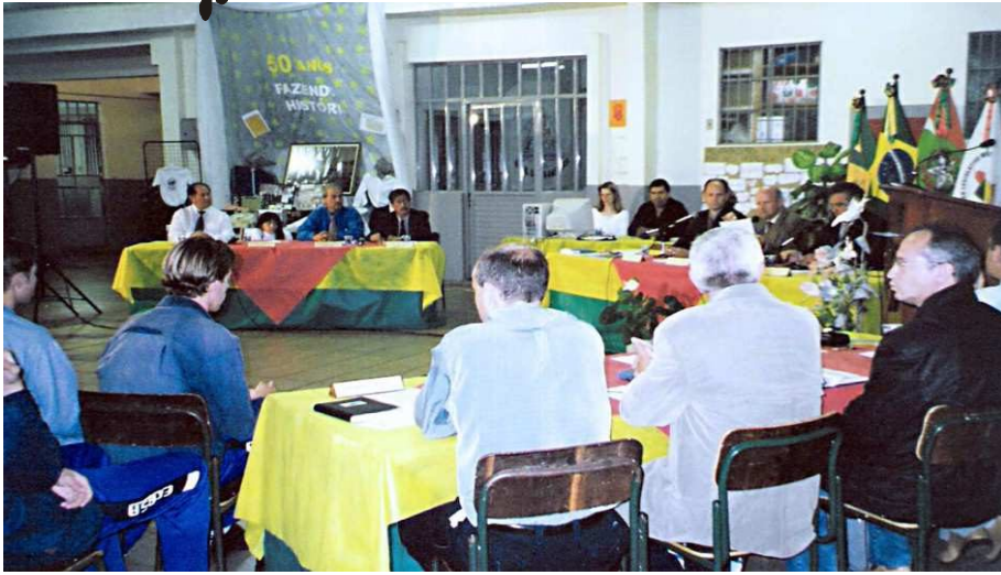
Plenário da Câmara de Vereadores na EEB. Sórora Angélica - 2003