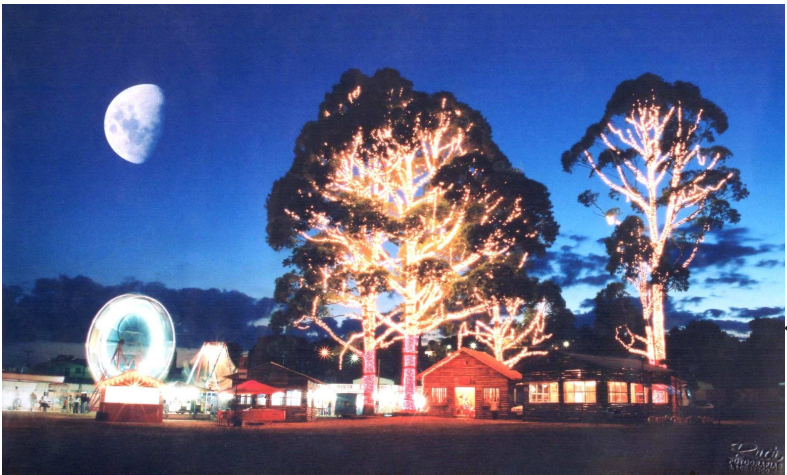
Parque do Papai Noel, ao lado do CRA - 2003

De 2003 a 2005, o Papai Noel do Brasil participou das atividades natalinas, chegando de helicóptero. Este fato levou São Lourenço do Oeste a ser matéria do Fantástico, no quadro Me Leva Brasil, do jornalista Maurício Kubrusly, da rede Globo.