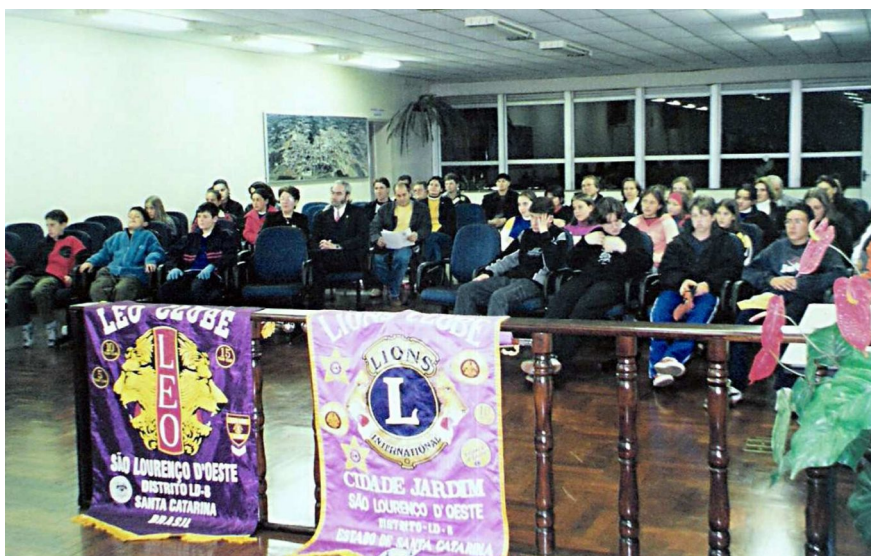
Integrantes do Lions e do Léo Club, recebendo homenagem na Câmara de Vereadores - 2003