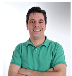
Assuero Isoton 737 votos (PTB)