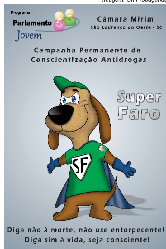
Imagem: On Propaganda

Dentre as diversas ações sociais e de cidadania, a Câmara Mirim desenvolve a Campanha Permanente de Combate ao uso de Drogas, com o slogan: “Diga não à morte, não use entorpecente! Diga sim à vida, seja consciente!” Também há a mascote Super Faro, escolhida por concurso com a participação dos alunos do município.