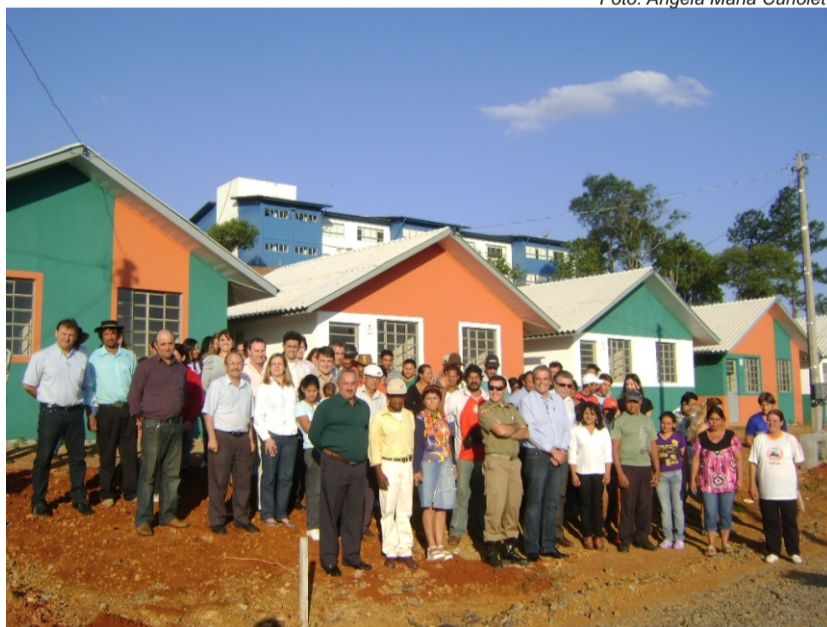
Beneficiários recebem as chaves