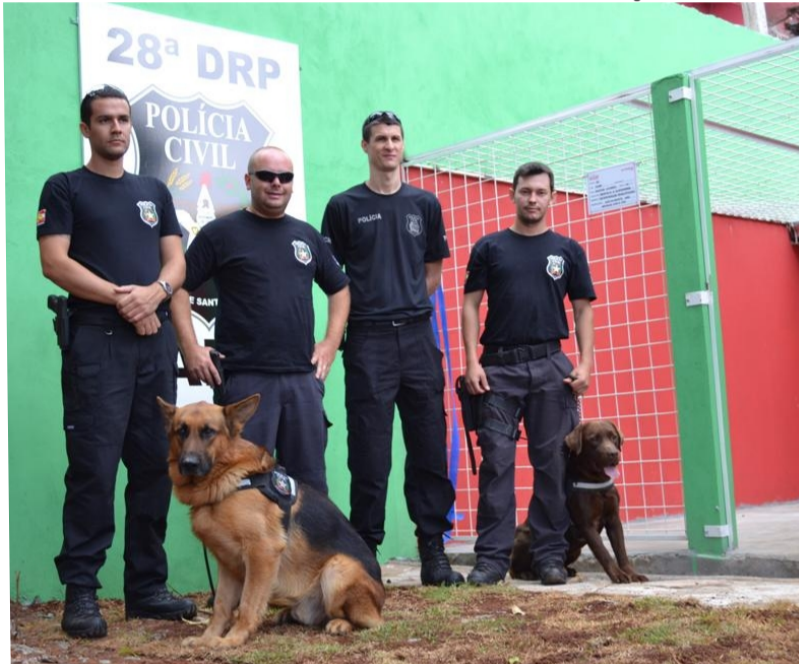
SLO possui dois cães entorpecentes.