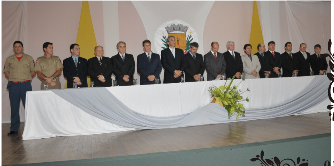
Posse do Prefeito, Vice e Vereadores no Centro Comunitário