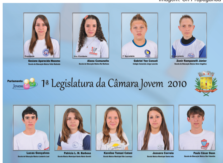
Vereadores mirins 2010