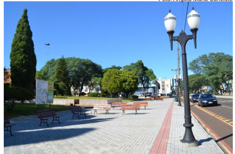
Praça da Bandeira

Em dezembro de 2011 todos puderam ver o resultado das obras na Praça Municipal da Bandeira. A antiga calçada, em frente à praça, foi retirada e ganhou nova cara com a colocação de pavers e de bancos. A mudança resulta de uma preocupação da prefeitura, porém, foi melhorada somente a parte danificada pela reurbanização da cidade, ou seja, o novo asfalto.