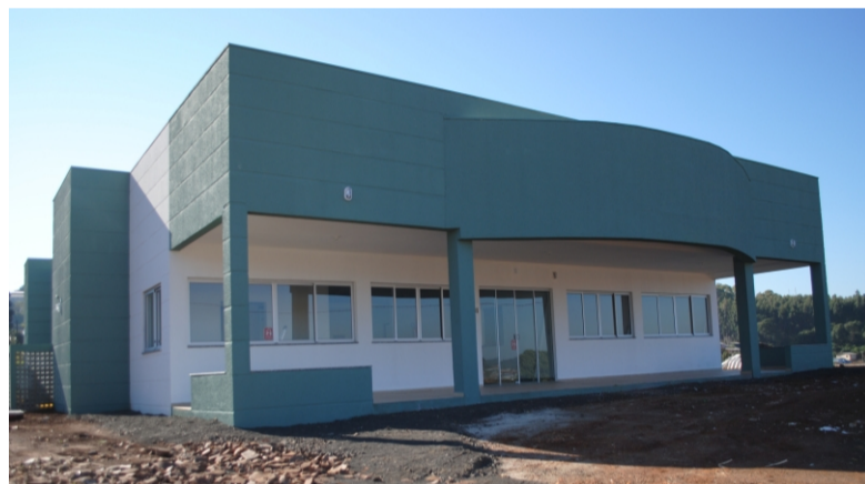
Inauguração ocorreu em julho de 2012