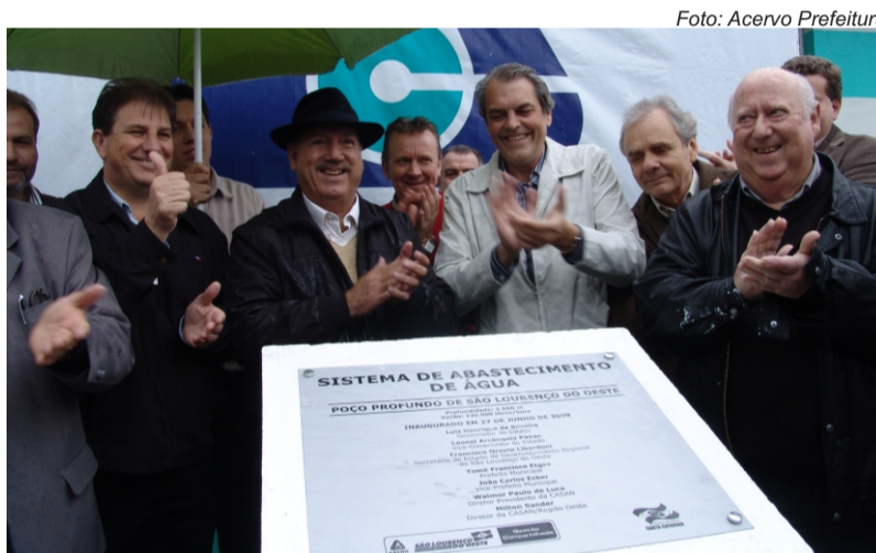
Poço foi inaugurado em junho de 2009

Vencidos os obstáculos, o Poço foi inaugurado pelo governador Luiz Henrique da Silveira no dia 27 de junho de 2009, e hoje é responsável por grande parte do abastecimento de água na cidade.