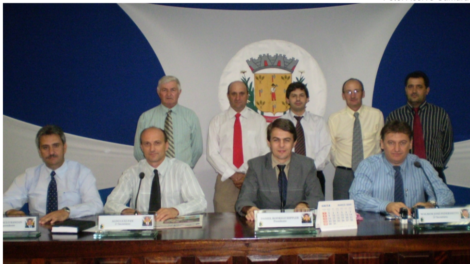
Mesa diretora 2009 / 2010 e demais vereadores