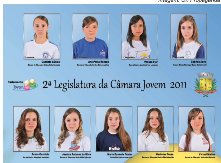
Vereadores mirins 2011