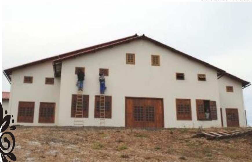
Centro Esportivo e Cultural Lageado Antunes