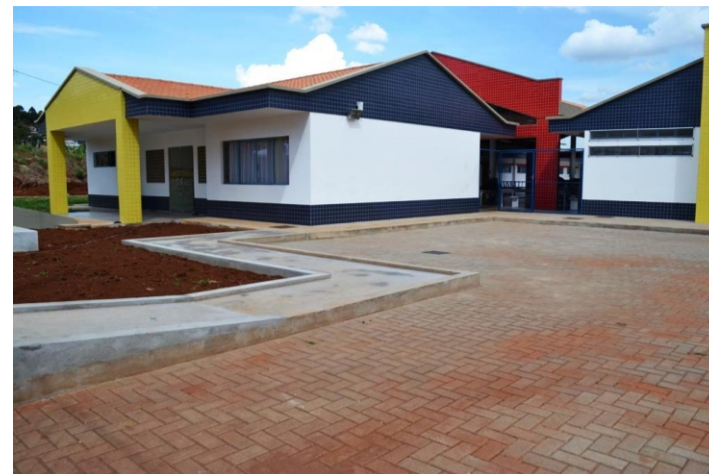
Bairro ainda não tinha escola municipal

A Rede Municipal de Ensino ganhou uma nova unidade escolar em 2012: a Monteiro Lobato, com 1.118,48m 2 , localizada no bairro Cruzeiro. Construída de acordo com os padrões estabelecidos pelo Governo Federal, tem capacidade para atender até 130 alunos de 2 a 5 anos de idade. Parte dos investimentos, ou seja, R$ 941.200,92 procedem do Fundo Nacional de Desenvolvimento da Educação (FNDE) e R$ 152.304,70 da prefeitura