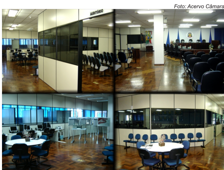
Câmara Municipal de São Lourenço do Oeste

Instalado na comunidade de São Caetano, o frigorífico de peixe tem capacidade para abater até mil quilos por dia. O novo empreendimento entrou em funcionamento no dia 10 de junho de 2009.