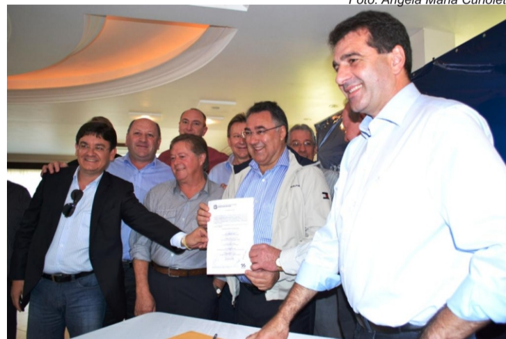
Evento ocorreu no Bela Vista Clube de Campo