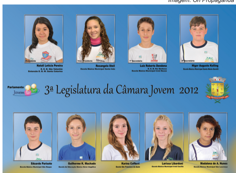
Vereadores mirins 2012