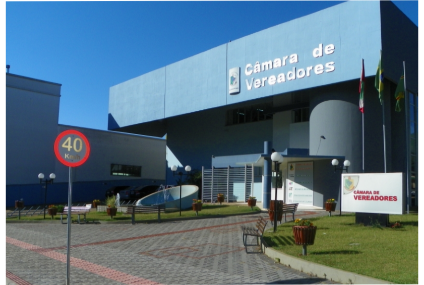
Câmara cumpre Lei de Acessibilidade

Em junho de 2010, o Legislativo deu uma nova cara ao seu jardim, com a reurbanização dos passeios e dos canteiros que ficam em frente à Casa de Leis, espaço até então não utilizado adequadamente pela população. No projeto foram contemplados o aumento dos passeios, a colocação de bancos, de postes de iluminação, de lixeiras e de floreiras. Com esta revitalização, também está cumprida a lei de acessibilidade, ou seja, foram rebaixados os meios-fios e colocados os pisos-guias para orientar as pessoas com deficiências físicas.