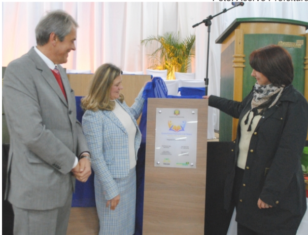
EBM Irmã Neusa