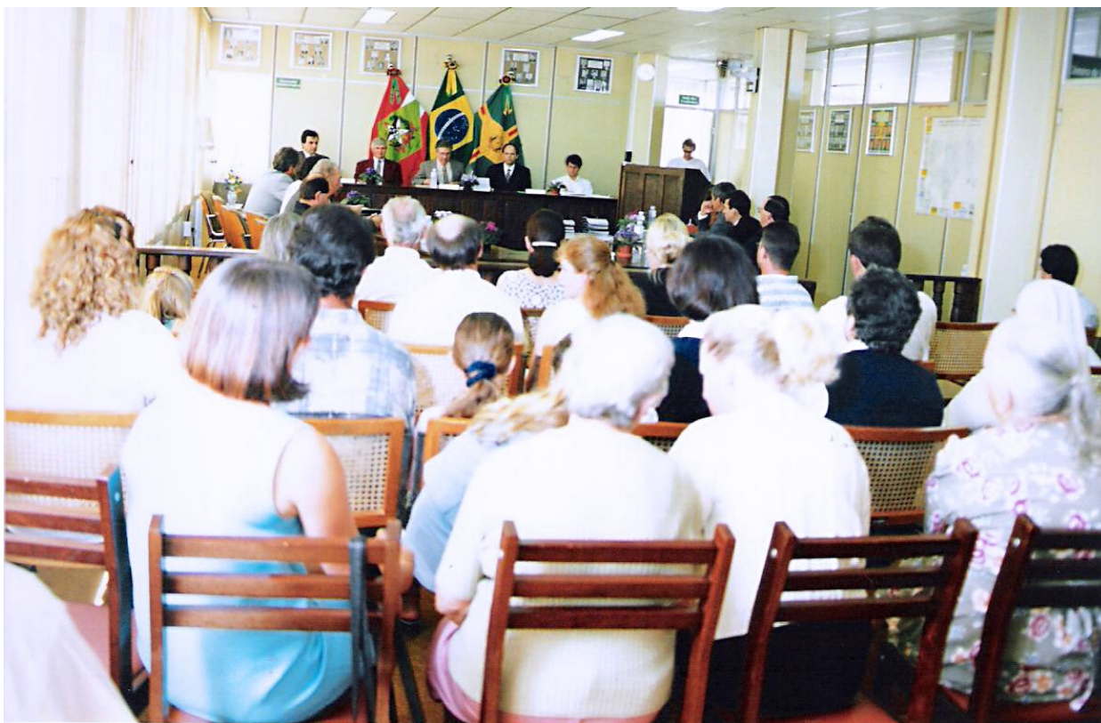
Familiares de cidadãos homenageados, em sessão solene de oficialização das leis de denominações de ruas