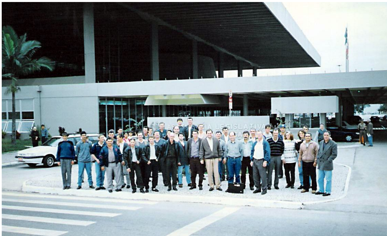
Comitiva do distrito de São Roque e da Câmara de Vereadores, na Assembléia Legislativa - agosto de 1998

A comissão pró-emancipação de São Roque continua buscando sua emancipação junto à Assembléia Legislativa e ao TRE.