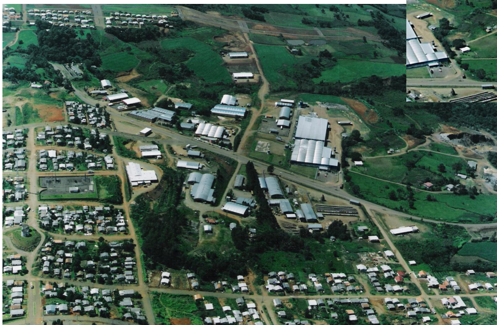
Áreas industriais I, II e Efaislo