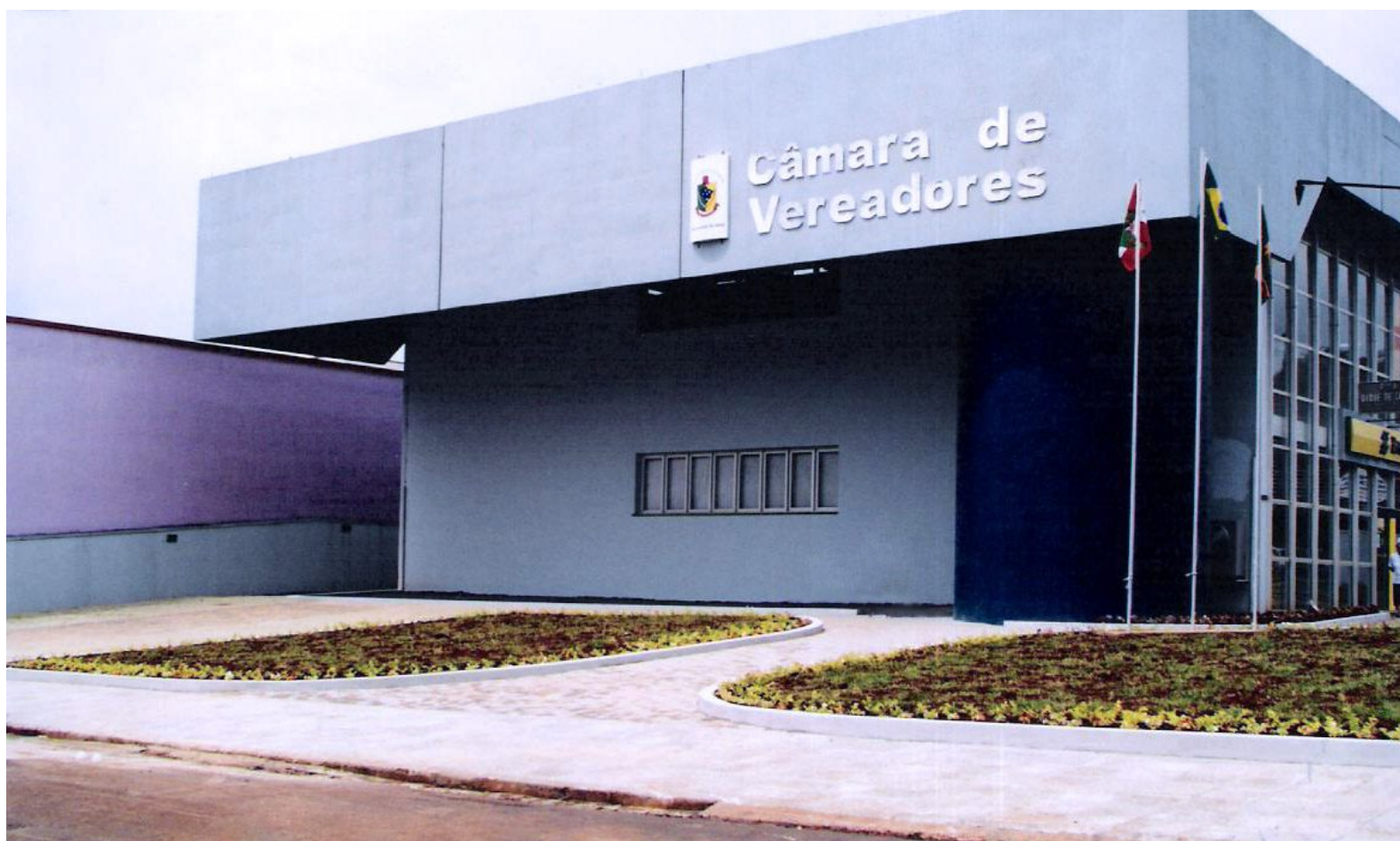
Câmara de Vereadores, locada em 1999 e adquirida em 2002.

Em razão da ampla estrutura física e da localização da Câmara de Vereadores, o local tem servido para a realização dos mais diversos eventos e atividades da sociedade lourenciana. O regimento interno, previsto na Resolução nº 140, de 31 de agosto de 1999, foi elaborado para disciplinar a utilização deste espaço.