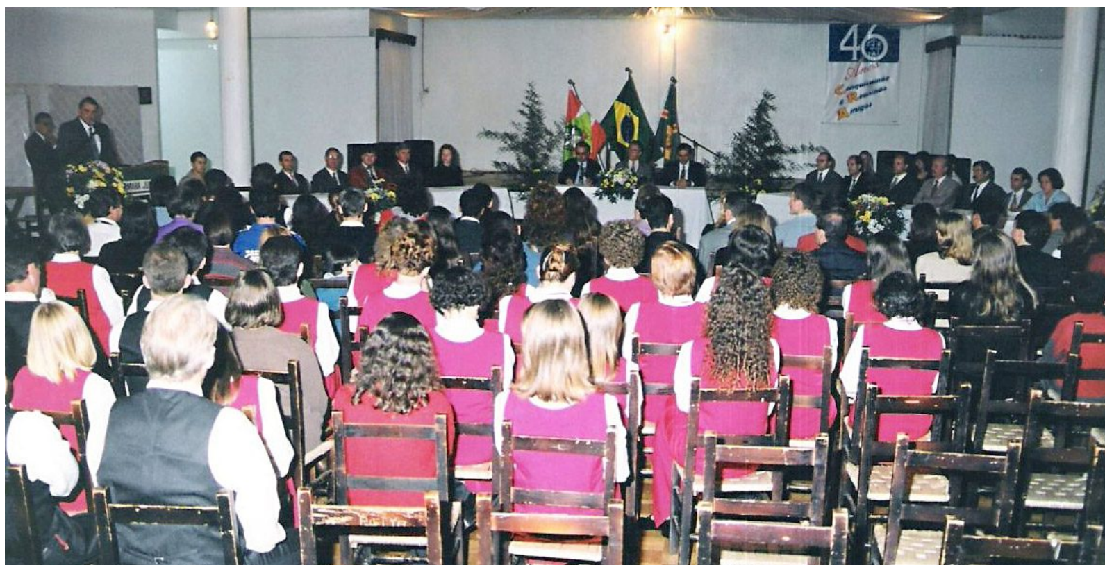
Atletas e coralistas recebendo homenagem Honóris Causa