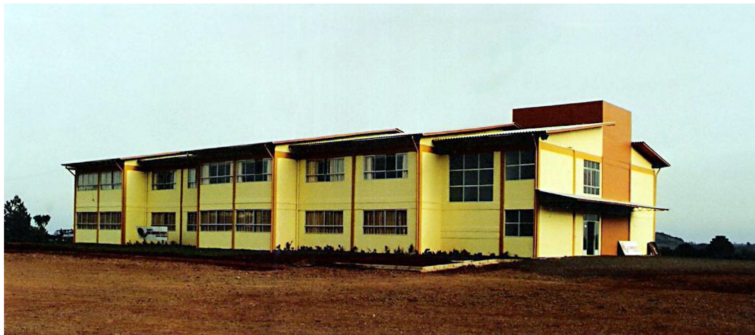
Escola Básica Municipal São Lourenço - 2002

As obras da escola iniciaram-se em 2000 e foram concluídas no mandato seguinte, em 2002. O prédio abriga o ensino fundamental da Escola Básica Municipal São Lourenço e o ensino superior da extensão da Universidade Comunitária Regional de Chapecó - Unochapecó.