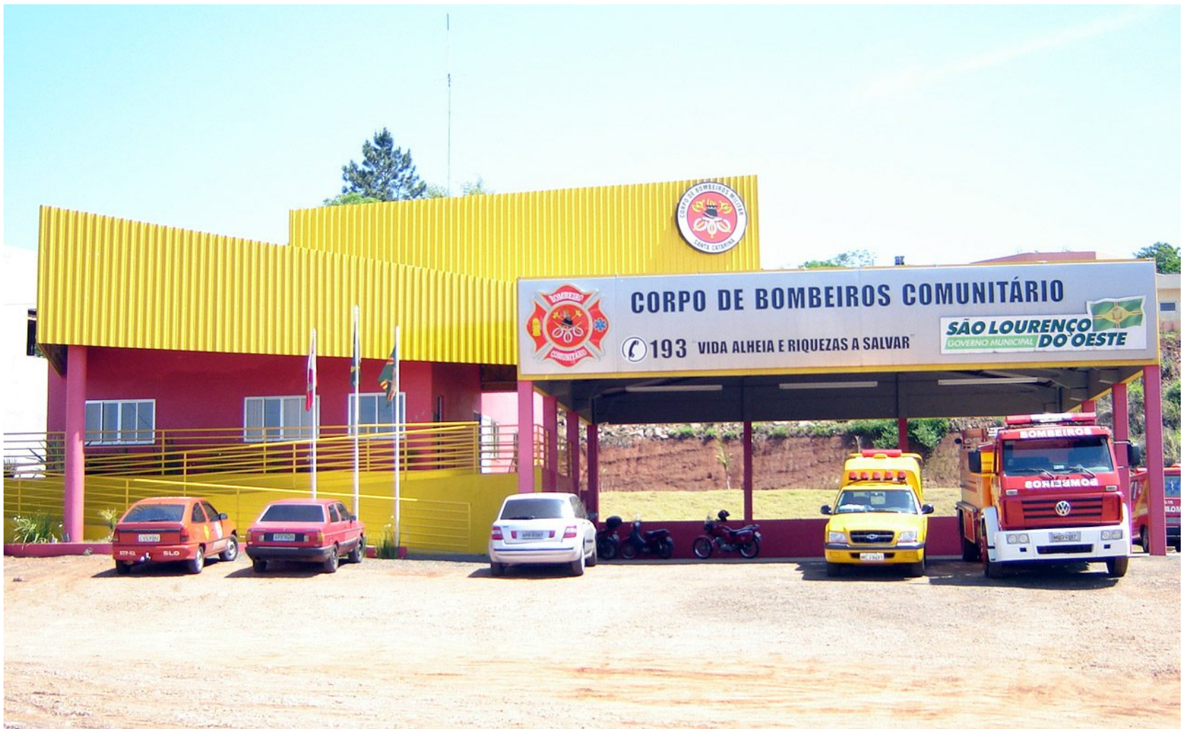
Sede do Corpo de Bombeiros de São Lourenço do Oeste - 2008

A Lei nº 1.339, de 28 de dezembro de 2001, criou o Fundo Municipal de Reequipamento do Corpo de Bombeiros da Polícia Militar de Santa Catarina - FUNREBOM. Em 2003 foram iniciadas as obras da sede do Corpo de Bombeiros, na rodovia SC-468, bairro Santa Catarina, concluída e inaugurada em 2008. Conta com diversos bombeiros militares e comunitários, um veículo de combate a incêndio, uma ambulância e mais dois veículos de apoio, além de outros equipamentos.