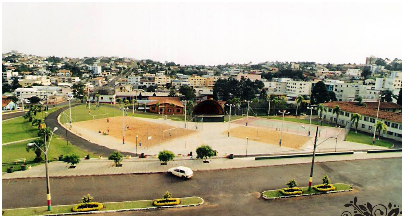
Praça da Liberdade, inaugurada em dezembro de 2000

A lei nº 1.182, de 02 de junho de 1999, denominou de “Ginásio de Esportes Margarida Rovaris” ao espaço esportivo da comunidade de Três Voltas, em homenagem à cidadã pioneira da localidade. Já a lei nº 1.288, de 19 de dezembro de 2000, de iniciativa do prefeito, nominou “Praça da Liberdade”, o espaço de lazer recém construído entre as ruas Duque de Caxias e Dom Pedro II.