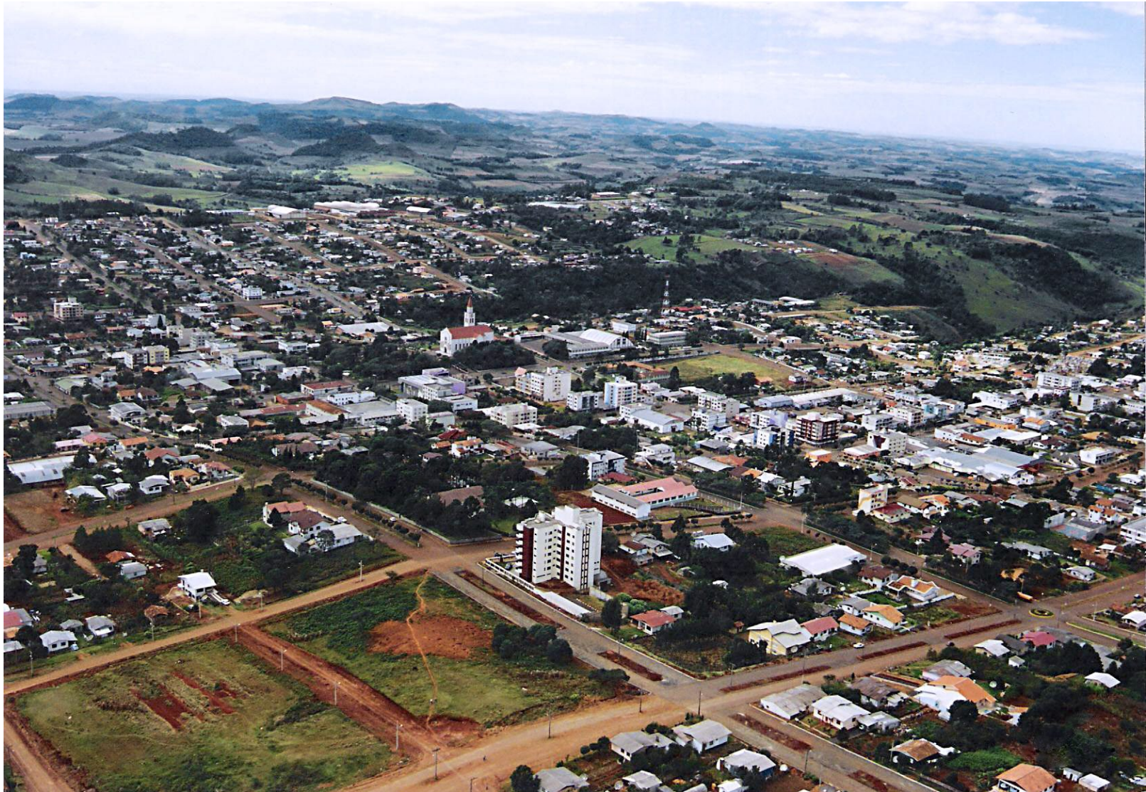
Vista da cidade a partir do bairro Perpétuo Socorro – 1997

A Lei nº 1.240, de 23 de maio de 2000, autorizou o prefeito a contrair financiamento junto à Companhia de Habitação do Estado de Santa Catarina - COHAB/SC, ou a qualquer outro órgão estadual ou federal, para a construção de 46 casas populares, destinadas a famílias de baixa renda das áreas urbana, suburbana e rural.