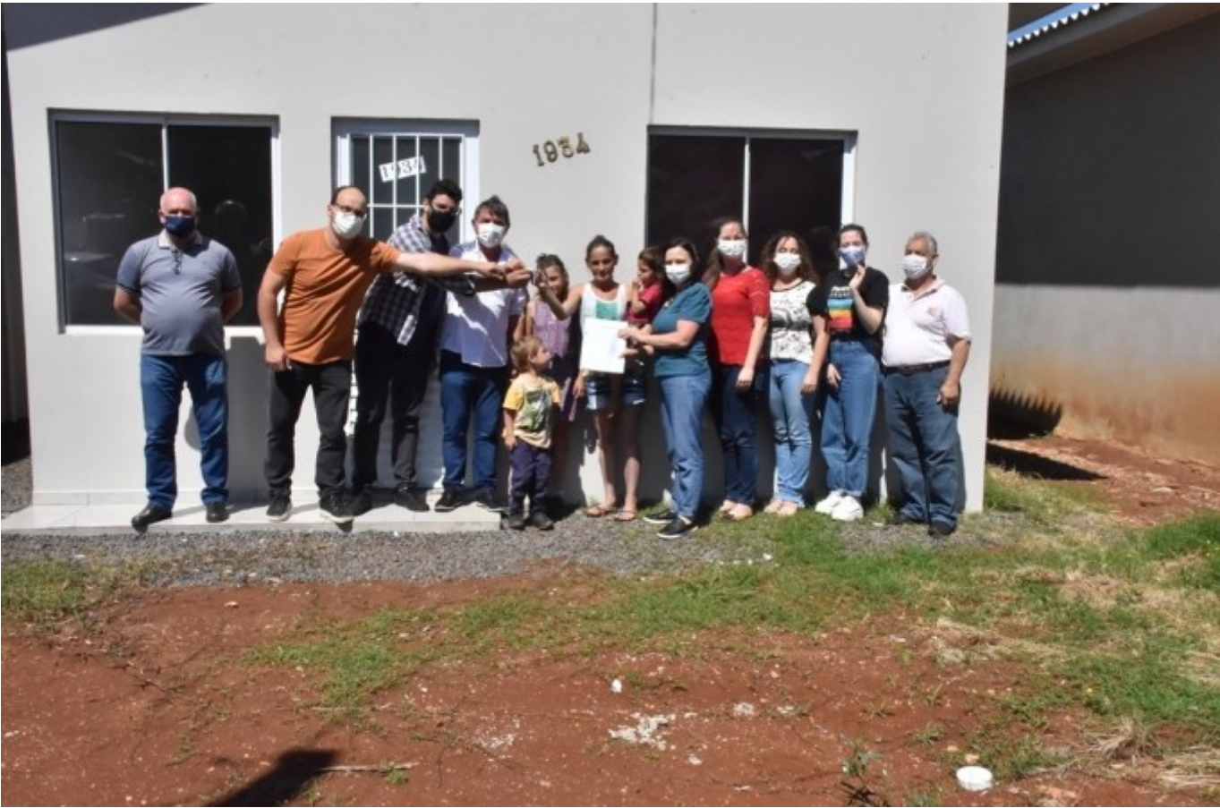
Figura 203: Autoridades entregando chaves das casas a moradores do Loteamento Vida Nova, Bairro São Francisco

Na continuidade da ação, em 08 de dezembro de 2022, foram entregues mais três unidades residenciais, no mesmo Loteamento.