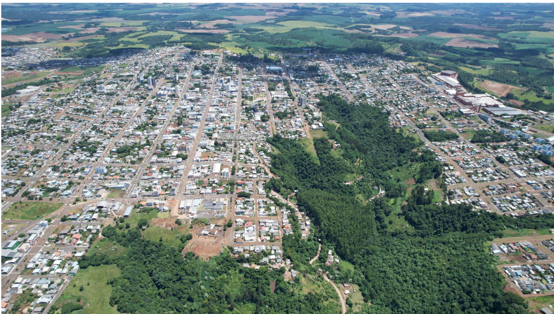
Figura 237: Foto aérea da cidade de São Lourenço do Oeste

Os dados do Censo indicam que a população do Brasil é de 203.062.512, um aumento de 6,45%. Em Santa Catarina, a população é de 7.609.601, o que representa crescimento de 21,78% quando comparado ao Censo anterior.