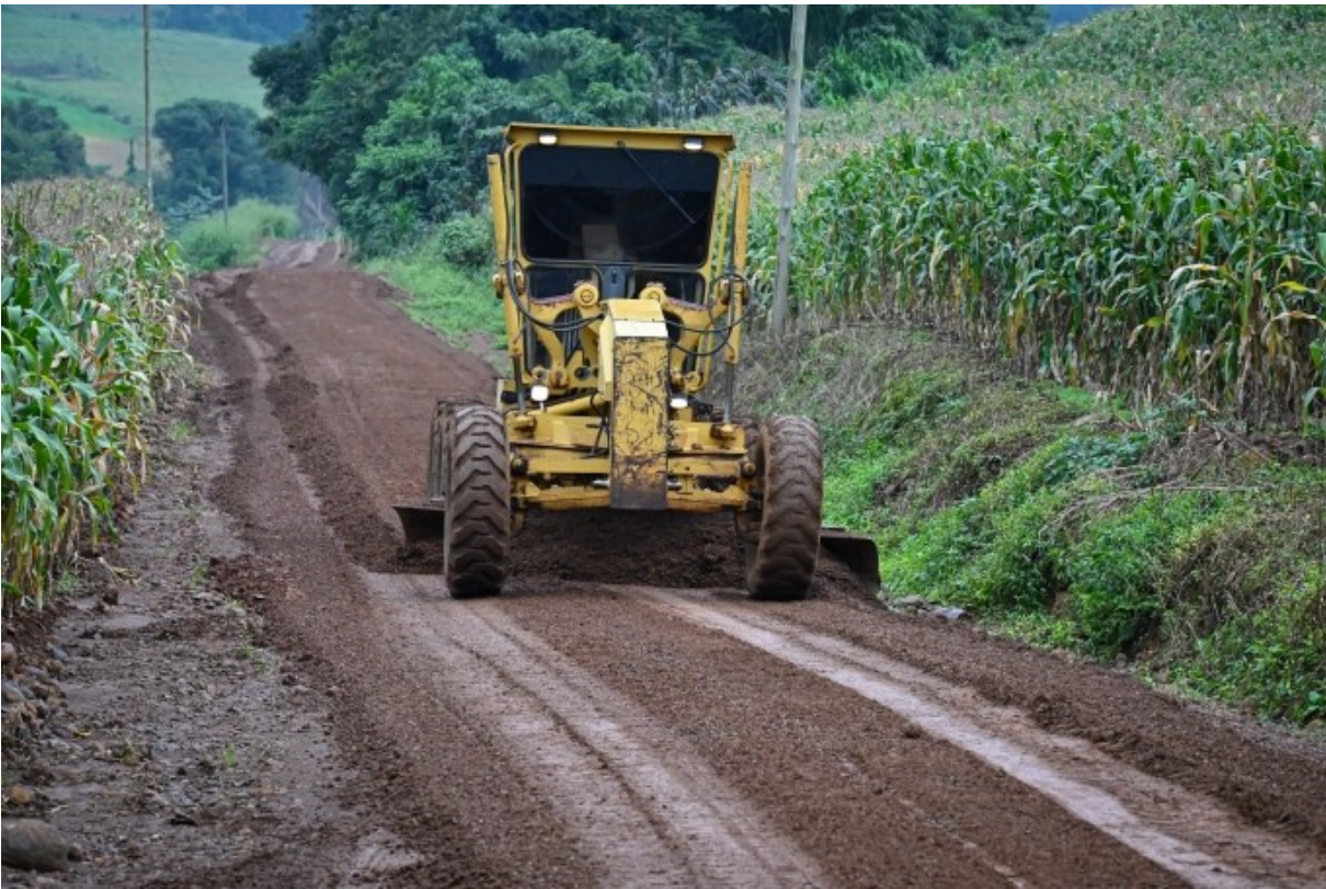
Figura 263: Estrada da Linha Pieta, Distrito de São Roque

O Departamento de Infraestrutura do Distrito de São Roque, por meio da Secretaria de Agricultura, iniciou, em maio de 2024, o trabalho de britagem na estrada da Linha Pieta. São 2,5 quilômetros que receberam a manutenção necessária para a aplicação deste material. Parte do kit de máquinas para britagem e rebritagem a ser utilizado pelo Cimam chegou em 2022. Além de São Lourenço do Oeste, integram o Consórcio os municípios de Coronel Martins, Galvão, Jupiá, Irati, Novo Horizonte, Quilombo e São Bernardino. Inicialmente, a ideia era uma usina de asfalto, mas, a partir de estudos e visitas feitos na região pelos prefeitos, a usina de britagem e rebritagem tornou-se mais viável.