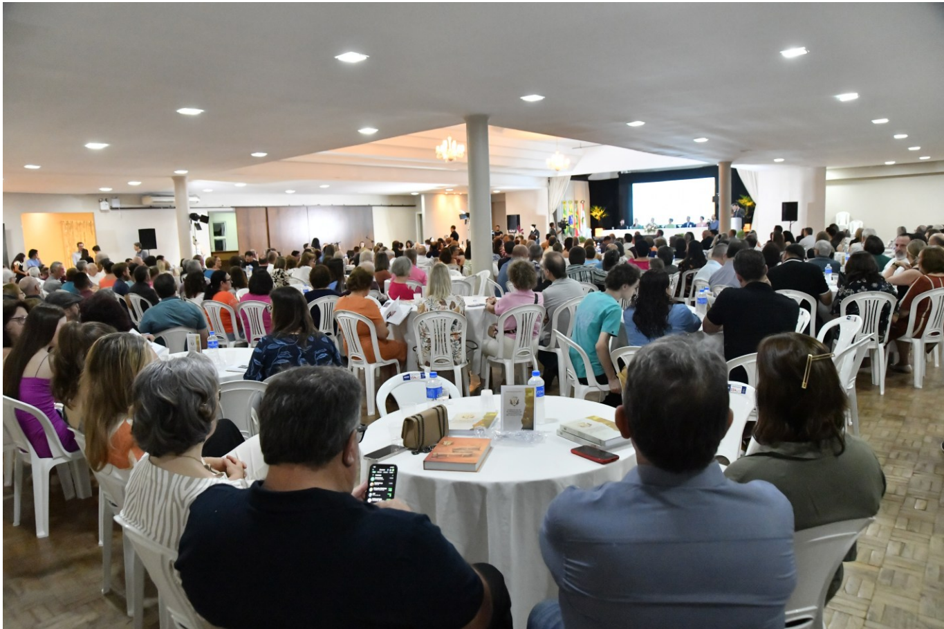
Figura 88: Evento de lançamento do livro As histórias por trás das denominações dos espaços públicos de São Lourenço do Oeste

No dia do lançamento foram vendidas 154 unidades. No entanto, dez dias após o lançamento, não havia mais exemplares para a venda.