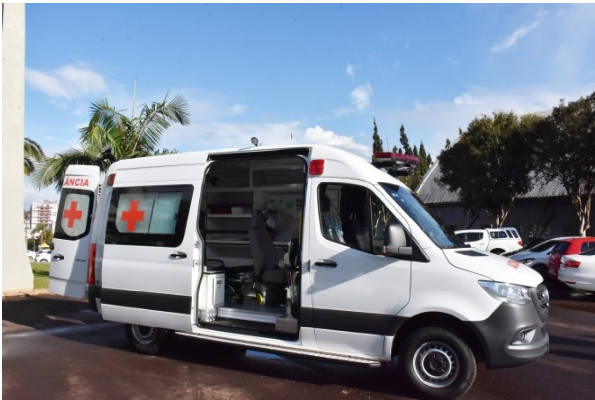
Figura 182: Ambulância UTI móvel

Em junho de 2021, o Governo Municipal recebeu a primeira ambulância UTI móvel, que tem, entre outros equipamentos: aspirador portátil elétrico, oxímetro portátil, desfibrilador externo automático, sistema de oxigênio, cadeira de rodas e maca de resgate e salvamento. O valor do veículo é R$ 240.900,00, adquirido com recursos de emenda parlamentar do deputado federal Celso Maldaner.