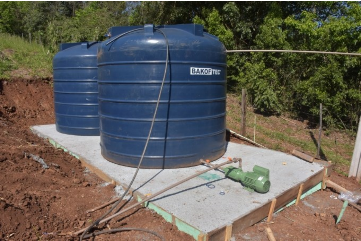
Figura 220: Cisterna instalada em propriedade do Distrito de São Roque

A Secretaria de Agricultura investiu em cisternas e na proteção de fontes de água, conhecidas como “fonte caxambu”. Somente nas comunidades de Ouro Verde, Sant’Ana da Bela Vista, Planalto, Prata e São Roque, 60 famílias receberam o benefício com a proteção de 48 fontes. Ainda, o Distrito foi contemplado com investimentos para a instalação de 12 cisternas a serem utilizadas na suinocultura e na bovinocultura de leite.