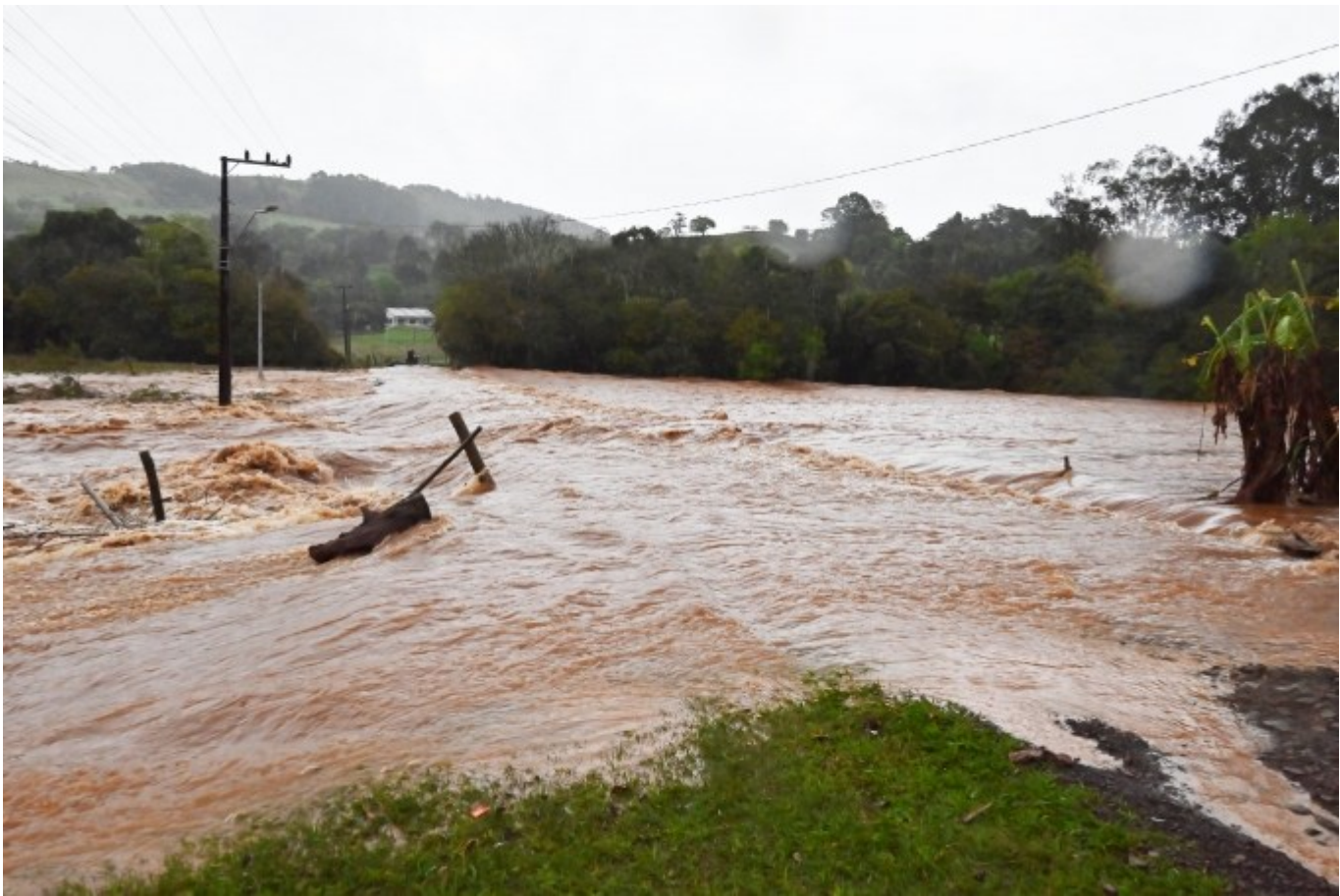
Figura 222: Enchente em Frederico Wastner

Inundações, alagamentos e deslizamentos de terra, residências ilhadas devido à derrubada de pontes e estradas interditadas foram alguns dos efeitos do excesso de chuva. Também houve devastação de lavouras e diversos danos em várias comunidades, além de danos na área urbana.