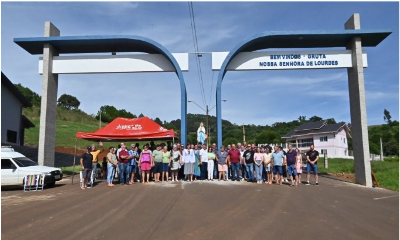
Figura 251: Autoridades e moradores na inauguração do portal da Gruta Nossa Senhora de Lourdes, de Presidente Juscelino

Em 03 de março de 2024, um culto organizado pela comunidade marcou a inauguração do portal da Gruta Nossa Senhora de Lourdes, de Presidente Juscelino. Para a construção, o município investiu R$ 104.988,66 de recursos próprios, e a empresa responsável pela execução foi a Algetec Engenharia e Construção Ltda.