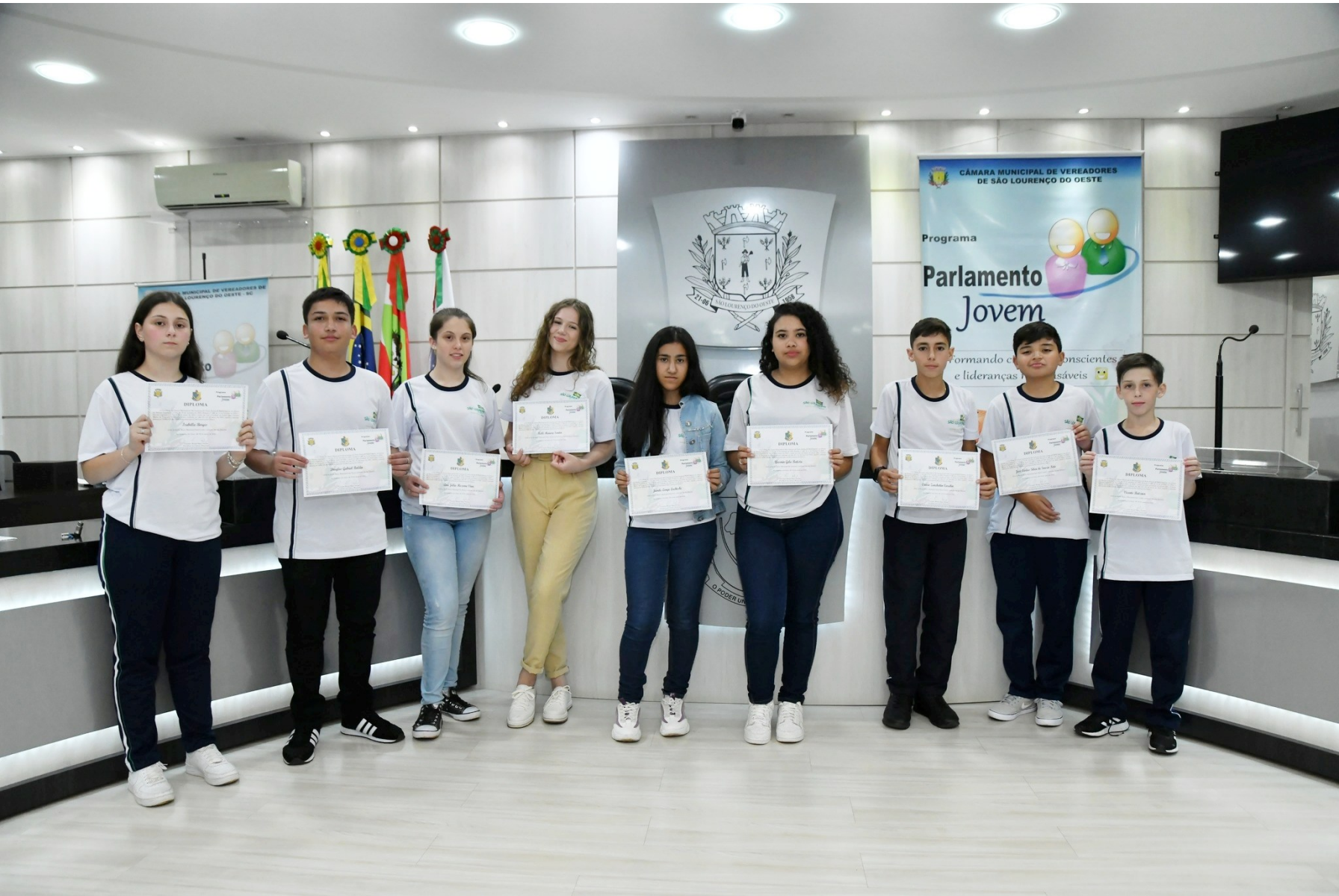
Figura 146: Diplomação e posse dos vereadores mirins, 12ª legislatura, em 2023