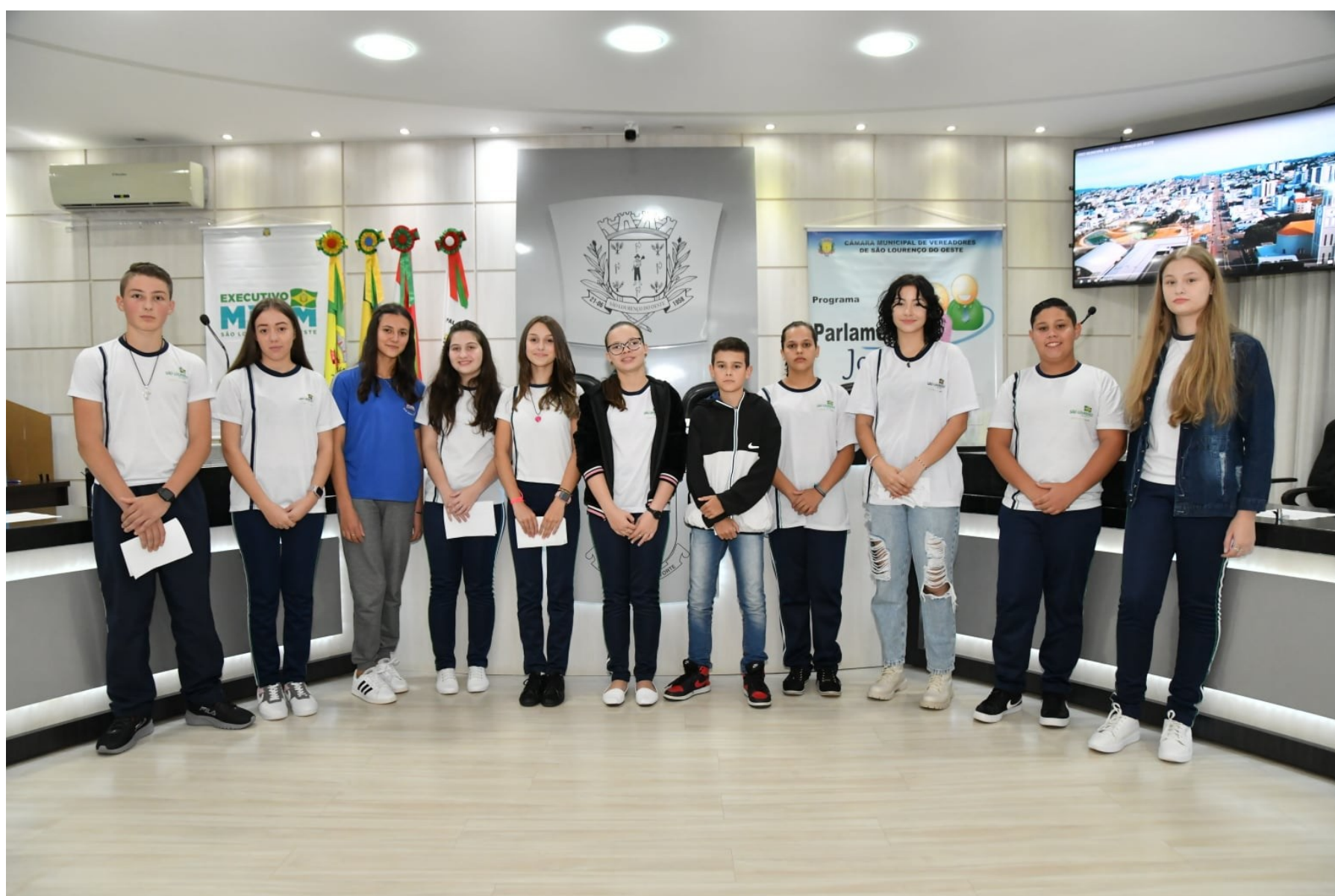
Figura 136: Executivos mirins 2022 são diplomados e empossados na Câmara Municipal