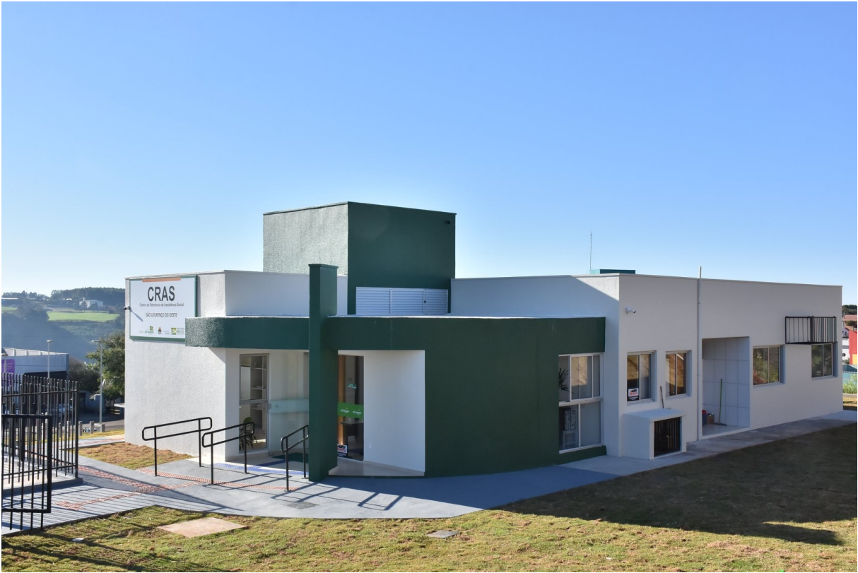
Figura 208: Centro de Referência de Assistência Social

Para a construção dos 98,57 m 2 destinados ao auditório do CRAS, o município investiu R$ 136.414,48, sendo R$ 100.000,00 de recursos do cofinanciamento do Estado. O novo espaço foi programado para a realização de atividades coletivas orientadas pela equipe técnica do CRAS, que executa o Programa de Proteção e Atendimento Integral à Família (Paif). De caráter continuado, o trabalho consiste na proteção às famílias, além de prevenir a ruptura dos seus vínculos, promover seu acesso e usufruto de direitos e contribuir na melhoria de sua qualidade de vida. Consta que o auditório compõe a sede própria do CRAS, inaugurada em junho de 2020, na qual foram investidos R$ 290.978,77, sendo R$ 278.200,28 advindos do Ministério da Cidadania, viabilizados por emenda parlamentar do deputado federal Celso Maldaner, e, o restante, configurou-se como contrapartida da prefeitura, além da disponibilização do terreno.