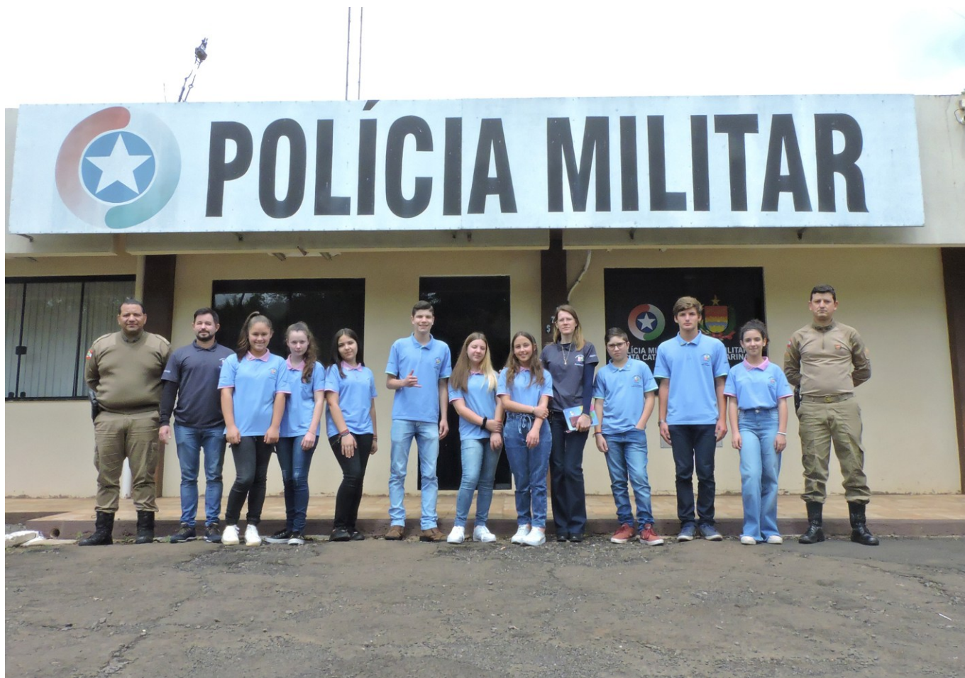
Figura 143: Vereadores mirins em visita à sede da Polícia Militar de São Lourenço do Oeste