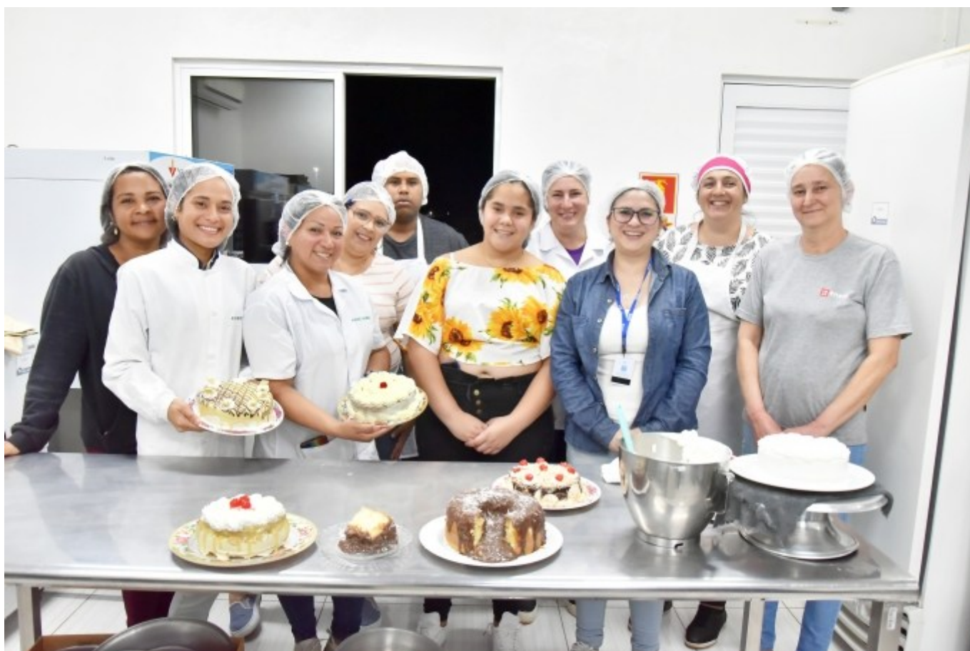
Figura 219: Curso de panificação e confeitaria para venezuelanos.

Para a formação, o município investiu R$ 49.301,63, um recurso de repasse emergencial do Ministério da Cidadania, com o fim específico de ofertar ações socioassistenciais nos municípios que receberam imigrantes e refugiados do fluxo migratório, provocado por crise humanitária e agravada pela emergência em saúde pública decorrente da covid-19.