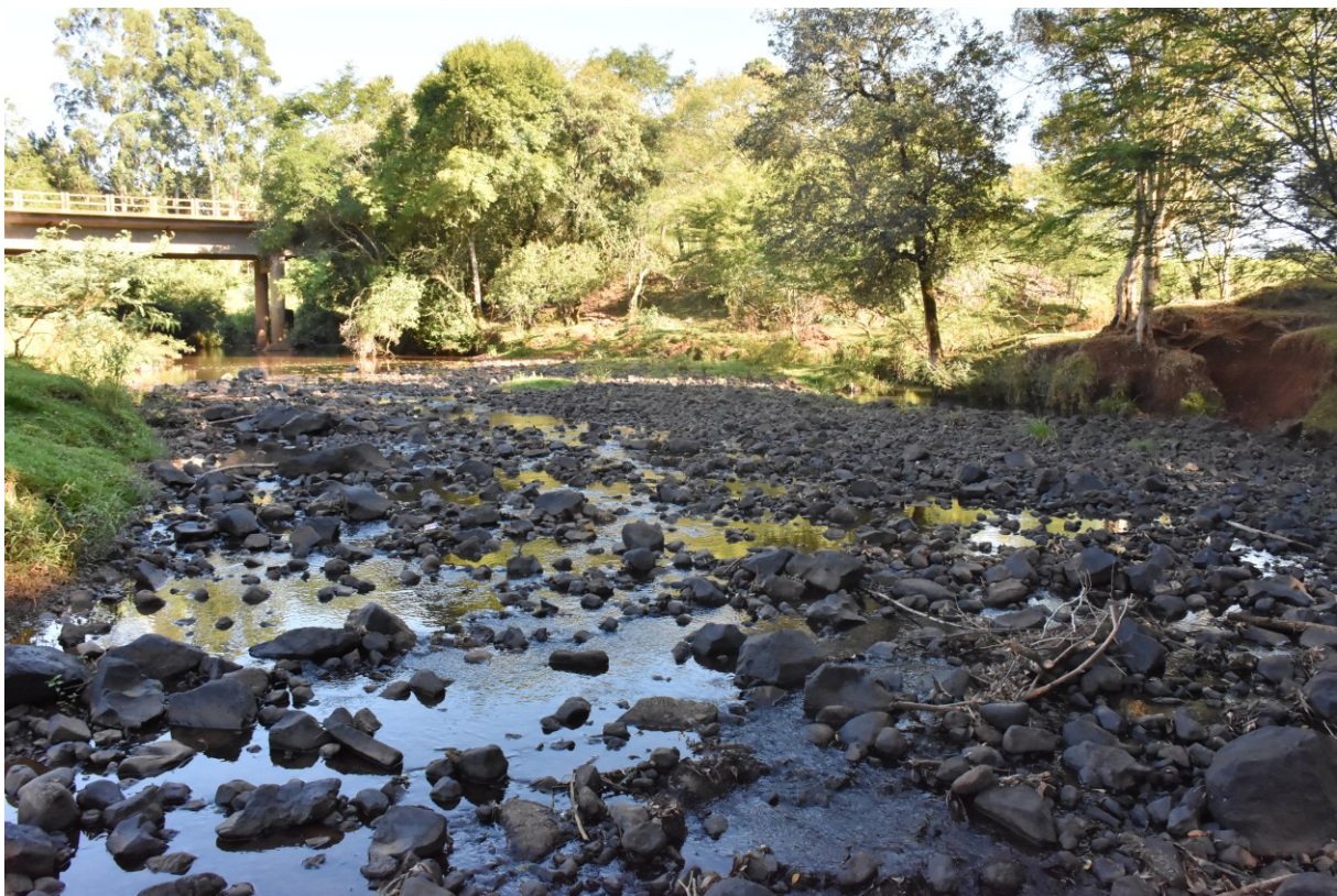
Figura 205: Rio Macaco, na época da estiagem

Na continuidade às ações de combate à estiagem, ainda em janeiro de 2022, a Secretaria de Agricultura intensificou os trabalhos a fim de amenizar os prejuízos, mas sem afetar o atendimento. Foram colocados à disposição dos agricultores quatro distribuidores de esterco e dois caminhões com caixas d'água adaptadas para transportar água de consumo animal. Os equipamentos poderiam ser solicitados nos departamentos de infraestrutura dos Distritos de Frederico Wastner, Presidente Juscelino e São Roque. Além disso, para consumo humano, caracterizados como casos extremos, o caminhão pipa da prefeitura captou água em alguns poços artesianos particulares. Ainda, nas comunidades, seis máquinas da Secretaria de Agricultura trabalharam na limpeza e na abertura de fontes.