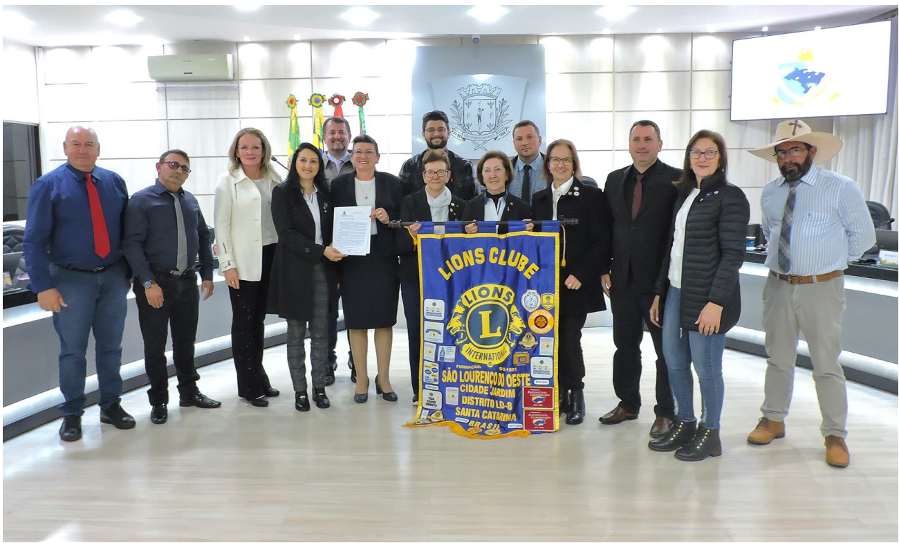
Figura 125: Entrega da Moção de Congratulação a representantes do Lions Clube Cidade Jardim