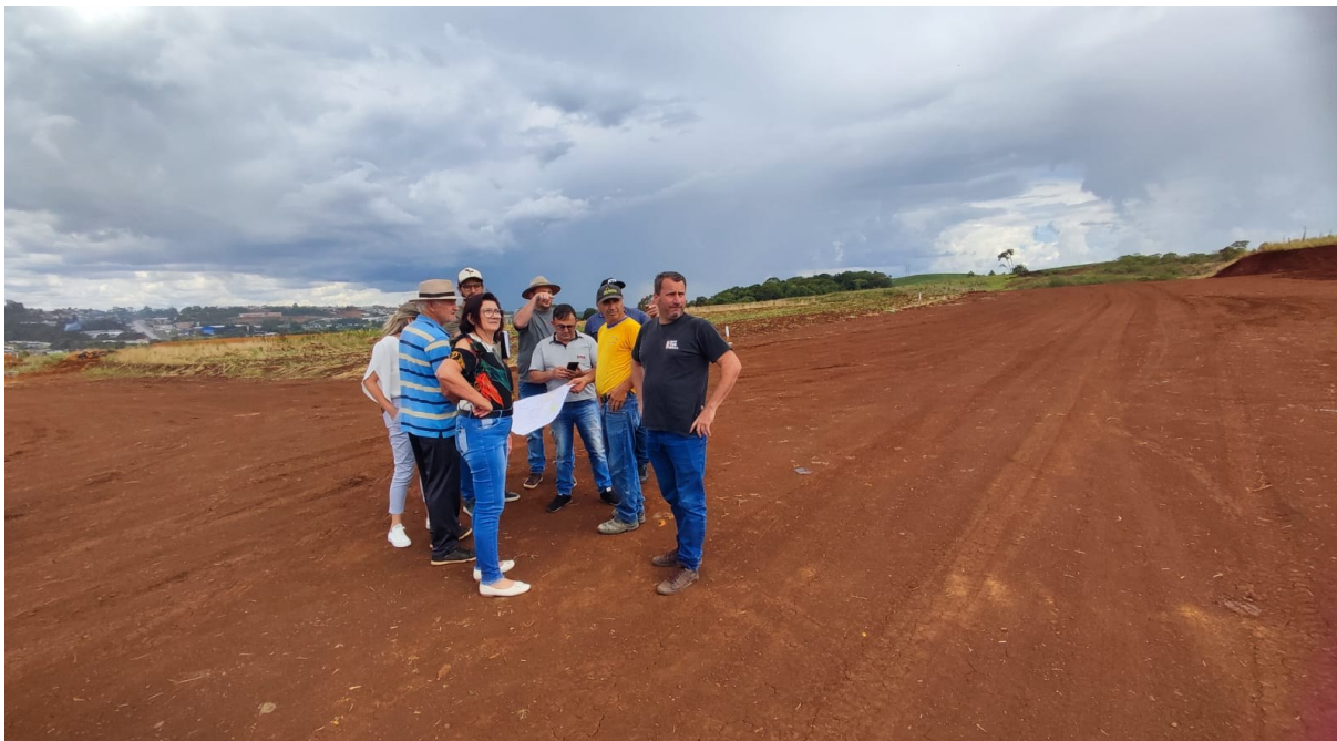
Figura 47: Vereadores em visita à área do Loteamento Dona Matilde, Bairro Cruzeiro