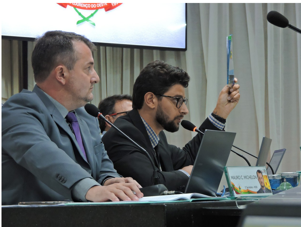
Figura 51: Aprovação do novo Regimento Interno da Câmara Municipal

São 133 páginas destinadas ao Regimento Interno da Casa Legislativa e 13 ao Código de Ética e Decoro Parlamentar, mas em documento único, disponível no site da Câmara Municipal.