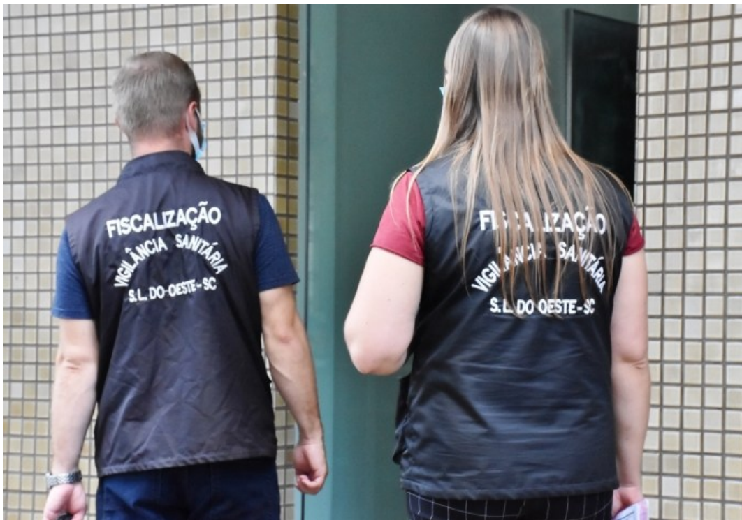
Figura 280: Profissionais da Vigilância Sanitária em fiscalização a estabelecimentos

As forças de segurança atenderam aos decretos estaduais e fizeram os procedimentos necessários, com interdição e autuações formalizados pela Vigilância Sanitária de São Lourenço do Oeste. Esta ação foi executada durante todo o período de carnaval.