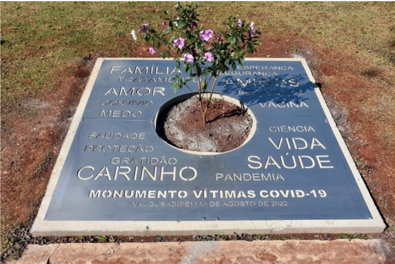
Figura 216: Memorial na Praça da Bandeira, em homenagem às vítimas da covid-19

Outro ponto de visitação é o Memorial da Praça da Bandeira. Nele, um pouco da história do local, desde a construção e suas revitalizações, além da obra da Igreja Matriz, um símbolo do município e que se mistura aos relatos da praça.