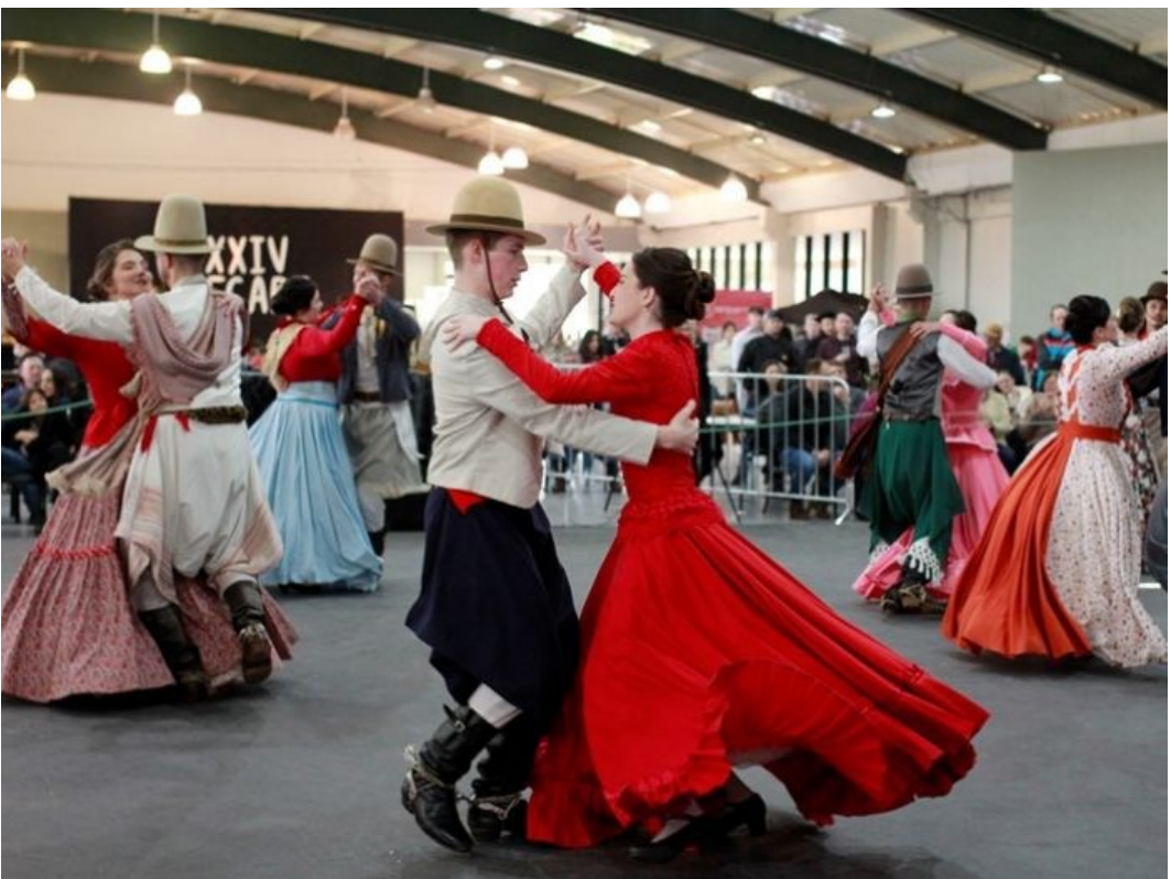
Figura 296: Invernada artística do CTG Amizade sem Fronteiras, em apresentação no 24º Fecart/2022, em São Lourenço do Oeste

O CTG Amizade sem Fronteiras somou 1.490 pontos e sagrou-se campeão geral nas categorias: danças tradicionais (mirim, juvenil, veterano e adulto); danças birivas; conjunto vocal adulto; danças de salão (mirim, juvenil, veterana, adulto e xiru); causo; declamação (prenda e peão pré-mirim, prenda e peão mirim, prenda juvenil, veterana, adulta e peão adulto); solista vocal (prenda mirim, adulta e veterana, peão adulto e veterano); mais prendada prenda (mirim, juvenil, adulta e veterana); gaita tecla (juvenil, adulto e veterano); violino; poesia inédita; e trova mi maior de gavetão.