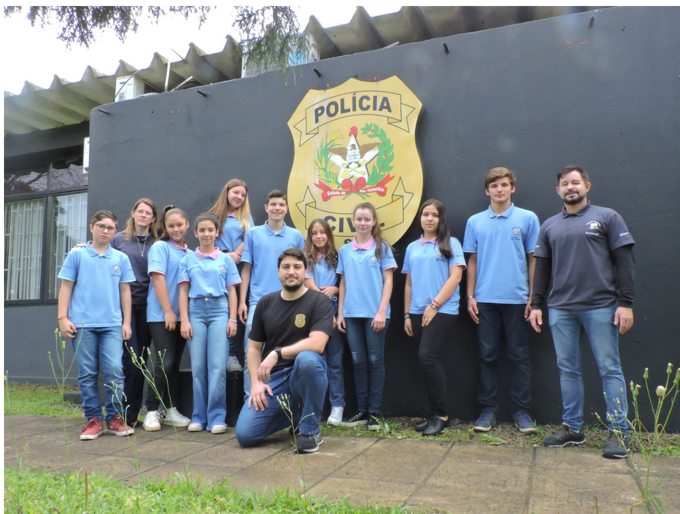
Figura 142: Vereadores mirins em visita à DPCAMI de São Lourenço do Oeste