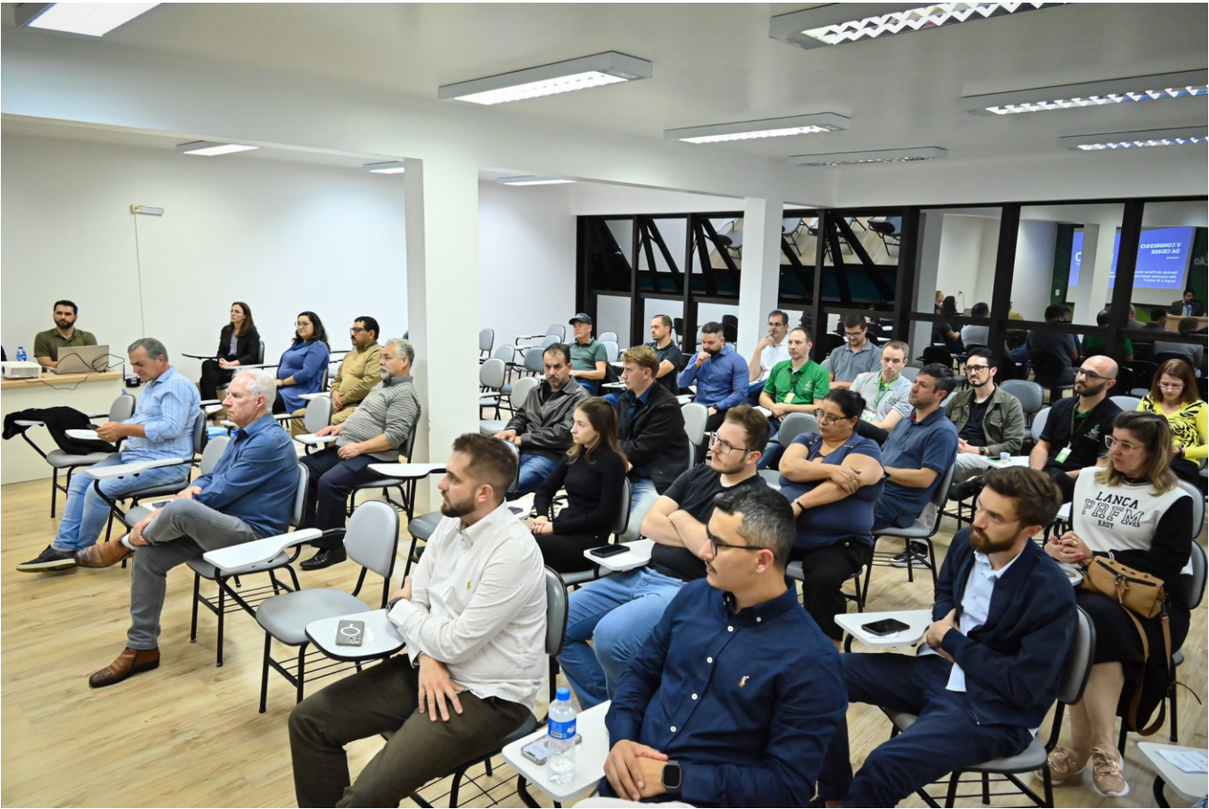
Figura 264: 5º Conselho da Cidade de São Lourenço do Oeste

Caracteriza-se o Concislo como um órgão colegiado que reúne representantes do poder público e da sociedade civil, de caráter permanente, deliberativo, consultivo e propositivo integrante da Secretaria de Planejamento e Desenvolvimento Urbano. Também busca promover o desenvolvimento territorial e urbanístico municipal, sempre considerando a integração com a área rural; garantir a efetiva participação da sociedade em todas as fases do processo de planejamento e gestão territorial e urbanística; e integrar políticas e ações responsáveis pela intervenção urbana, sempre considerando a integração com a área rural.