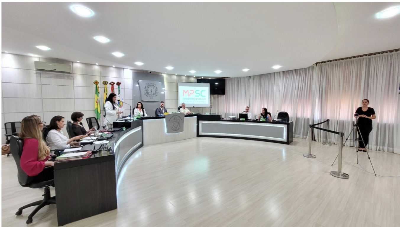
Figura 98: Seminário sobre Direito Animal