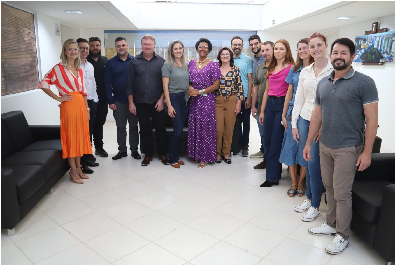
Figura 58: Vereadores e servidores da Câmara Municipal de São Lourenço do Oeste em visita à Câmara de Pato Branco