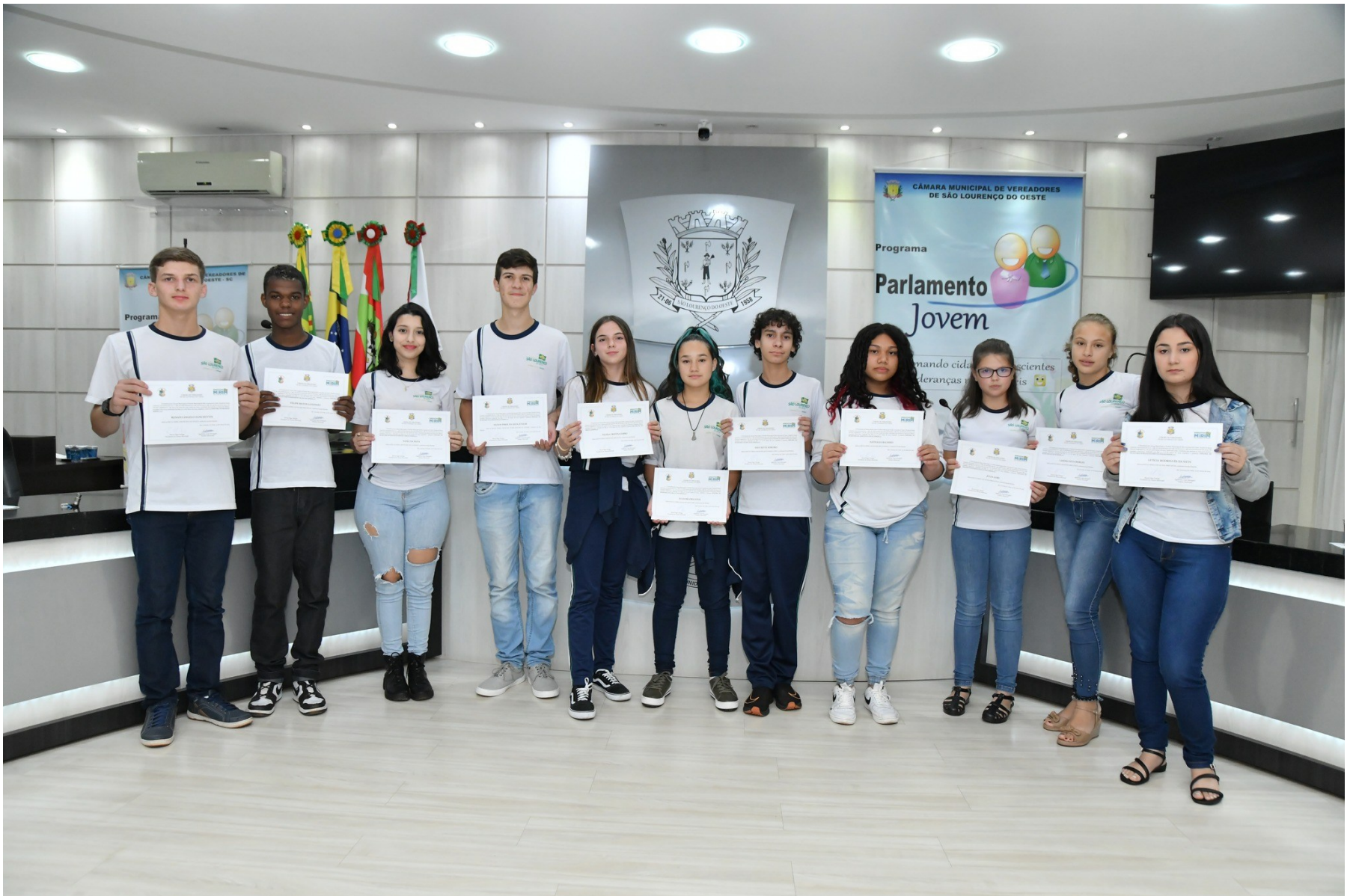
Figura 147: Executivos mirins 2023, diplomados e empossados na Câmara Municipal

Para auxiliar as Câmaras e Executivo Mirins da região no desempenho do mandato recém-iniciado, em 05 de abril houve capacitação, no auditório da Casa de Leis de São Lourenço do Oeste, envolvendo os municípios que compõem a Acanor. No evento, desenvolvido em parceria com a Escola do Legislativo da Alesc, foram tratados os temas: o papel do vereador; Constituição Federal e o Poder Legislativo; e argumentação e oratória.