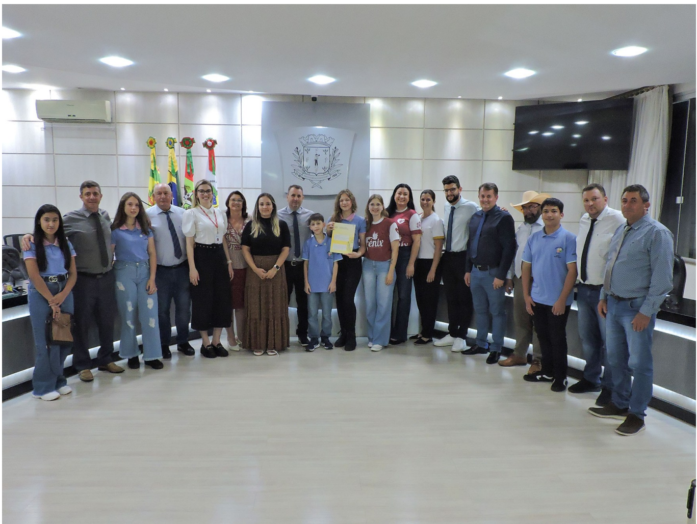
Figura 76: Legislativo, vereadores, mirins, representantes do Ministério Público de São Lourenço do Oeste e da ONG Protetora dos Animais Fênix

Tem como principal objetivo estabelecer convívio harmonioso entre humanos e não humanos, a partir de investimentos em educação e saúde, além de utilizar as leis vigentes sobre bem-estar animal para, mais do que punir, conscientizar a população sobre seus deveres na relação com os animais. O projeto deu origem à Lei Ordinária n. 2.819, de 22 de novembro de 2023.