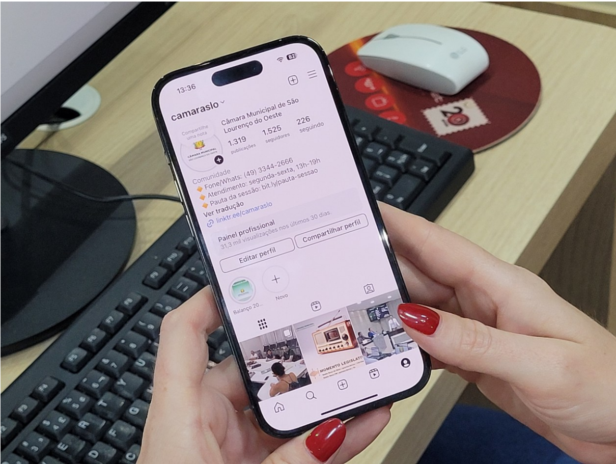
Figura 26: Novos perfis da Câmara Municipal nas redes sociais

Desde 02 de março de 2022, o Poder Legislativo conta com duas novas ferramentas de interação e de contato com a comunidade. Além do site, do telefone e do e-mail, passou a repassar suas informações em tempo real pelo Instagram e pela lista de transmissão no whatsapp. Basta seguir na rede social @camaraslo ou adicionar no WhatsApp o número (49)3344-2666, mandar a palavra “oi” e será incluído na lista referida.