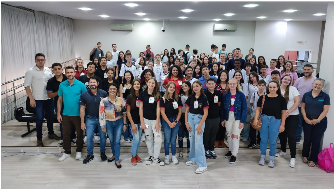
Figura 148: Vereadores mirins das Câmaras pertencentes à Acanor, em capacitação no Plenário Vereador Lídio Sutilli

Para auxiliar as Câmaras e Executivo Mirins da região no desempenho do mandato recém-iniciado, em 05 de abril houve capacitação, no auditório da Casa de Leis de São Lourenço do Oeste, envolvendo os municípios que compõem a Acanor. No evento, desenvolvido em parceria com a Escola do Legislativo da Alesc, foram tratados os temas: o papel do vereador; Constituição Federal e o Poder Legislativo; e argumentação e oratória.