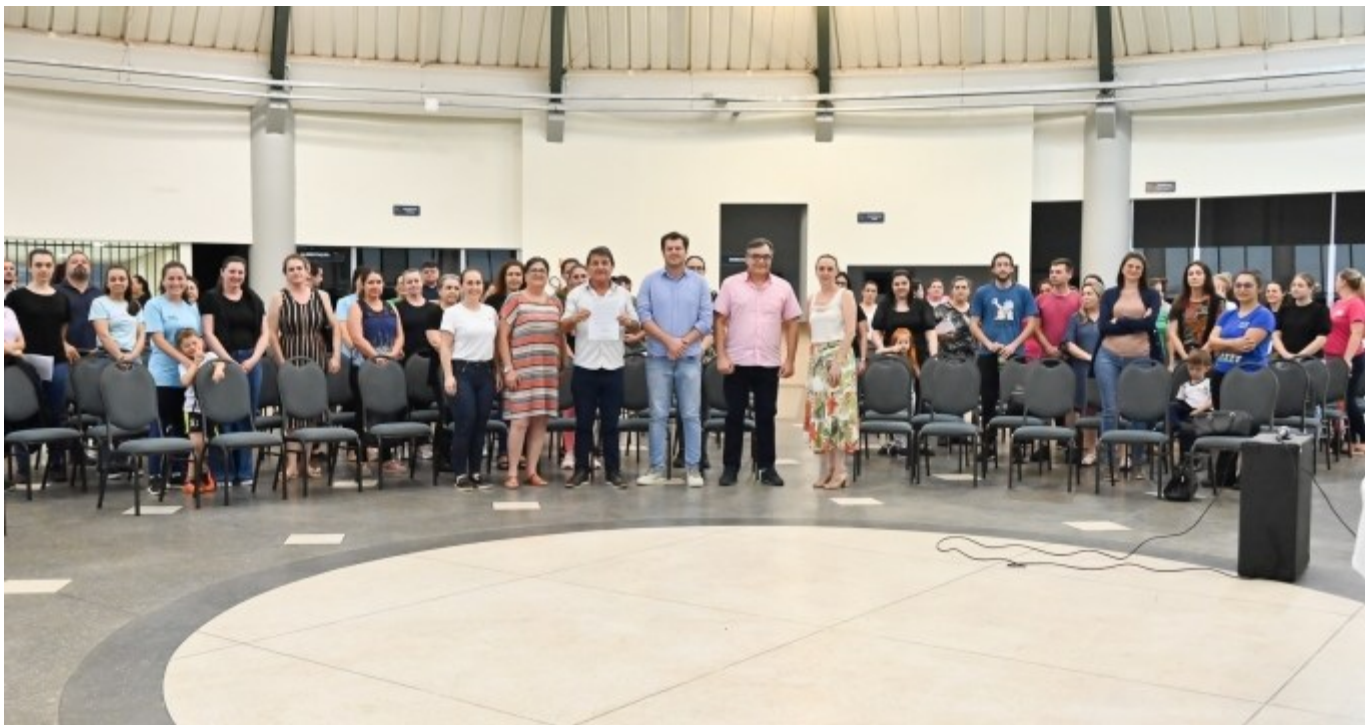
Figura 247: Autoridades e profissionais do magistério público municipal

A Secretaria de Educação identificou a necessidade de alterar e atualizar o Plano para contemplar as demandas que surgiram ao longo dos 16 anos de sua vigência. Com isso, a Lei Complementar n. 90, de 26 de dezembro de 2007, foi alterada.