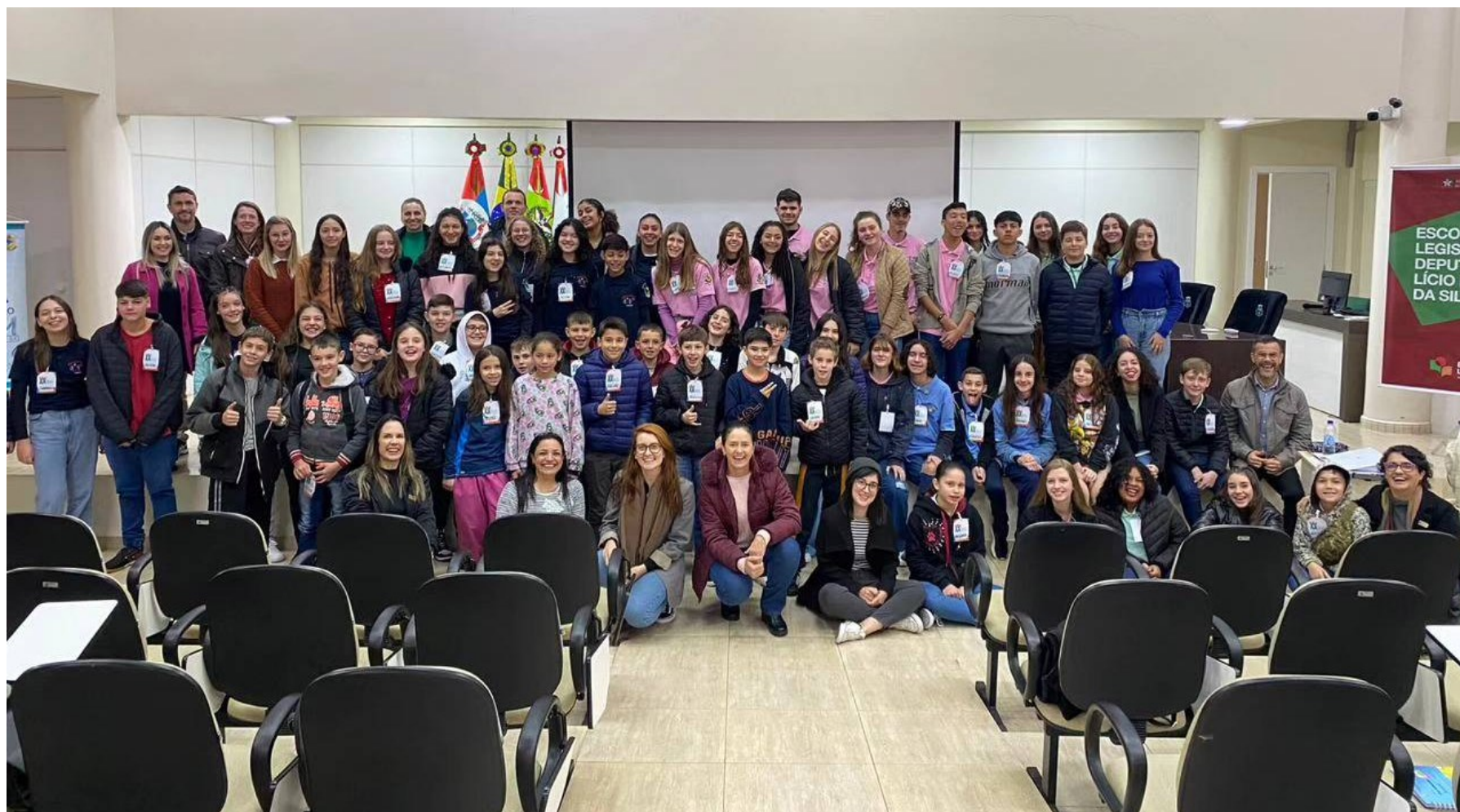
Figura 159: Vereadores e executivos mirins da Acanor quando da Conferência Regional de Vereador Mirim, na Câmara Municipal de Jupiá

Já nas proximidades do encerramento das atividades legislativas de 2024, os vereadores mirins participaram, em 02 de outubro, da Conferência Regional de Vereador Mirim, em Jupiá, sendo uma promoção da Alesc, em parceria com o Legislativo do município anfitrião.