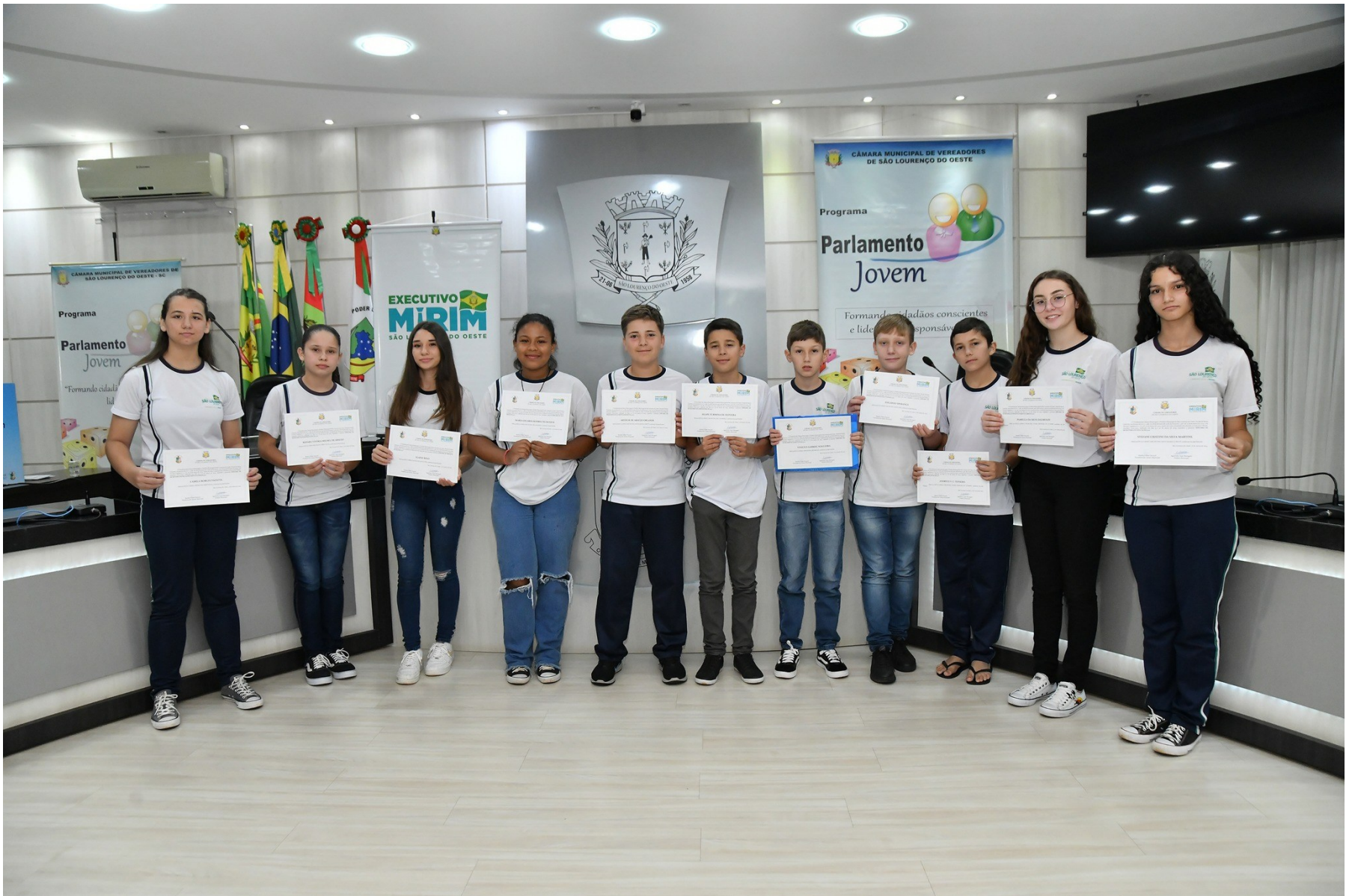
Figura 154: Executivos mirins 2024, diplomados e empossados na Câmara Municipal