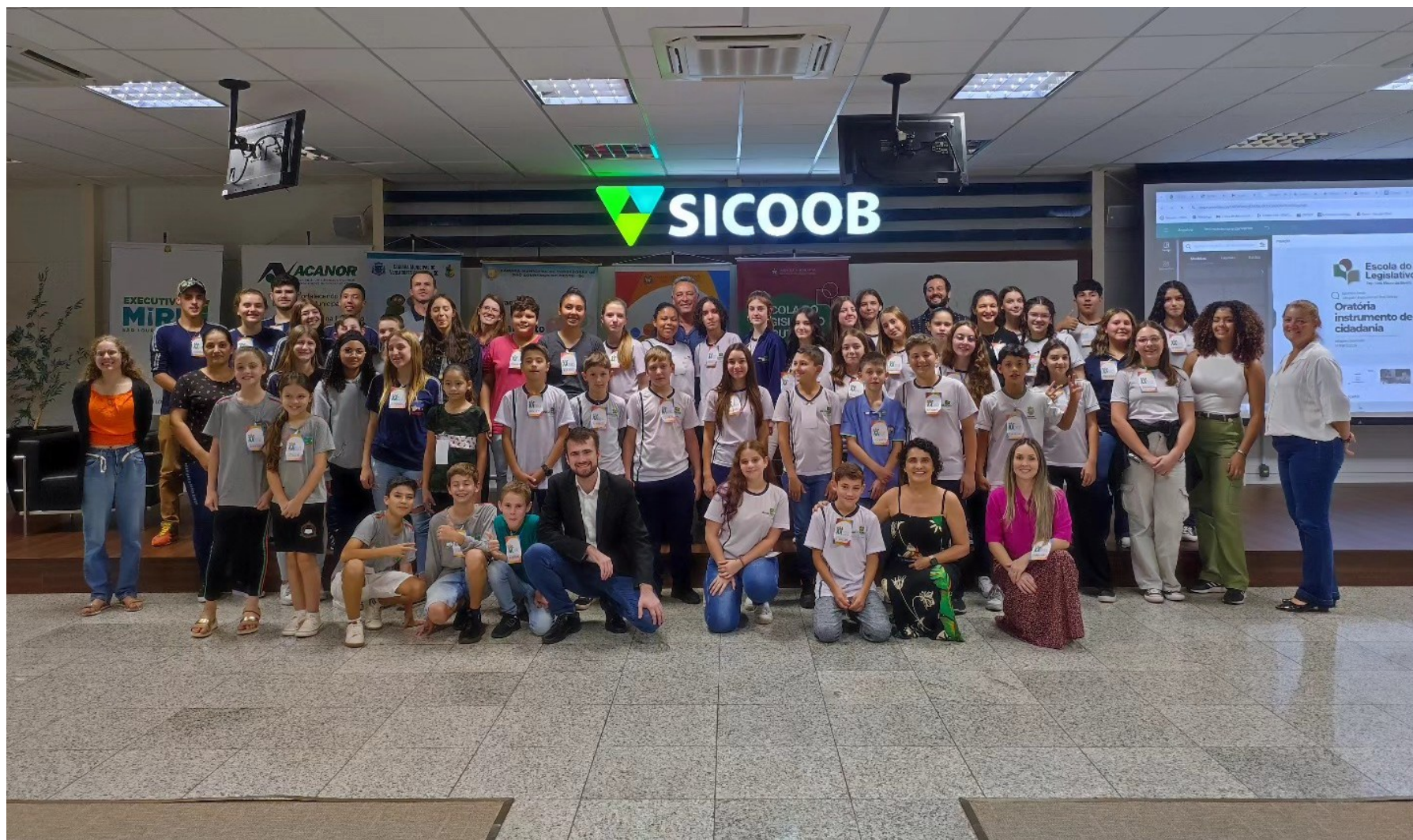
Figura 156: Vereadores e executivos mirins da Acanor na Conferência Regional em São Lourenço do Oeste

Tanto a Câmara quanto o Executivo iniciaram as atividades do ano participando do 6º Encontro Regional Oeste de Câmaras Mirins, realizado em São Lourenço do Oeste, em 02 de abril, promovido pela Escola do Legislativo da Alesc, em parceria com a Acanor. Também participaram os segmentos dos municípios de Jupiá, Galvão e Coronel Martins.