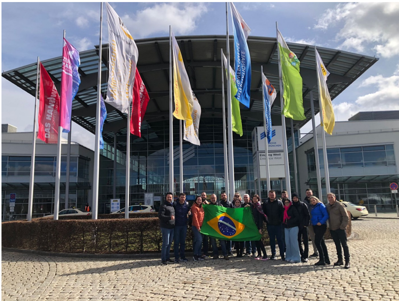
Figura 303: Empresários em missão internacional na Alemanha

Além do intercâmbio, o objetivo da Acislo, responsável por organizar a missão, foi a troca de informações e de experiências, além do conhecimento de realidades e a busca de novidades em seus segmentos.