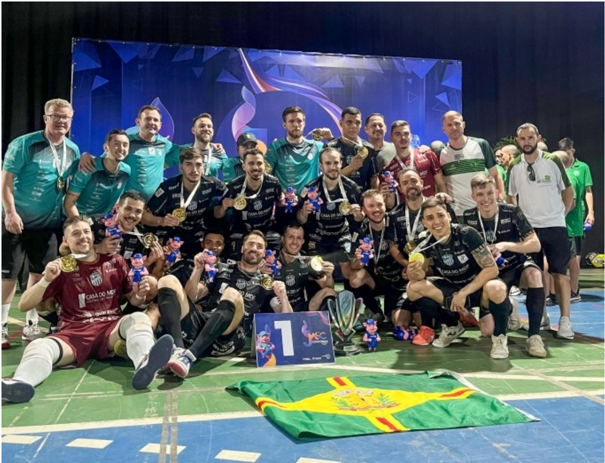
Figura 268: Futsal São Lourenço, campeão dos Jogos Abertos de Santa Catarina

Os Jogos Abertos de Santa Catarina (JASC), organizados pela Fundação Catarinense de Esporte (Fesporte), foram realizados em Concórdia, de 12 a 23 de novembro de 2024, reunindo 31 modalidades, mais de cinco mil competidores e 115 municípios. São Lourenço do Oeste ergueu a taça de campeão com o futsal masculino depois de disputar a final com Tubarão.