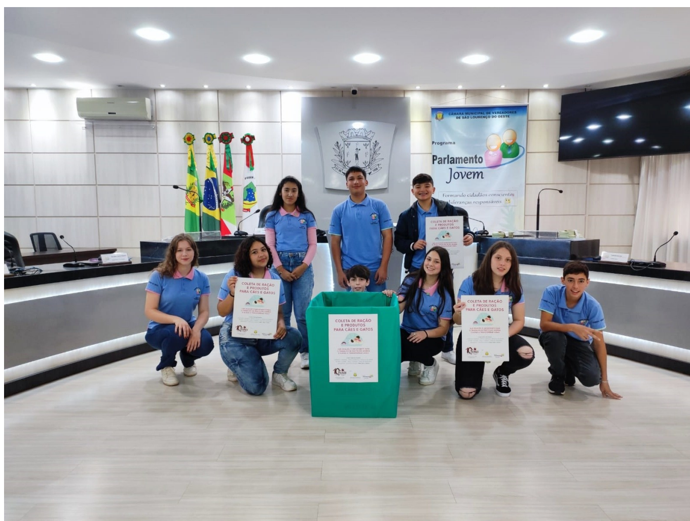
Figura 152: Vereadores mirins apresentando a campanha de arrecadação para a Fênix

A Câmara Mirim finalizou as ações de 2023 com a realização da campanha para a arrecadação de ração e mantimentos a animais, em apoio à Associação Protetora dos Animais (Fênix). Arrecadar doações da comunidade e destiná-las à entidade protetora dos animais constituiu-se na finalidade de campanha. Os pontos de coleta ficaram estabelecidos na Câmara Municipal e nas EBMs. Santa Maria Goretti, Irmã Cecília, Irmã Neusa, São Lourenço, São Roque, Nossa Senhora de Lourdes e Santa Inês. Remédios, ração, tapetes higiênicos, produtos de limpeza, roupas, coleiras, guias, casinhas, caixas de transporte, brinquedos e utensílios em geral para cães e gatos foram os produtos arrecadados com a atividade.