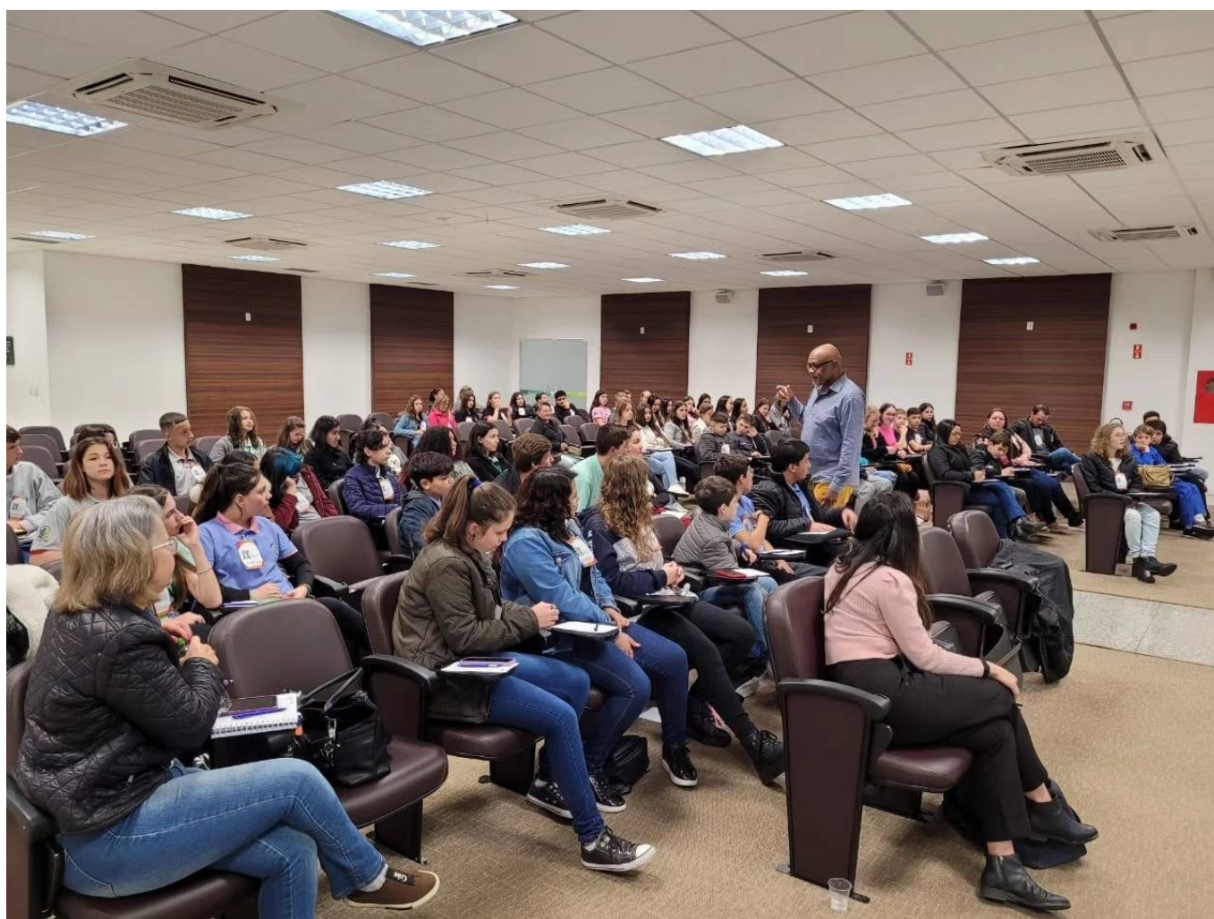
Figura 150: Vereadores mirins da Acanor, durante a Conferência Regional, em São Lourenço do Oeste

São Lourenço do Oeste sediou a Conferência Regional de Vereadores Mirins em 09 de agosto, envolvendo municípios da região. O evento, organizado pela Escola do Legislativo da Alesc e pela Acanor, tratou dos temas: como prevenir a dependência tecnológica; o artigo 5º da Constituição Federal; como consolidar a Câmara Mirim e a Câmara de Vereadores; o vereador mirim e a garantia de direitos para crianças e adolescentes; a Câmara Mirim e a criação de políticas públicas para debater e prevenir a dependência tecnológica; e o vereador mirim e o incentivo para participação na política.