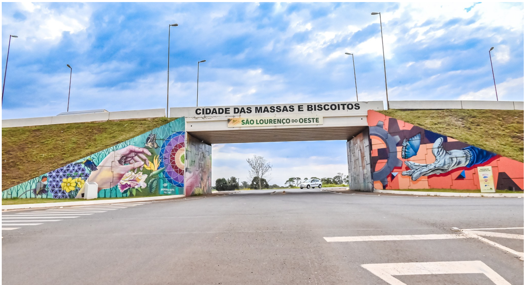
Figura 254: Pintura no elevado que dá acesso à cidade de São Lourenço do Oeste