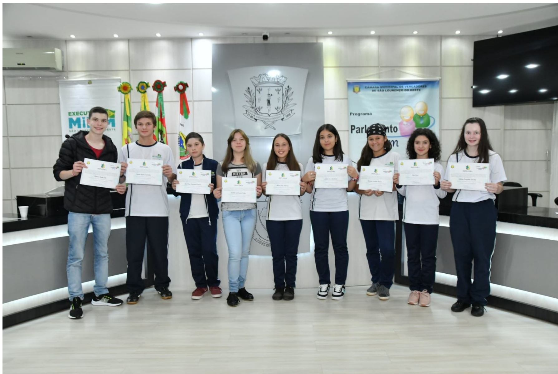
Figura 135: Diplomação e posse dos vereadores mirins 11ª legislatura, em 2022