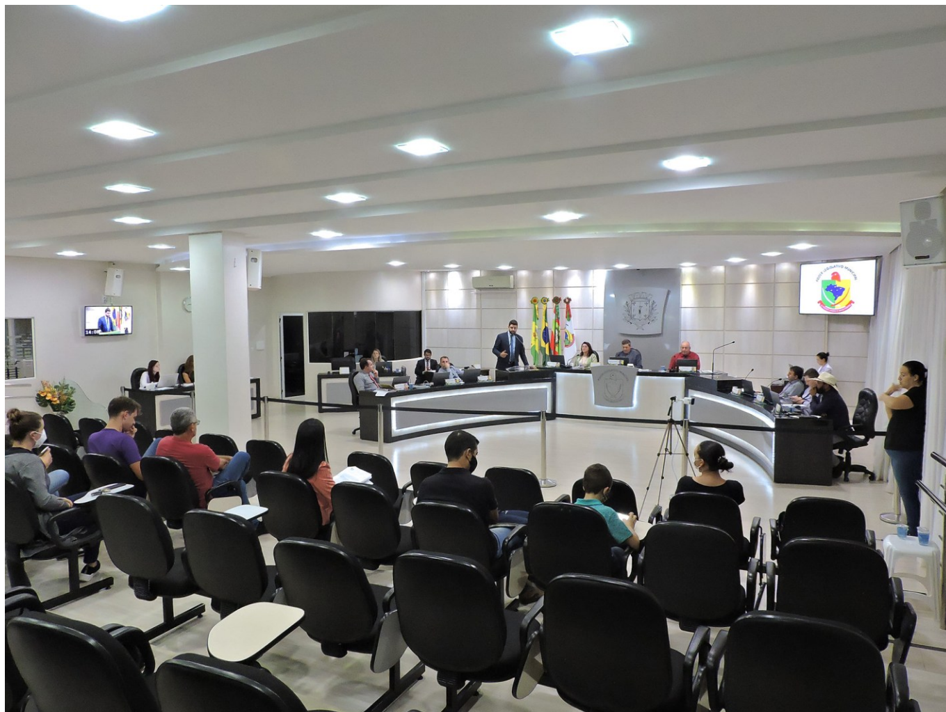
Figura 29: Sessão de discussão e votação do projeto