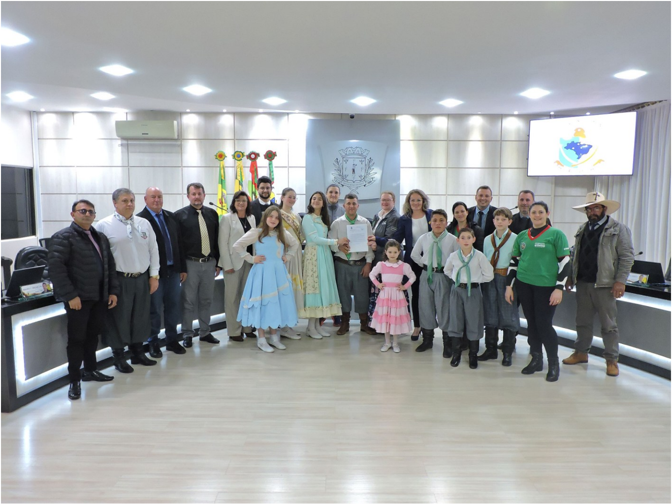
Figura 124: Representantes da invernada mirim do CTG Amizade sem Fronteiras recebendo a Moção de Congratulação

Aprovada na sessão de 19 de setembro de 2022, de autoria dos vereadores Rennã Fedrigo e Ledeni Pieta, a Moção de Congratulação em reconhecimento ao tradicionalismo gaúcho apresentado na 24ª edição do Festival Catarinense de Arte e Tradição (Fecart), realizado em setembro de 2022, em São Lourenço do Oeste, enfatizando, também, o Dia do Gaúcho e o início da Semana Farroupilha. O reconhecimento dos parlamentares é pelo empenho e ótimos resultados das Invernadas Artísticas do CTG Amizade Sem Fronteiras, pois, no Festival, somou 1.490 pontos e ficou campeão geral, assim como a Invernada Artística Mirim que, mais uma vez, conquistou o 1º lugar na categoria Danças Tradicionais Mirins.