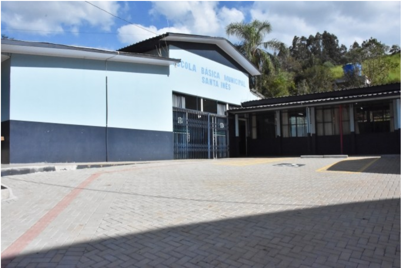
Figura 211: EBM. Santa Inês

A área reformada tem 1.154,94 m 2 e a obra iniciou em janeiro de 2022, executada pela Construtora Pandini. Os investimentos totalizaram R$ 172.395,23, destes, R$ 151,099,00 encaminhados pelo deputado estadual Mauro De Nadal.