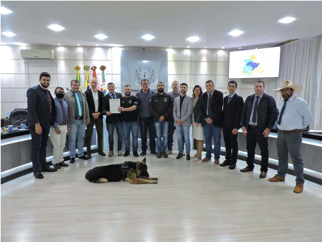
Figura 118: Entrega da Moção de Congratulação a representantes do Núcleo de Operações com Cães da Polícia Civil de São Lourenço do Oeste