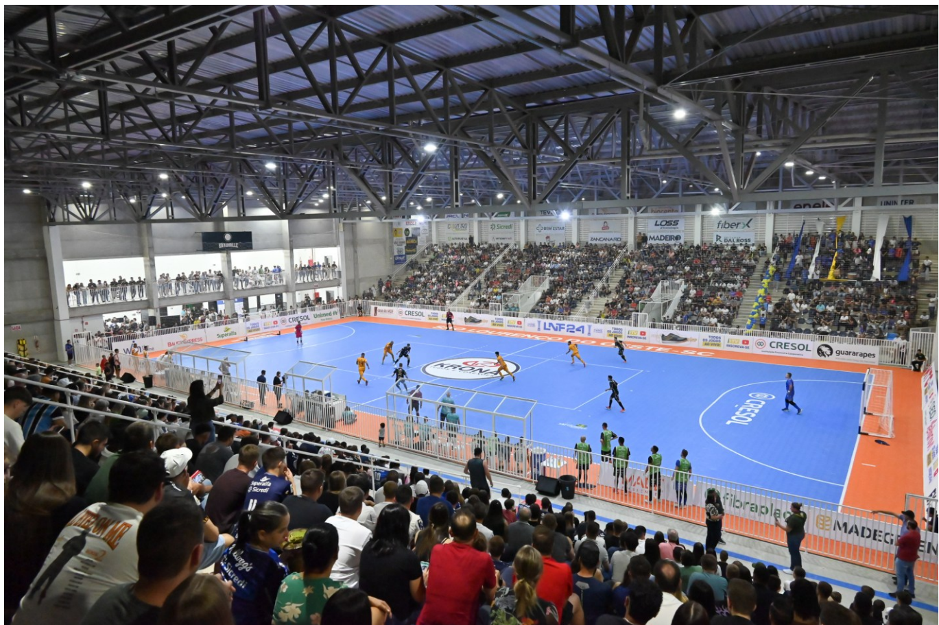
Figura 255: Primeiro jogo oficial na Arena São Lourenço

São 6.335,05 m 2 de construção e capacidade para mais de 1,9 mil lugares. Banheiros, vestiários, bar, cozinha, copa, lavanderia, quadra, camarote, cabine de imprensa, elevador, estacionamento e acesso coberto para o CEIM. Monteiro Lobato fazem parte desta obra ampla, moderna e acessível.