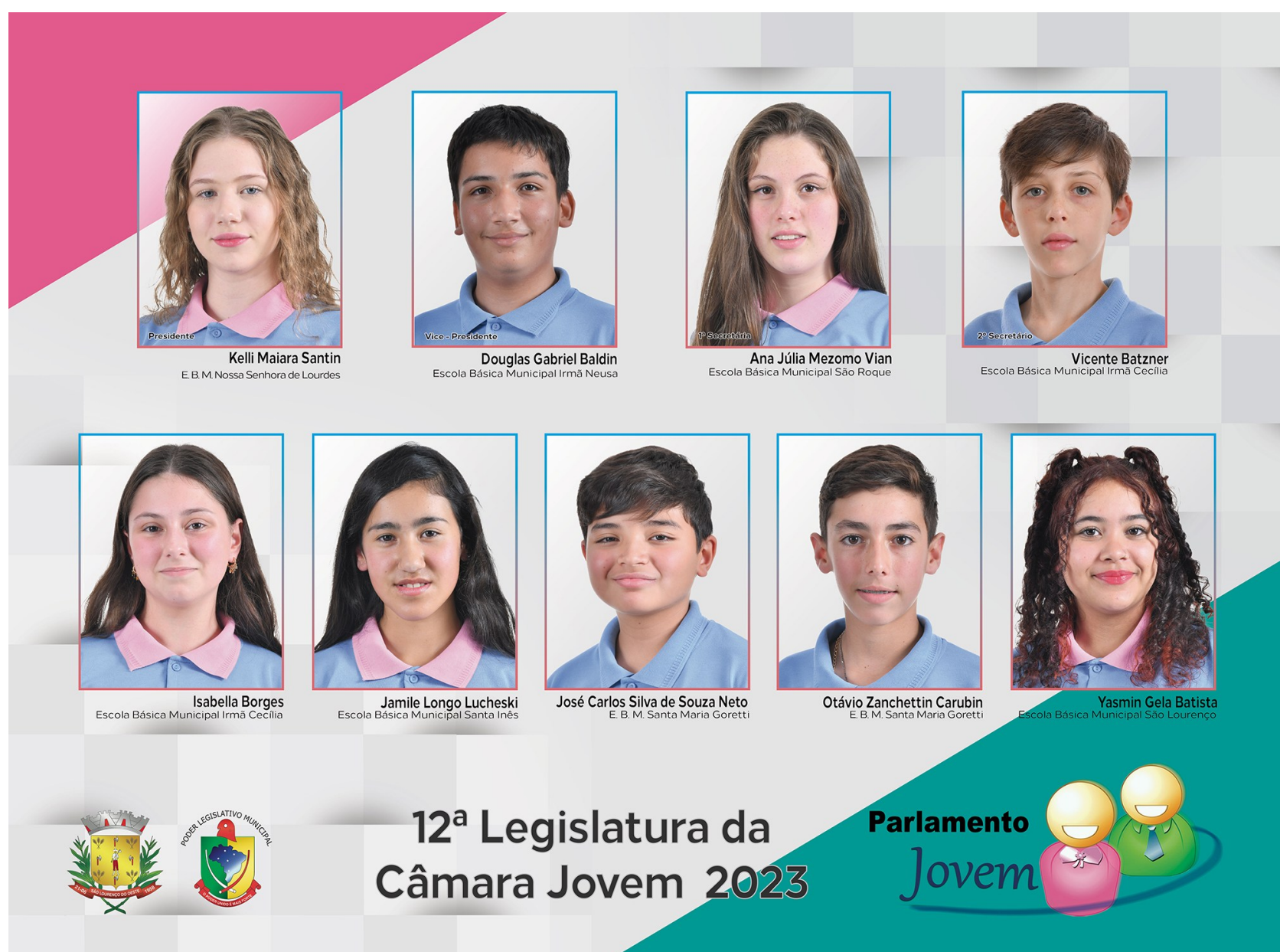
Figura 161: Vereadores mirins 2023