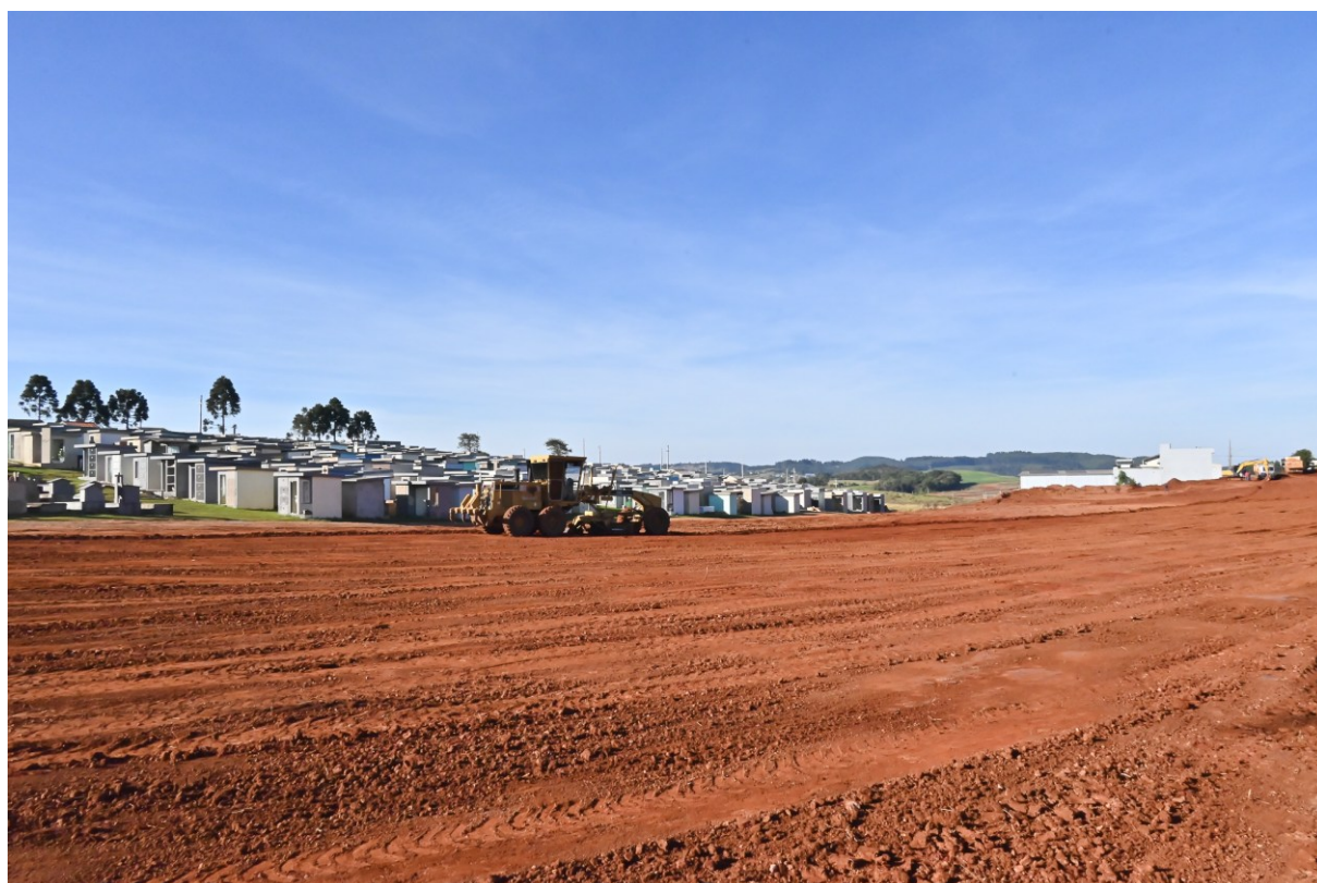
Figura 34: Área de ampliação do Cemitério Jardim da Saudade