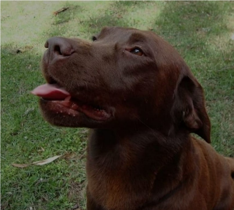
Figura 285: Cão Apolo, da Polícia Civil de São Lourenço do Oeste