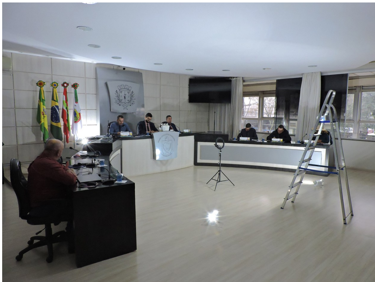
Figura 72: Sessão realizada à luz de refletores

Na ordem do dia, uma das matérias aprovadas foi o projeto de autoria do Governo Municipal, transformado na Lei Complementar n. 332, de 06 de setembro de 2023, que dispõe sobre a regularização de edificações em desconformidade com as Leis Complementares n. 146, de 28 de dezembro de 2012, que instituiu o Plano Diretor Participativo, e a n. 265, de 20 de agosto de 2020, o Código de Edificações.