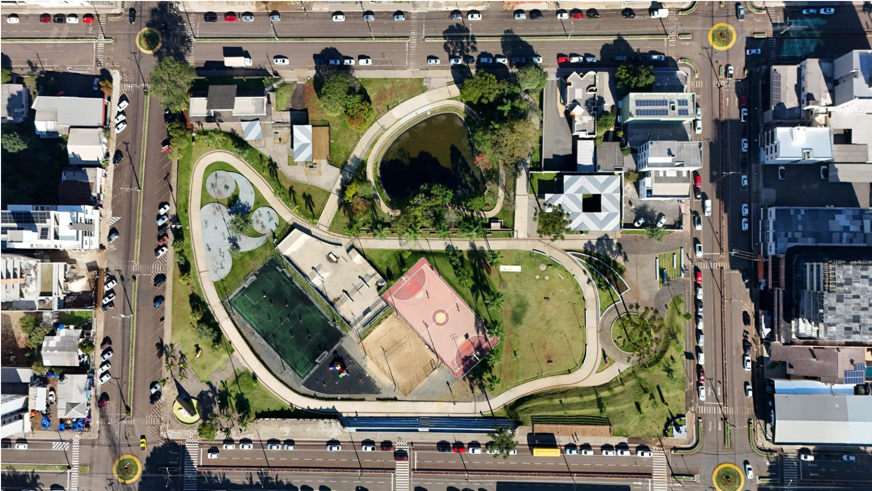
Figura 246: Vista aérea da Praça da Liberdade/maio 2025

Já a ordem de serviço para a 3ª etapa ocorreu em abril de 2023, agora contemplando drenagem, lago, instalações hidráulicas, casa de máquinas, pavimentação do entorno com piso em concreto e paisagismo. Investimentos de R$ 505.951,68, procedentes da deputada federal Caroline De Toni e da prefeitura, garantiram a execução. Pandini Construções e Incorporações Ltda. venceu as licitações para executar a 2ª e a 3ª etapas.