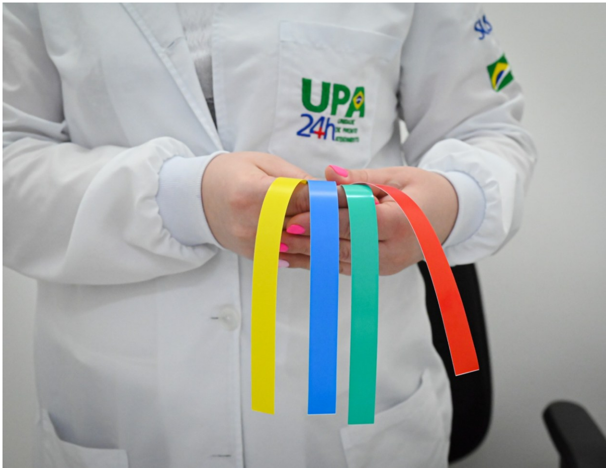
Figura 259: Pulseiras coloridas determinam classificação de risco para atendimento na UPA Dr. Bruno