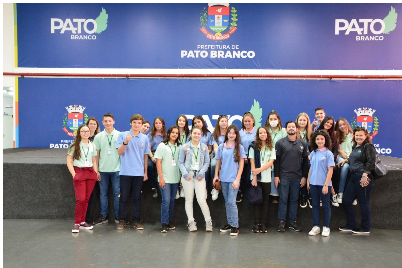
Figura 139: Vereadores e executivos mirins e seus coordenadores em visita a Pato Branco

Em busca de ampliação de conhecimento, os membros da Câmara e do Executivo Mirins realizaram, em 20 de julho, um roteiro de visita a obras e espaços públicos, iniciando em São Lourenço do Oeste e finalizando em Pato Branco. Lá participaram de várias atividades com visitas à Praça Getúlio Vargas, ao Largo da Liberdade e ao Parque do Alvorecer. Também conheceram as oficinas disponíveis no parque e os trabalhos da Secretaria de Esportes, finalizando o passeio no Shopping Pato Branco.