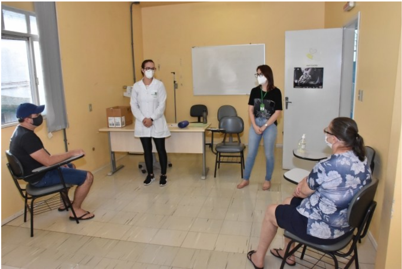
Figura 194: Fisioterapeuta, psicóloga e pacientes em reabilitação pós-covid-19

Em São Lourenço do Oeste, a Secretaria de Saúde realizou trabalho em grupo para pessoas que passaram pela doença e ficaram com alguma sequela. Coordenado por fisioterapeuta e psicóloga, o grupo reunia-se uma vez na semana, seguindo todos os protocolos de segurança. No grupo com a psicóloga, os pacientes enfatizavam a ansiedade e os traumas, e, com a fisioterapeuta, o atendimento acontecia individualmente.