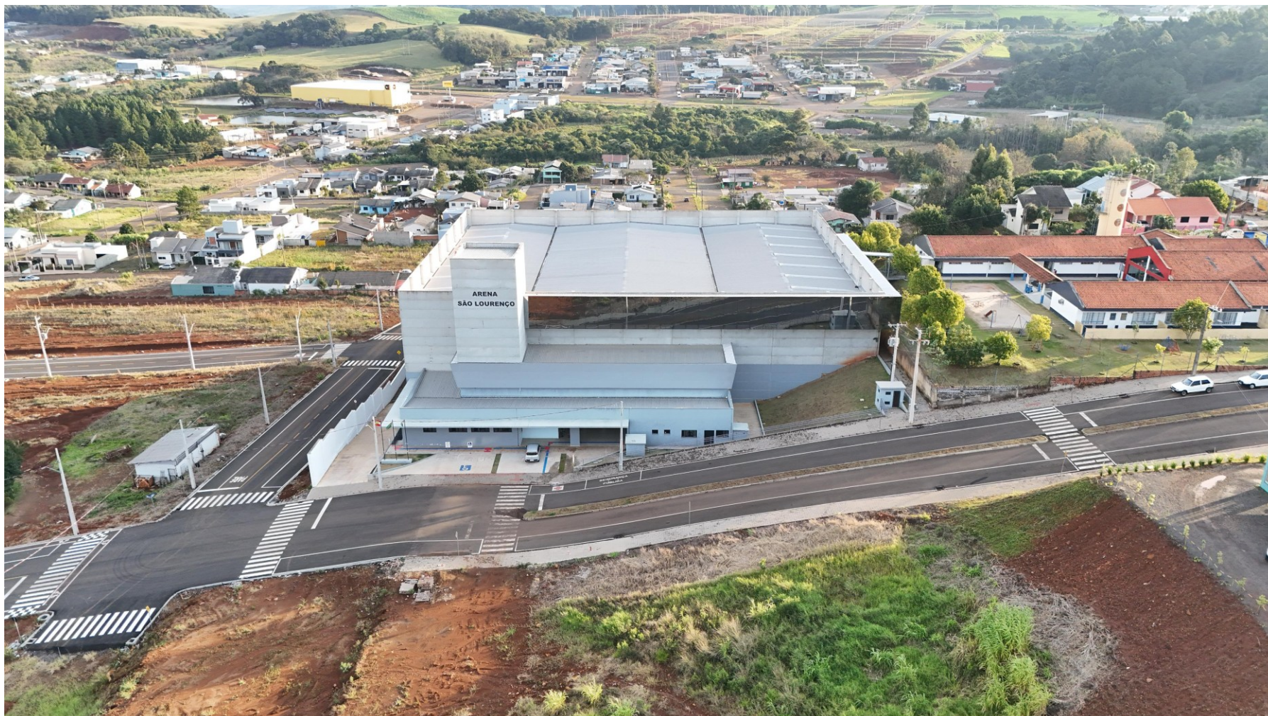
Figura 256: Vista aérea da Arena São Lourenço, junho/2025