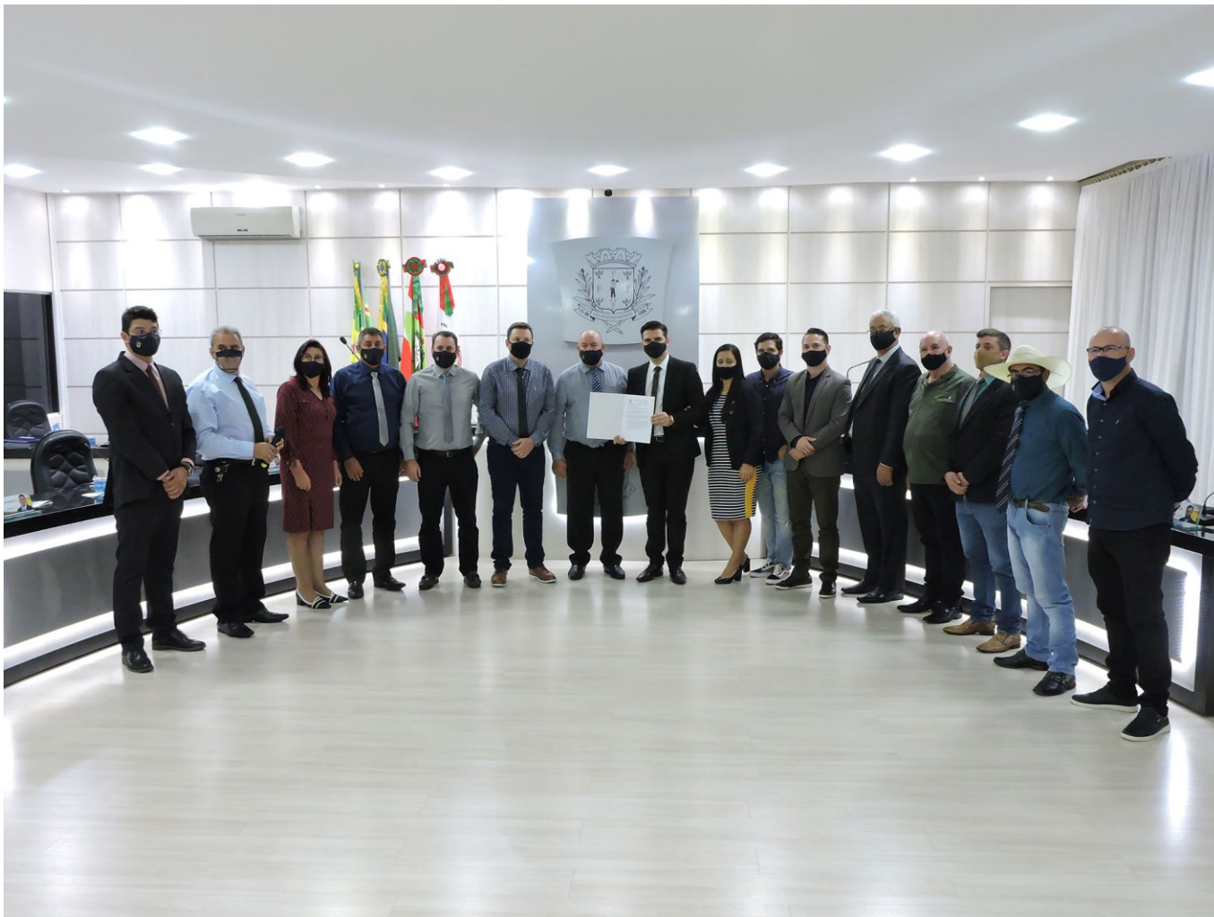
Figura 108: Entrega da Moção de Congratulação a representantes da Igreja Assembleia de Deus em Santa Catarina