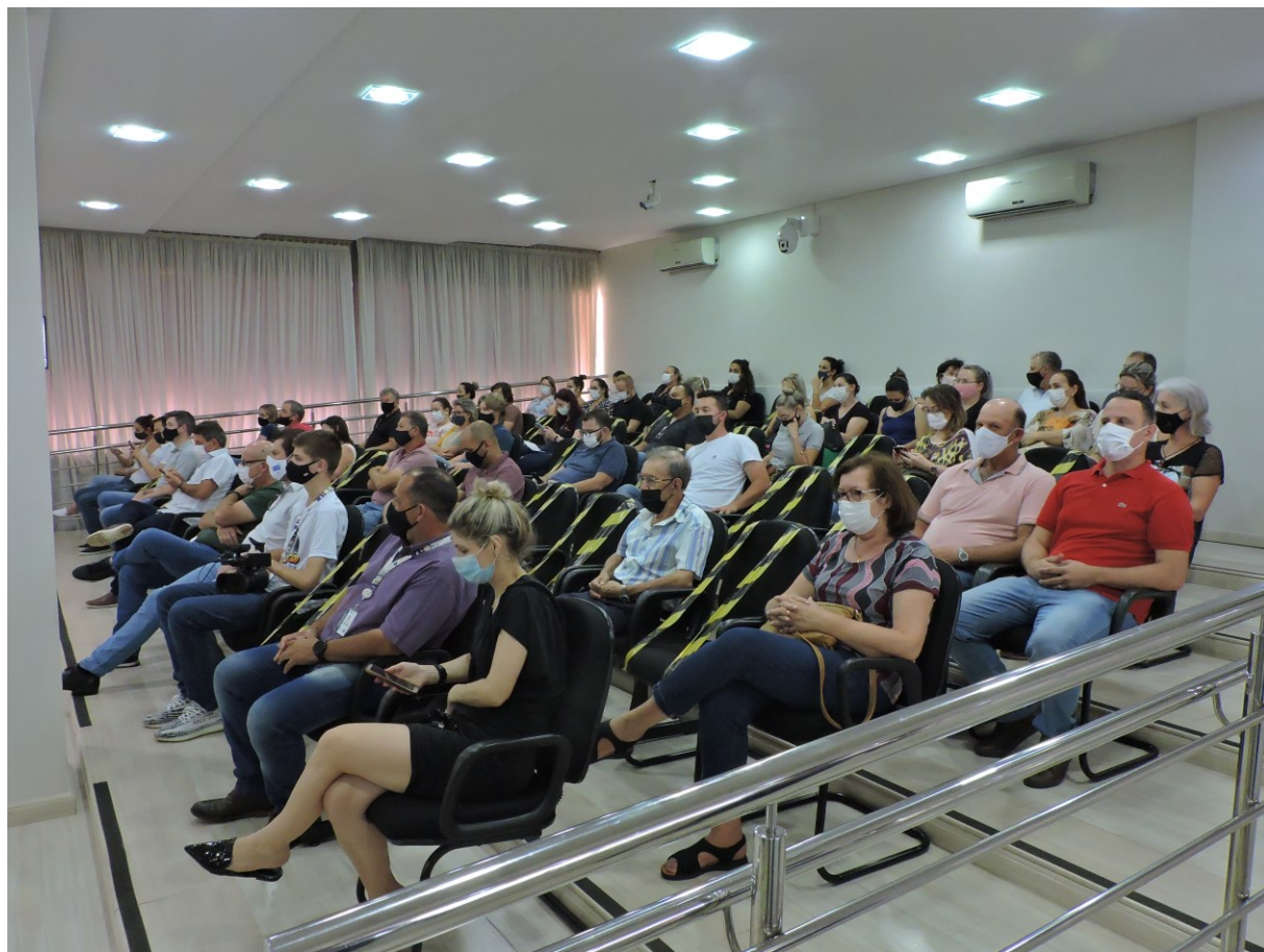
Figura 24: Comunidade e imprensa acompanhando a discussão e a votação do projeto da reforma administrativa

Em 16 de dezembro de 2021, o Legislativo aprovou, com urgência especial, o projeto da reforma administrativa. Definiu, também, as atribuições correspondentes aos cargos de provimento comissionado do Executivo. O requerimento de urgência foi emitido pela Mesa Diretora. Aprovado, o projeto transformou-se na Lei Complementar n. 283, de 20 de dezembro de 2021.