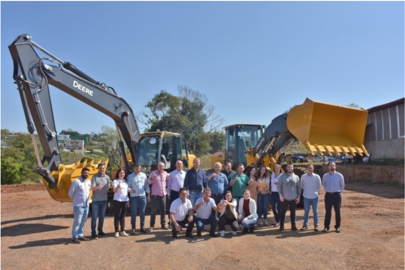
Figura 217: Representantes dos municípios de São Lourenço do Oeste, Coronel Martins, Galvão, Jupiá, Irati, Novo Horizonte, Quilombo e São Bernardino recebendo o kit de máquinas

As máquinas foram entregues na garagem da prefeitura de São Lourenço do Oeste, que faz parte do Consórcio, juntamente com Coronel Martins, Galvão, Jupiá, Irati, Novo Horizonte, Quilombo e São Bernardino. Compõem o kit: caçamba, escavadeira, caminhão, conjunto de britagem e rebritagem, pá-carregadeira, rompedor hidráulico e óleo diesel. Entre equipamentos, materiais permanentes e de consumo, os investimentos ultrapassaram R$ 7,8 milhões, advindos do Governo de Santa Catarina.