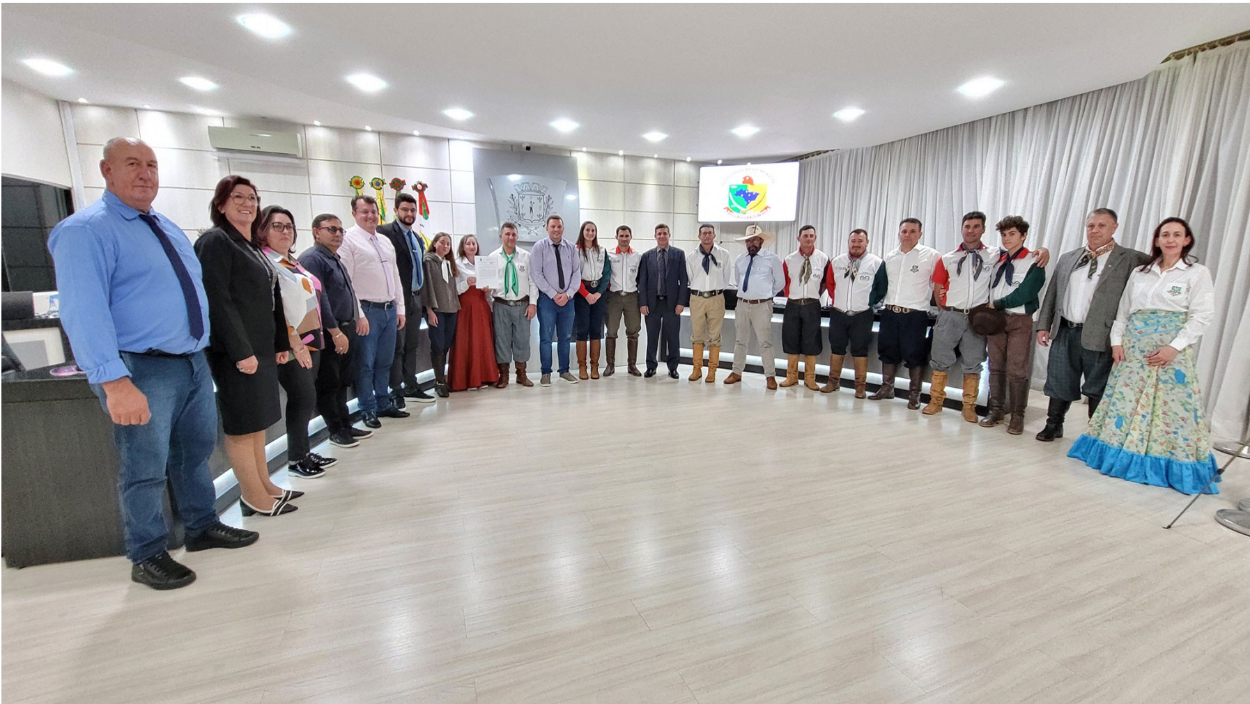
Figura 116: Entrega da Moção de Congratulação a membros da internada artística do CTG Amizade sem Fronteiras

Moção de Congratulação, de autoria do vereador Rennã Fedrigo, aprovada na sessão de 09 de maio de 2022, foi direcionada ao CTG Amizade Sem Fronteiras, pela realização do 32º Rodeio Crioulo, que aconteceu de 29 de abril a 01 de maio, em São Lourenço do Oeste. Diversas manifestações da cultura gaúcha foram disputadas, como a 2ª Copa Amizade, o troféu cidade, a vaca parada, gineteada, os laços em dupla, individual, em equipe e patrão, entre outras. O evento contou com a participação de mais de quinhentos laçadores, contabilizando mais de mil pessoas acampadas no parque do rodeio.