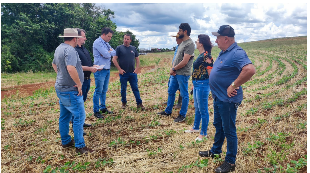
Figura 48: Vereadores em visita à área do Loteamento Jardim Itália, Bairro São Francisco