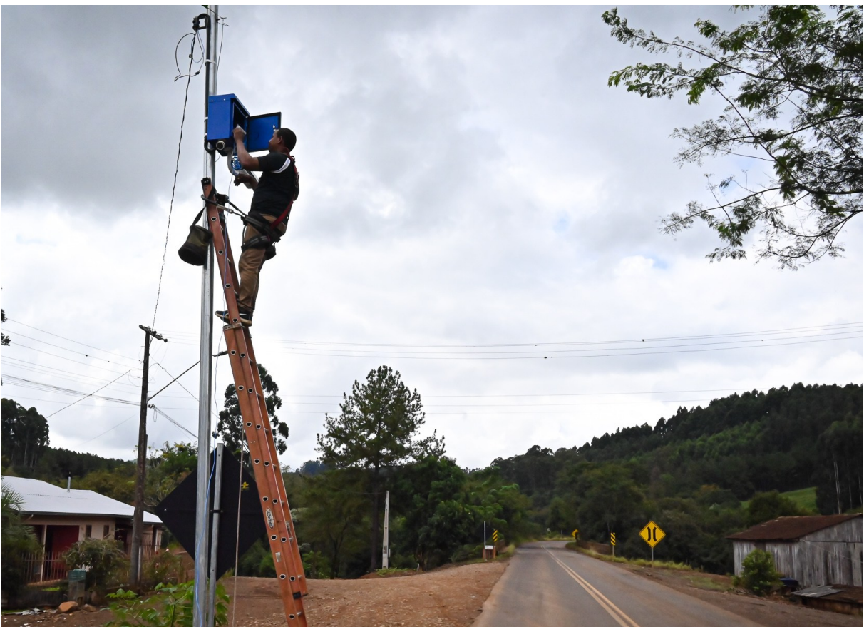
Figura 262: Instalação de câmeras de monitoramento

Armazenamento de imagens para monitoramento, identificação e investigação são as principais funções do cercamento eletrônico. O programa foi executado com recursos próprios da prefeitura e é fiscalizado pelo Departamento de Tecnologia e Gestão da Informação. Somente as Polícias Militar, Rodoviária e Civil têm acesso às imagens.