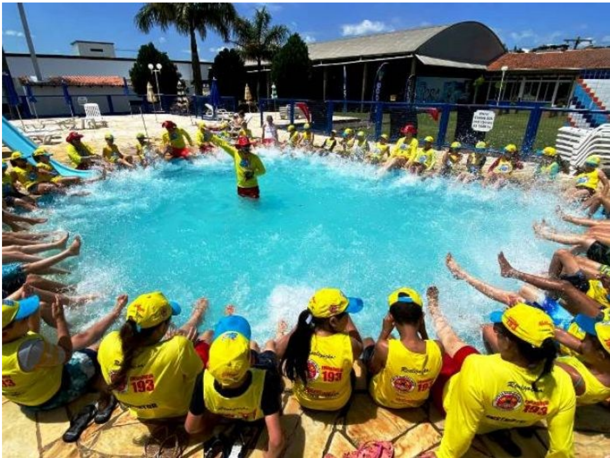
Figura 302: Execução do Projeto Golfinho

Constaram da formação atividades de ordem e disciplina, orientações para a necessidade do uso de protetor solar, hidratação e cuidados com a exposição ao sol. Mas também teve muita brincadeira, como futebol na lona de sabão, boliche humano e balde com água.