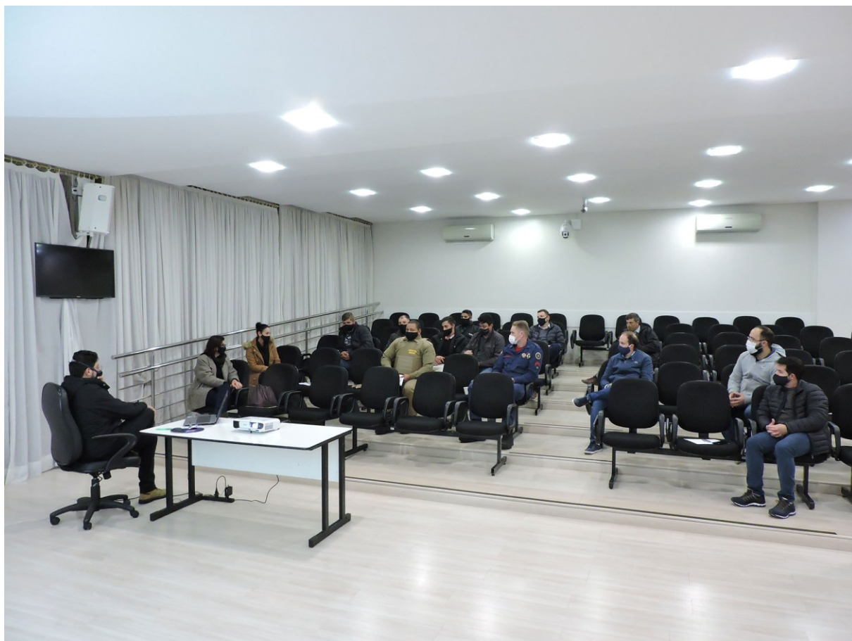
Figura 16: Membros da Comissão de Legislação, Justiça e Redação reunidos na Câmara Municipal com representantes de órgãos da segurança pública, da prefeitura e dos mototaxistas e entregadores