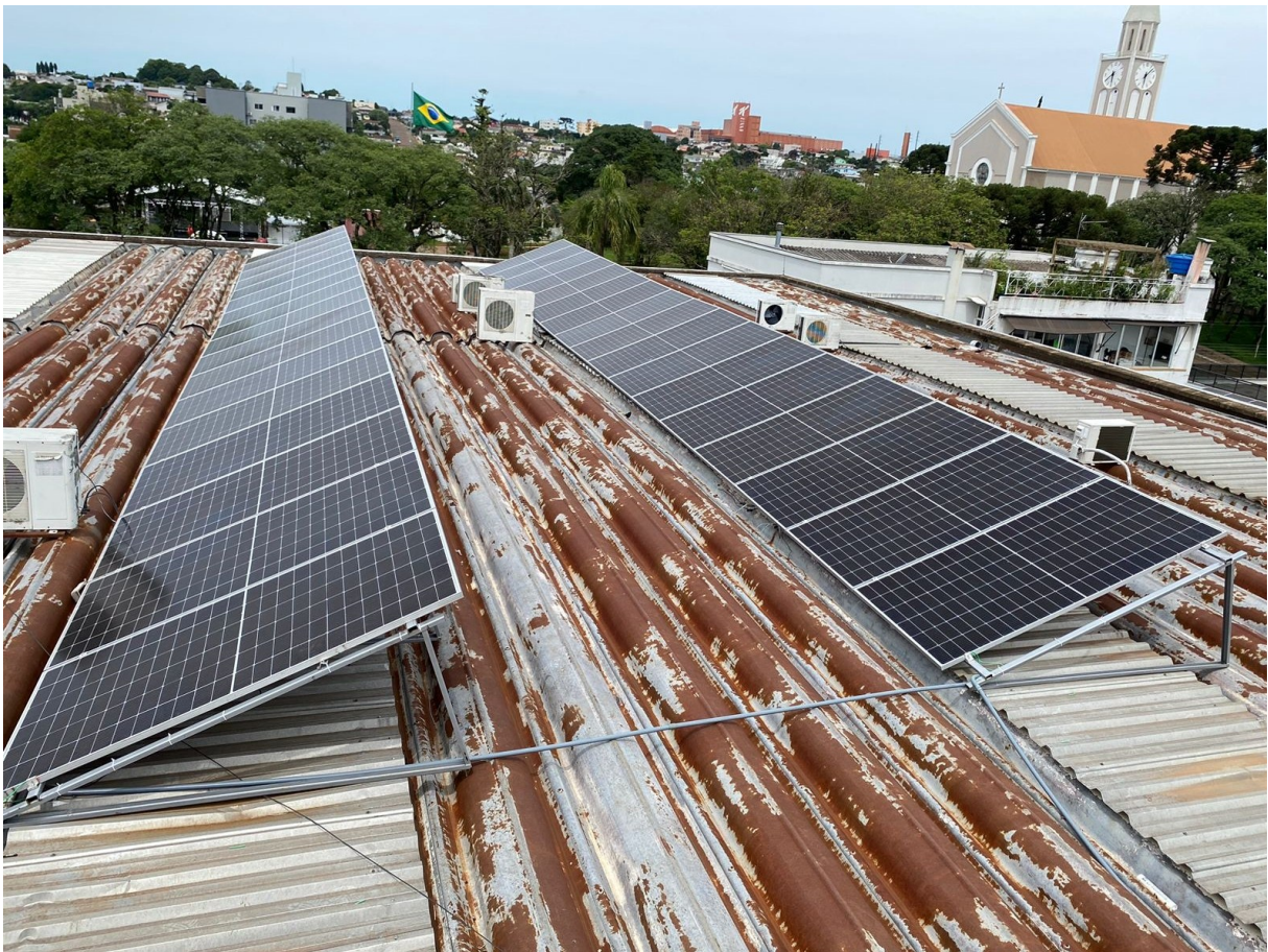
Figura 78: Sistema de energia solar fotovoltaica implantado na Câmara Municipal

Até então, a fatura da Câmara com o uso de energia elétrica convencional estava na casa dos R$ 1.200,00 mensais. Com o novo sistema, o investimento total da implantação deve ser pago aproximadamente em cinco anos em decorrência da economia na fatura. A garantia do fabricante é de 10 anos, mas todo o material tem vida útil aproximada de 25 anos.