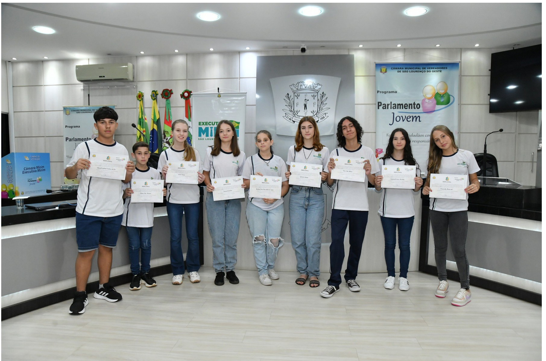
Figura 155: Diplomação e posse dos vereadores mirins, 13ª legislatura, em 2024