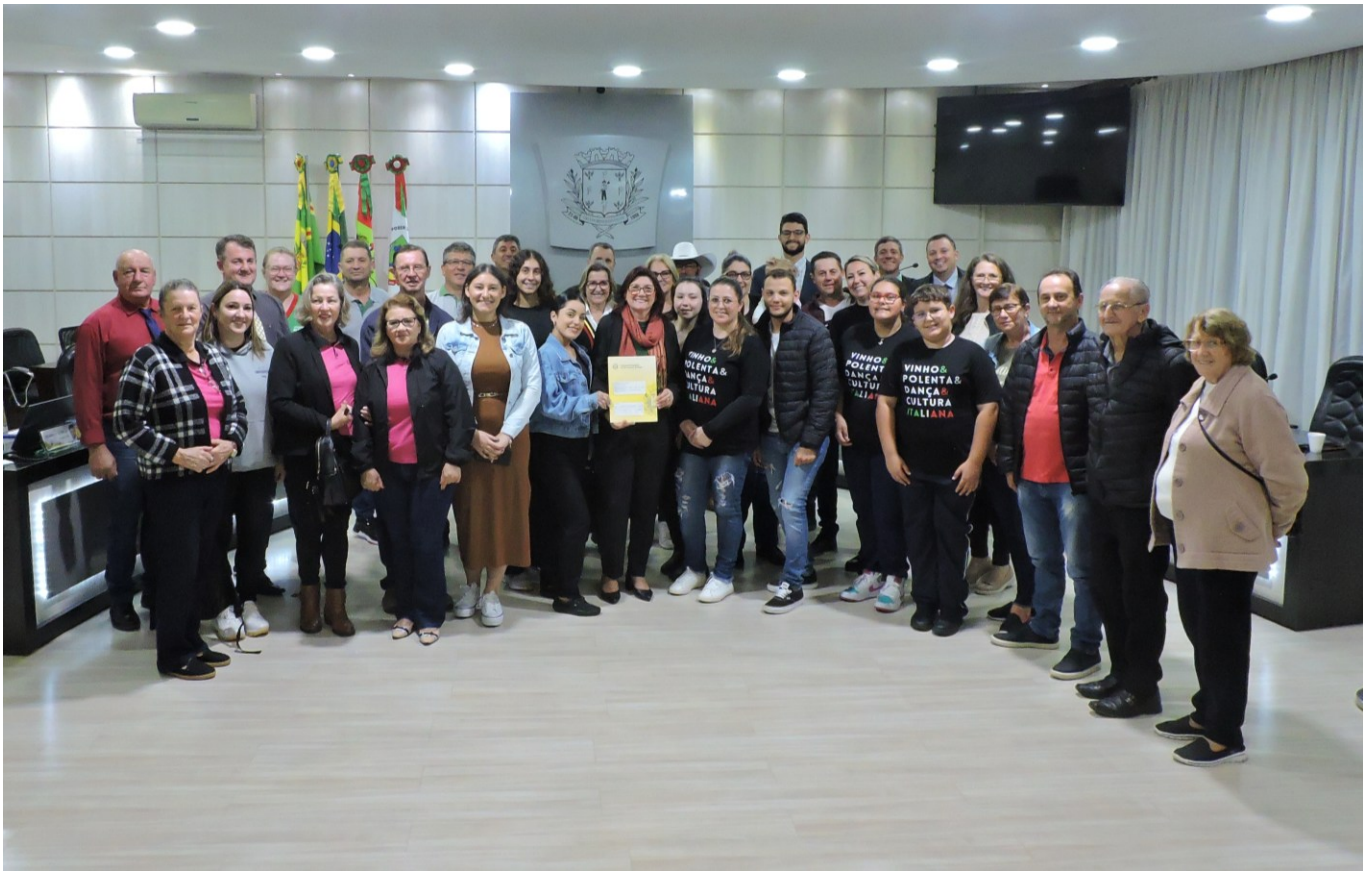
Figura 84: Vereadores e representantes das entidades: Coral Entre Amigos, Associação Germânica Coral Deutsche Stimmen, Grupo Folclórico Alemão Heiliger Joseph, Grupo Folklorístico San Gaitano, CTG Amizade sem Fronteiras e Associação dos Moradores de Lageado Antunes

Na justificativa consta que o Grupo Folklorístico San Gaitano e o CTG Amizade sem Fronteiras foram contemplados com dois valores, sendo o primeiro com a finalidade de custear a aquisição de trajes típicos italianos, a contratação de banda musical e a decoração para a XVIII Festa Italiana, que faz parte da programação da semana do município. Já o segundo, para custear a contratação de instrutor de danças das invernadas artísticas e a realização do 9º Acampamento Farroupilha, especialmente pagamento do show, iluminação e sonorização do evento de abertura, além da programação diversificada, incluindo apresentações musicais, dança e outras expressões da cultura gaúcha.