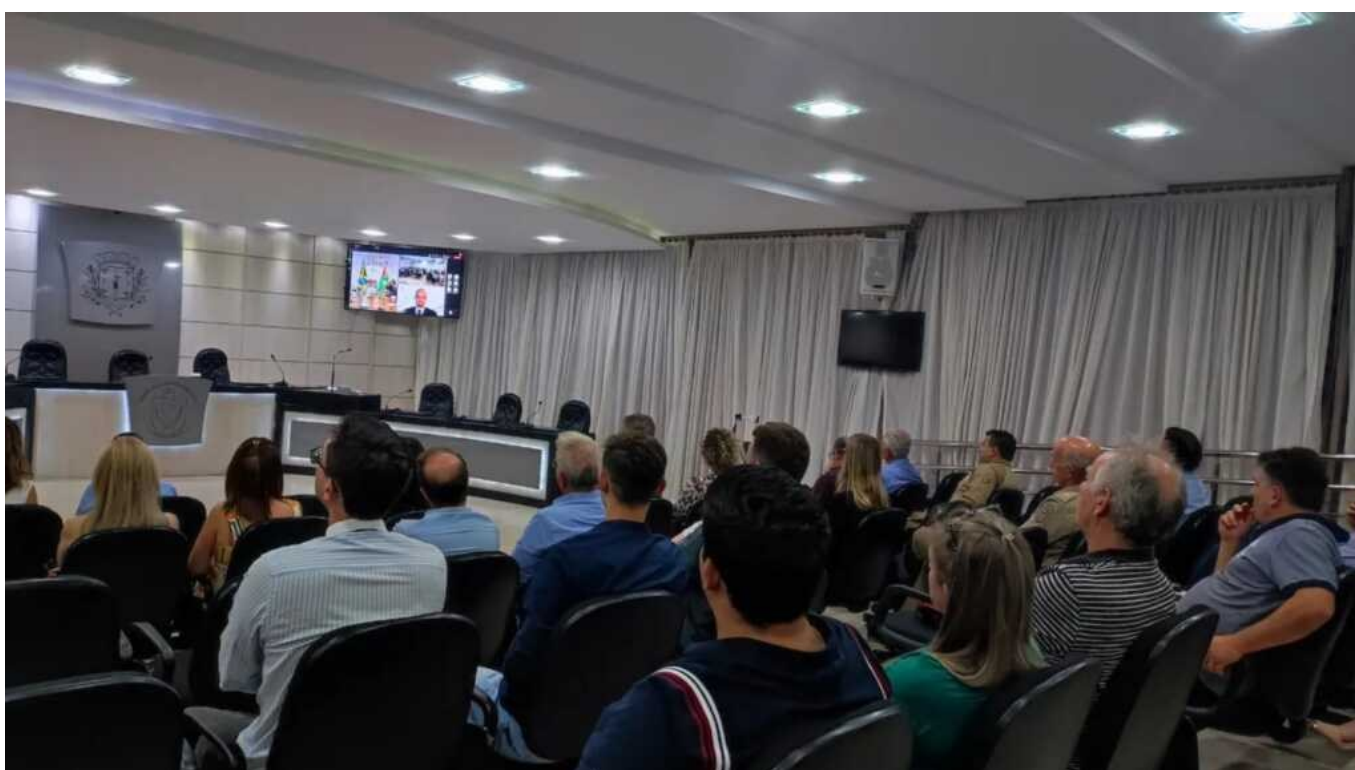
Figura 45: Evento de assinatura da Ordem de Serviço para a construção do novo Fórum da Comarca de São Lourenço do Oeste

Com a assinatura da ordem de serviço, à empresa responsável foi estabelecido o prazo de 780 dias para a conclusão da obra, ou seja, março de 2025. O novo Fórum da Comarca ficará no cruzamento das Ruas Aldo Lemos e Gilio Rezzieri, Bairro Perpétuo Socorro. O custo total será de R$ 17.217.900,00 e, em espaço amplo, comportará duas varas, OAB, Defensoria Pública, cela para presos, tribunal do júri, entre outros. Atualmente, os júris acontecem na Câmara Municipal.