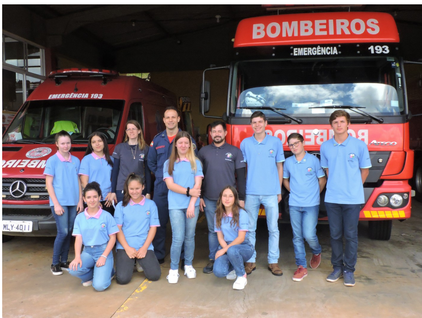
Figura 144: Vereadores mirins em visita ao quartel do Corpo de Bombeiros Militar de São Lourenço do Oeste

Finalizando as atividades de 2022, os vereadores mirins e a coordenação do Programa Parlamento Jovem participaram, em 23 e 24 de novembro, de atividades em complemento às ações de formação com roteiro cultural e institucional em Florianópolis, e de capacitação com profissionais da Alesc e da Câmara de Vereadores da Capital.