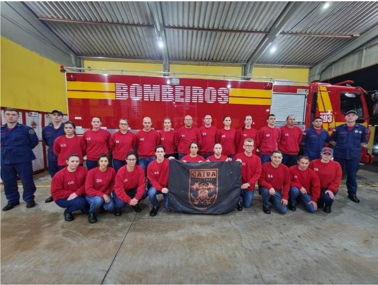
Figura 297: Conclusão da formação dos bombeiros comunitários

Em agosto de 2022 iniciou o curso de formação para bombeiros comunitários de São Lourenço do Oeste. Após várias etapas, em processo seletivo com provas práticas e teóricas e teste de aptidão física, 27 alunos passaram para 154 horas de estudo, além de estágio operacional. Com dois encontros semanais, entre outras temáticas, os estudantes receberam formação voltada às noções de combate e extinção de incêndios, de busca e salvamento e conduta militar e ao atendimento pré-hospitalar. Após formados, os indivíduos poderiam compor a guarnição de serviço operacional do Corpo de Bombeiros, além de possuírem o currículo fundamental e se tornarem brigadistas nos variados segmentos empresariais.