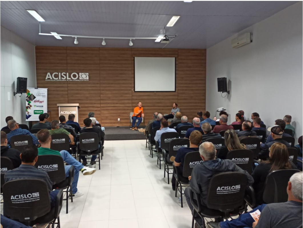
Figura 298: Odair Tramontin em conversa com empresários na Acislo

Em 17 de setembro de 2022, a Acislo recebeu Odair Tramontin, candidato ao governo de Santa Catarina pelo partido Novo. Na oportunidade, a Associação, que representa em torno de 700 empresas dos setores da indústria, do comércio e da prestação de serviços, expôs as principais demandas da classe empresarial, com destaque a rodovias, ferrovias, privatizações, saneamento básico e escolha do secretariado. Também houve questionamentos do público e compartilhamento das propostas de governabilidade por parte do candidato. Ainda, a Acislo reforçou que integra o movimento capitaneado pela Facisc que, nos últimos pleitos, editou a Cartilha Voz Única, um projeto que busca unificar a classe empresarial para levantar as necessidades e os entraves que dificultam o desenvolvimento econômico do Estado. Na sequência, o documento é apresentado e discutido com os políticos municipais, estaduais e federais.