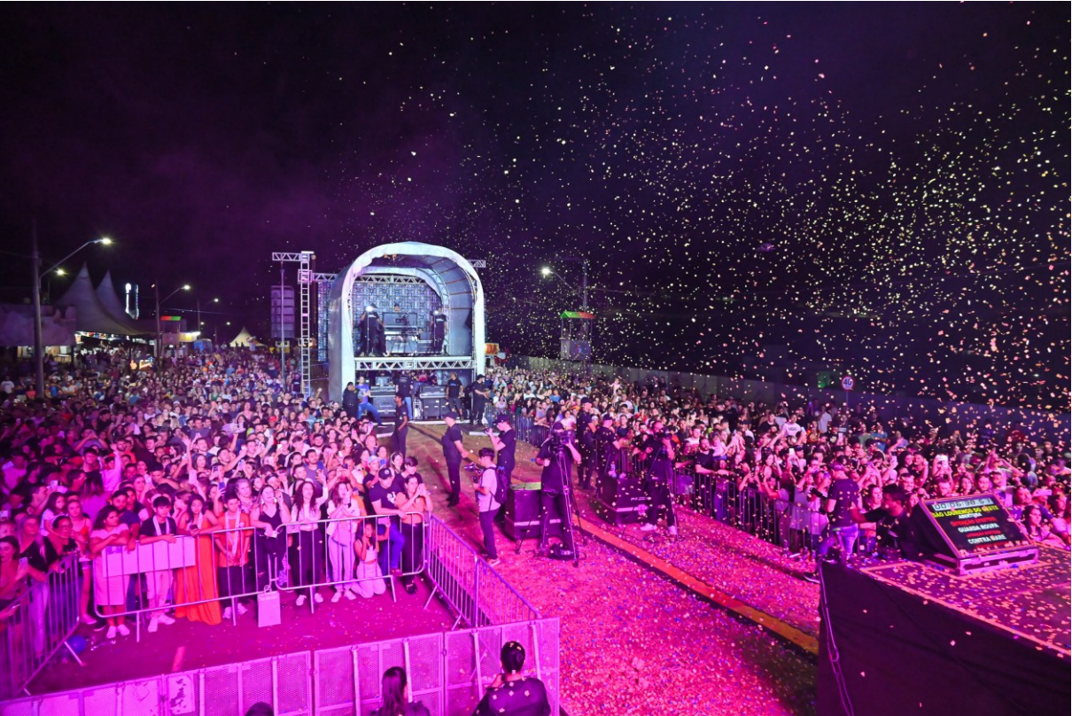
Figura 249: 7ª Efaislo/2023, no Centro de Eventos Governador Luis Henrique da Silveira

Foram mais de 110 expositores nos segmentos da indústria, do comércio e da prestação de serviço. Teve, ainda, palestras, parque de diversões, voos de helicóptero, carro campeão da Stock Car 2023, carreta agro do Banco do Brasil, ampla praça de alimentação e shows nacionais de Fred e Fabrício, Rio Negro e Solimões, Matheus e Kauan e Nenhum de Nós. Esta edição superou todas as expectativas, tanto de negócios quanto de público.