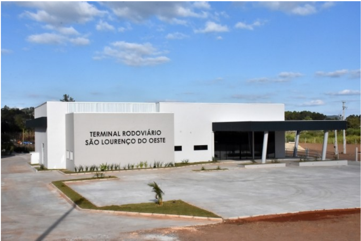
Figura 197: Novo terminal rodoviário de São Lourenço do Oeste

Vale lembrar que a concessão do terminal ocorreu por processo licitatório e o contrato foi assinado em julho de 2018, tendo como empresa vencedora do certame a VG-MAX Participações Ltda., responsável pela edificação e administração do espaço.