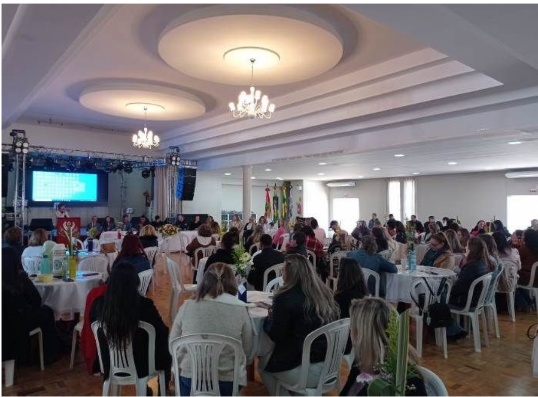
Figura 299: Encontro regional das APAEs em São Lourenço do Oeste

Depois da pandemia de covid-19, o primeiro encontro regional das Apaes ocorreu em São Lourenço do Oeste, no CRA, em 23 de setembro de 2022. No evento, pedagogos e equipes multidisciplinares de dez Apaes da região trataram do transtorno do espectro autista. Um momento de estudo, organização e aprofundamento voltado à vida da pessoa com deficiência.