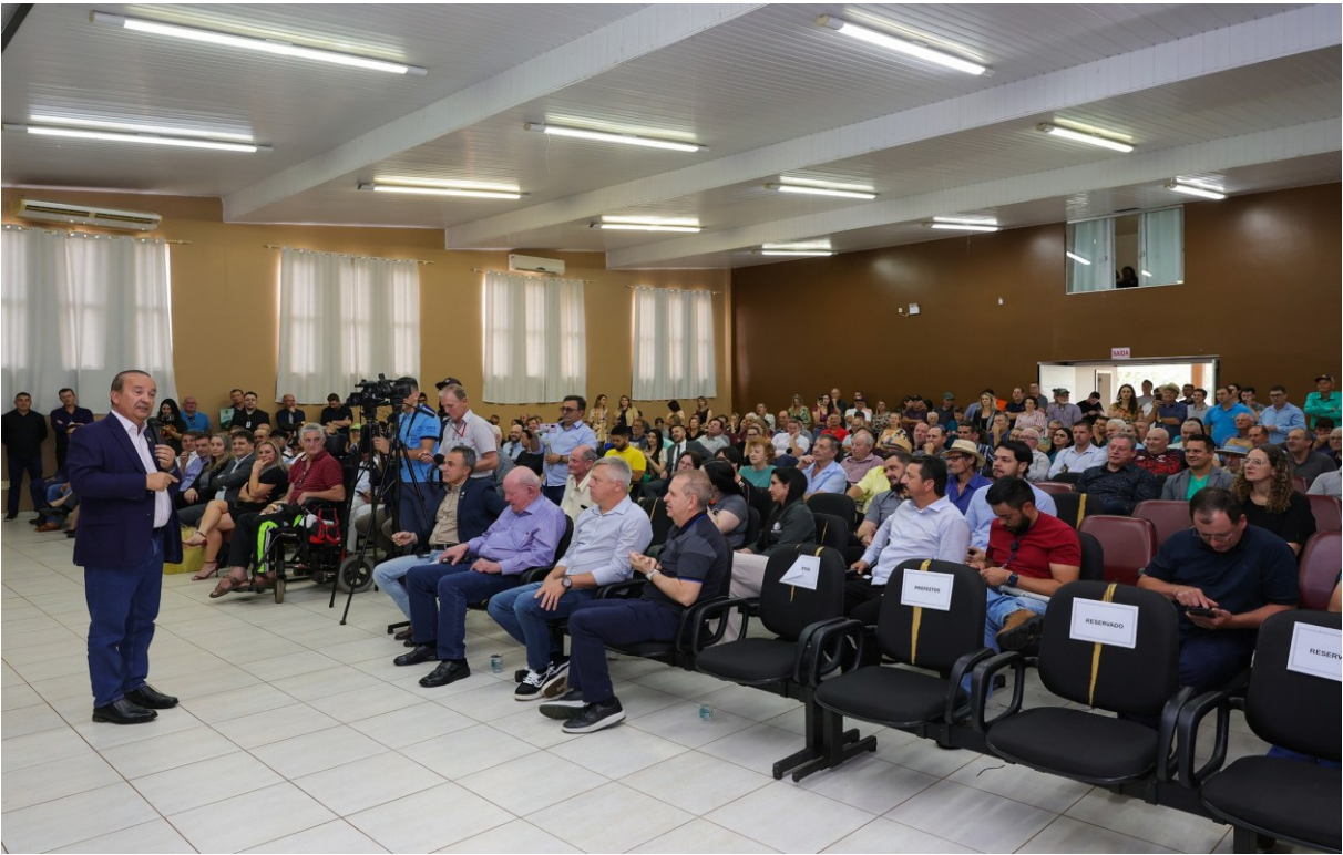
Figura 313: Jorginho Mello, governador de Santa Catarina, no evento de assinatura da ordem de serviço para a restauração da rodovia SC-305

Notório está que o investimento na rodovia é uma questão estratégica do ponto de vista logístico, mas também atende a solicitação da comunidade e de usuários por condições de trafegabilidade e de segurança. Com a ordem de serviço assinada, restou a expectativa pelo início da restauração.