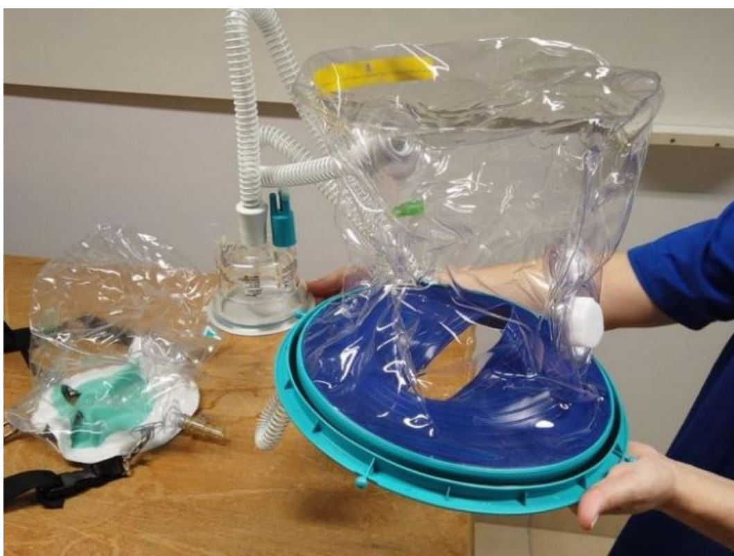
Figura 287: Exemplar de capacete Elmo, utilizado pela Fundação Hospitalar São Lourenço

Feito com silicone e PVC, o capacete Elmo foi desenvolvido para oferecer oxigênio em alto fluxo para o paciente internado. Ele envolve toda a cabeça e é fixado no pescoço do paciente em uma base que veda a passagem de ar. Com a aplicação de oxigênio e de ar comprimido, o Elmo gera uma pressão positiva (em relação à pressão atmosférica) que ajuda pacientes com dificuldade de oxigenação. É indicado para o tratamento de pacientes com quadro clínico leve ou moderado, mas também pode auxiliar nos casos que começam a evoluir para a gravidade, de modo a evitar a intubação. Ainda, o capacete possibilita que o gás carbônico não seja expelido ao ambiente. Sem contaminação, o aparelho também garante maior segurança aos profissionais de saúde.