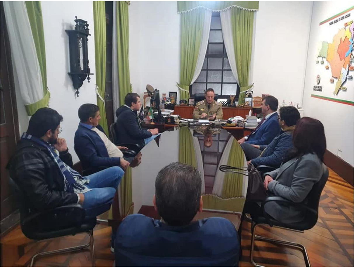
Figura 36: Vereadores em conversa com o comandante geral da Polícia Militar de Santa Catarina, coronel Marcelo Pontes