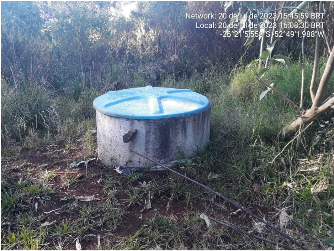
Figura 241: Fonte caxambu