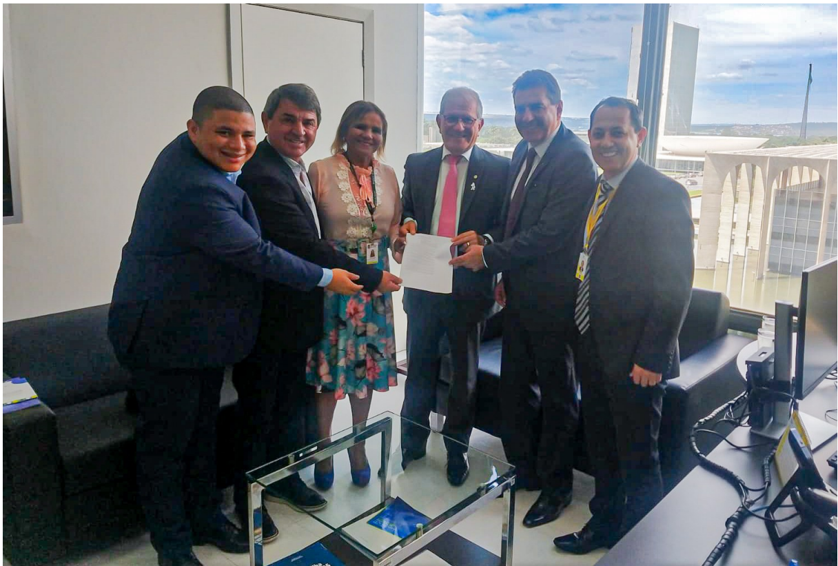
Figura 228: Agostinho Menegatti, prefeito, e Rubens Mocellin, secretário de Relações Institucionais, com Valdir Cobalchini, deputado federal, e membros da Assessoria Parlamentar do Fundo Nacional de Saúde

Além dos munícipes lourencianos, a Unidade atende pacientes de 08 municípios do Noroeste de Santa Catarina, abrangendo uma região de 50 mil habitantes.