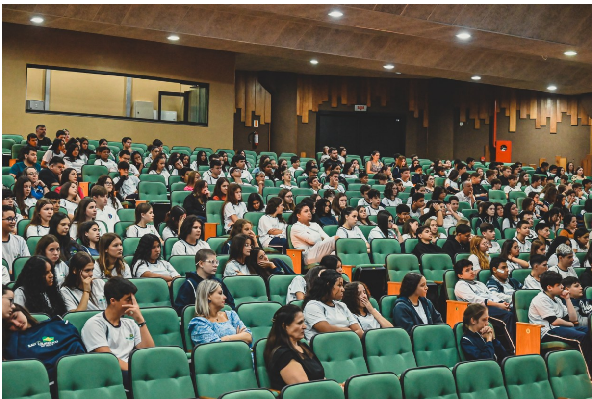
Figura 258: Lançamento do Projeto Aprender a Empreender

Direciona-se o Projeto a alunos dos 8º e 9º anos que conhecerão, nas atividades escolares, aspectos relacionados ao mundo do trabalho e, ainda, terão a oportunidade do primeiro emprego.