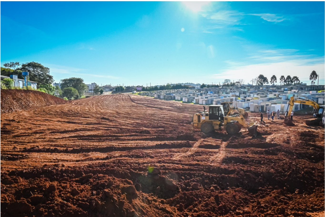
Figura 261: Obras de ampliação do Cemitério Jardim da Saudade

Paralelo a isso, a Secretaria de Relações Institucionais trabalhou na regularização das licenças ambientais do Cemitério junto ao CINCatarina e, também, na licença ambiental da área que será anexada à parte antiga.