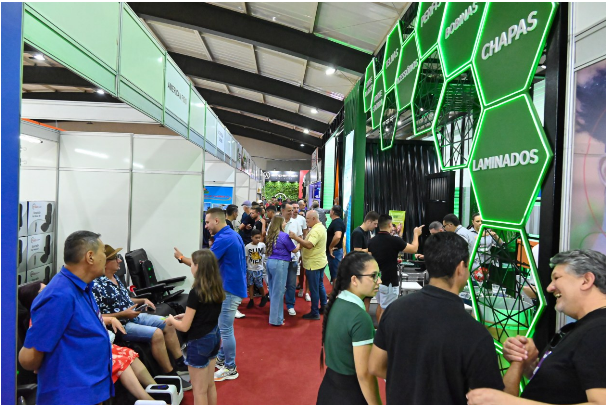
Figura 250: 7ª Efaislo/2023, no Centro de Eventos Governador Luis Henrique da Silveira