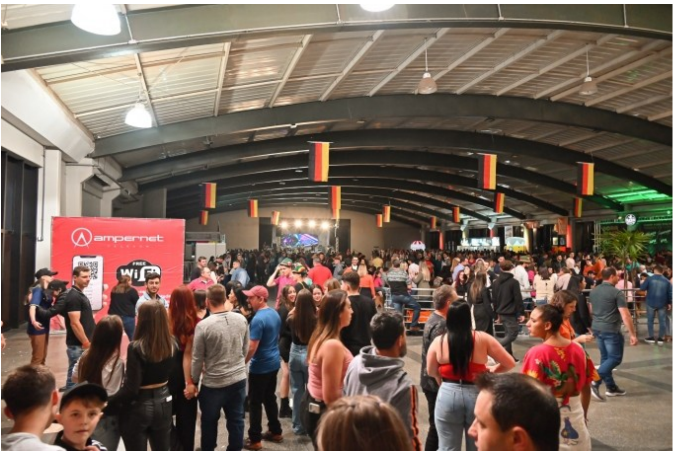
Figura 223: Oktoberfest/2022, no Centro de Eventos Governador Luiz Henrique da Silveira

Com entrada gratuita para os dois dias, o evento teve quatro bandas por noite, três cervejarias, venda de produtos típicos e até um jantar, valorizando a cultura alemã e prestigiando as entidades do município. O casal Fritz e Frida recepcionou o público.