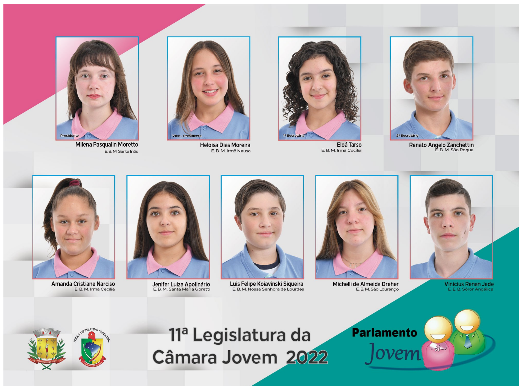
Figura 160: Vereadores mirins 2022