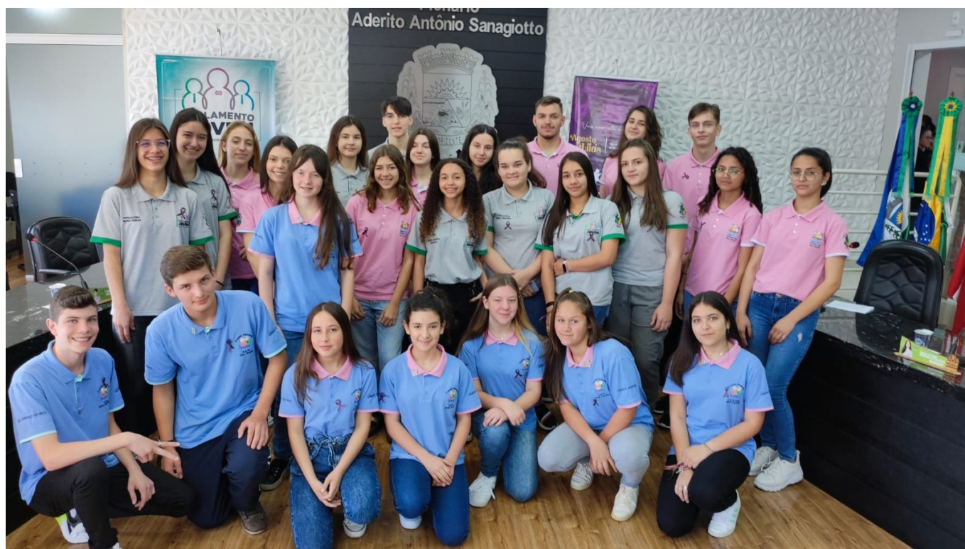
Figura 140: Vereadores mirins de São Lourenço do Oeste e de Jupiá presentes na sessão ordinária dos vereadores mirins de Novo Horizonte

Como forma de intercâmbio, os vereadores mirins lourencianos acompanharam, em 25 de agosto, a sessão plenária da Câmara Mirim de Novo Horizonte e participaram de uma palestra relacionada ao Agosto Lilás, ministrada pelo CRAS daquele município.