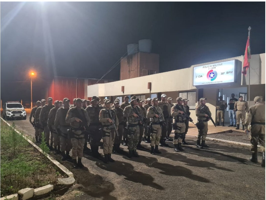
Figura 300: Especialização de policiais militares em São Lourenço do Oeste

Policiais militares de vários municípios catarinenses fizeram a Especialização em Policiamento de Fronteiras e, em 25 de setembro de 2022, participaram do estágio tático, com o objetivo de colocar em prática os ensinamentos teóricos. A atividade ocorreu em São Lourenço do Oeste e envolveu 40 policiais na execução de rondas rurais, abordagens, vistorias e identificação de veículos e pessoas suspeitas, além de serem criados oito pontos de vistorias.