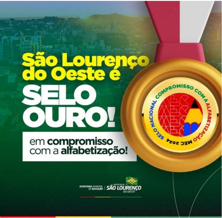
Figura 275: Selo Ouro em Compromisso com a Alfabetização para São Lourenço do Oeste

Ainda, resulta do regime de colaboração entre a União, Estado e Município, com o objetivo de garantir que todas as crianças brasileiras estejam alfabetizadas até o fim do 2º ano do Ensino Fundamental, conforme a Meta 5 do Plano Nacional de Educação. O Selo visa garantir que 100% dessas crianças estejam alfabetizadas por projetos, promovendo e compartilhando boas práticas, além de recuperar as aprendizagens das crianças.