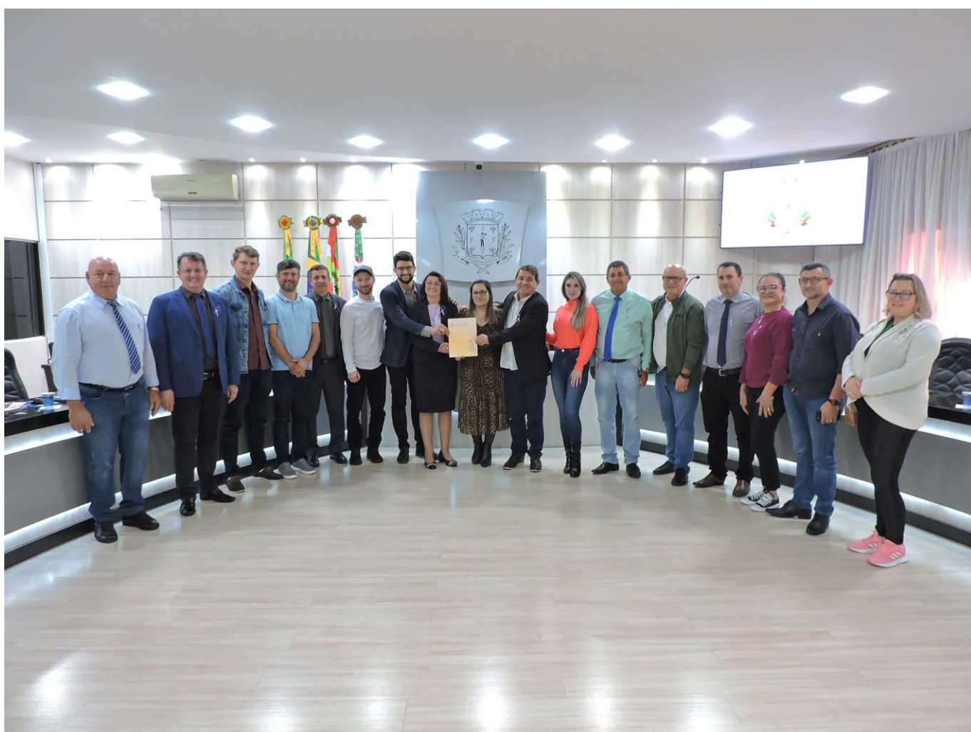
Figura 68: Representantes da Secretaria Municipal de Saúde recebem projeto aprovado para o repasse de recurso ao Fundo Municipal de Saúde

Uma gestão eficiente da Câmara de Vereadores permitiu economia e repasse de R$ 300 mil do Legislativo ao Fundo Municipal de Saúde (FMS). Trata-se do projeto transformado na Lei Ordinária n. 2.782, de 24 de agosto de 2023, que autorizou o Governo Municipal a realizar abertura de crédito adicional por anulação de dotações no orçamento financeiro de 2023, com o objetivo de adicionar o valor ao orçamento do FMS e, então, complementar as despesas com cirurgias eletivas e exames diagnósticos.