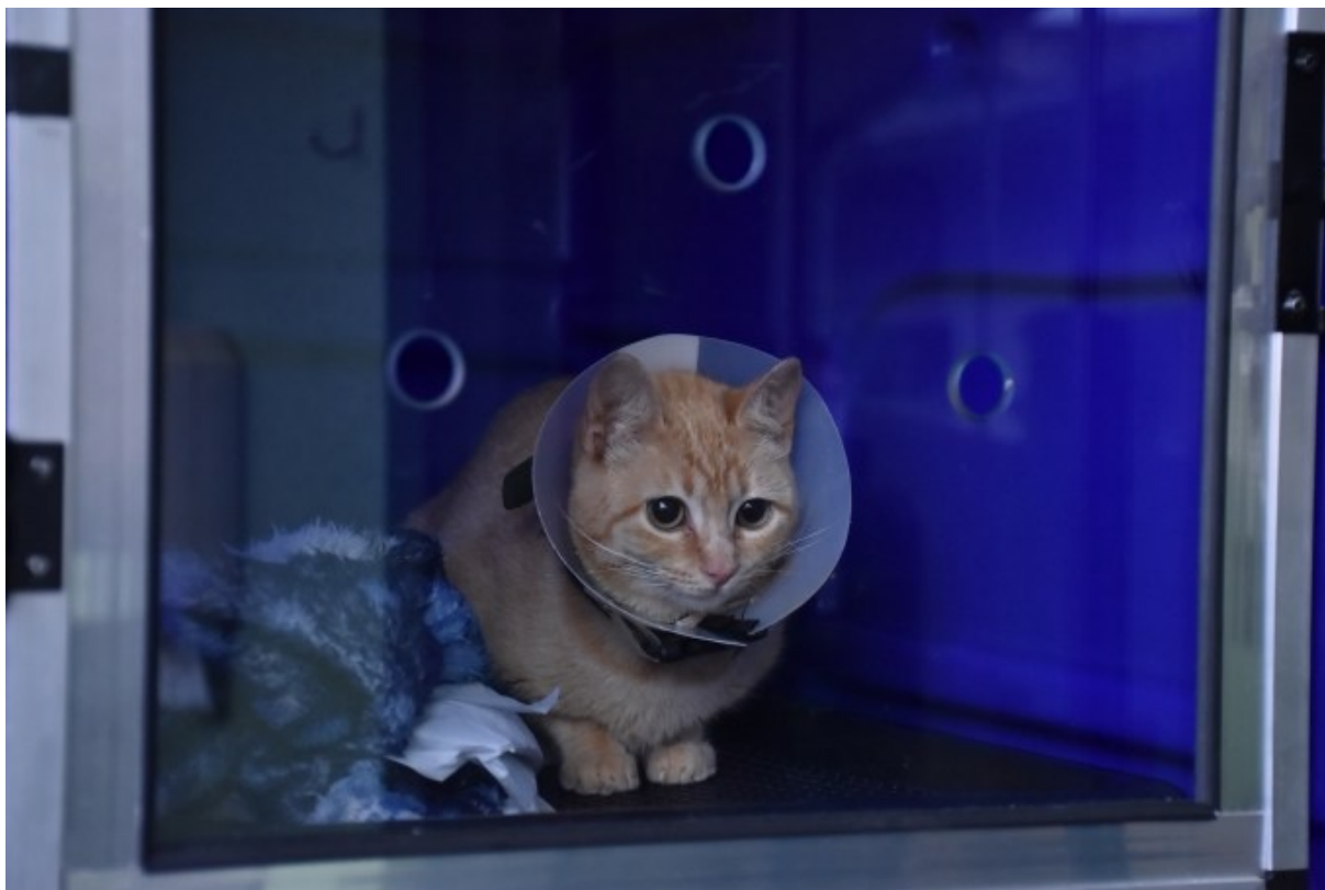
Figura 201: Atendimento ao Programa Municipal de Tratamento Médico-Veterinário Gratuito a Cães e Gatos

Com o Programa, o município pode repassar até R$ 25 mil por ano para custear as despesas provenientes de tratamentos médicos-veterinários. A fiscalização fica por conta da Secretaria de Agricultura, que recebe o pedido do tutor carente, de ONGs ou associações protetoras, em horário de expediente, e faz o encaminhamento para a clínica veterinária contratada por processo licitatório.