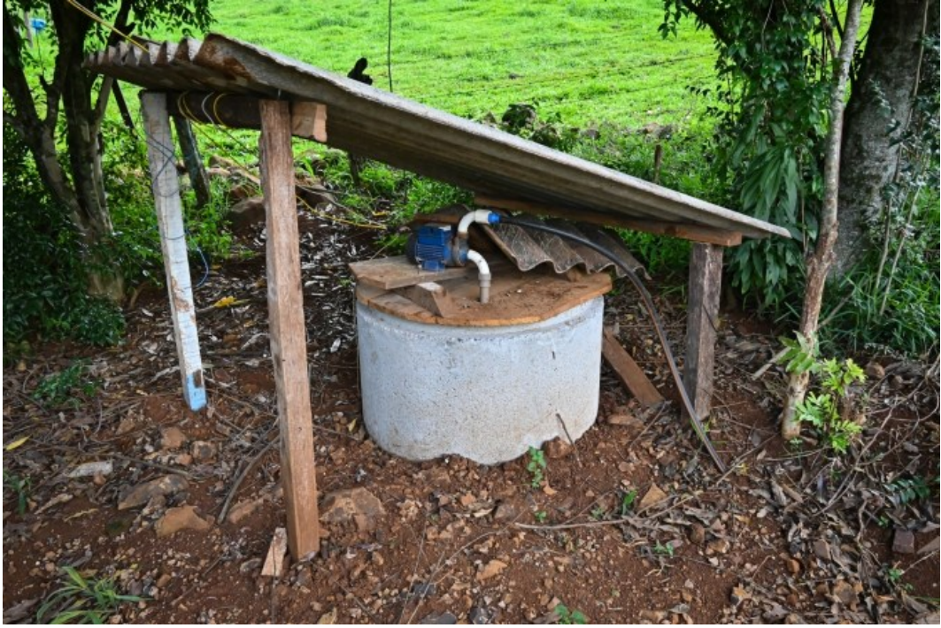
Figura 240: Reservatório recuperado pelo programa Fonte Cheia

Aproximadamente 700 famílias residem no interior de São Lourenço do Oeste e, desde a implantação do Programa Fonte Cheia até outubro de 2024, foram preservadas 92 fontes, sendo que sete delas são de uso comunitário. Contava, também, com 23 cisternas, totalizando 18 milhões de litros de água, e 07 poços artesianos, sendo que dois deles aguardam o teste de vazão. São mais de 400 famílias atendidas com os programas de abastecimento até então instalados.