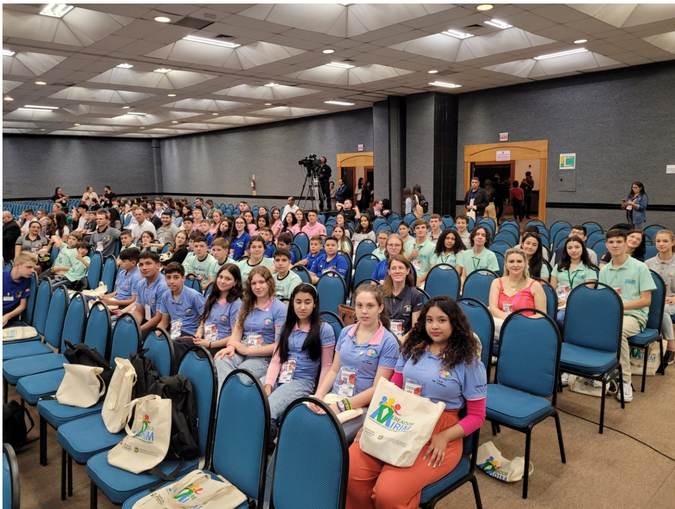
Figura 151: Vereadores e executivos mirins da Acanor, com seus coordenadores, no encontro estadual de vereadores mirins, em Florianópolis

A Câmara Mirim finalizou as ações de 2023 com a realização da campanha para a arrecadação de ração e mantimentos a animais, em apoio à Associação Protetora dos Animais (Fênix). Arrecadar doações da comunidade e destiná-las à entidade protetora dos animais constituiu-se na finalidade de campanha. Os pontos de coleta ficaram estabelecidos na Câmara Municipal e nas EBMs. Santa Maria Goretti, Irmã Cecília, Irmã Neusa, São Lourenço, São Roque, Nossa Senhora de Lourdes e Santa Inês. Remédios, ração, tapetes higiênicos, produtos de limpeza, roupas, coleiras, guias, casinhas, caixas de transporte, brinquedos e utensílios em geral para cães e gatos foram os produtos arrecadados com a atividade.