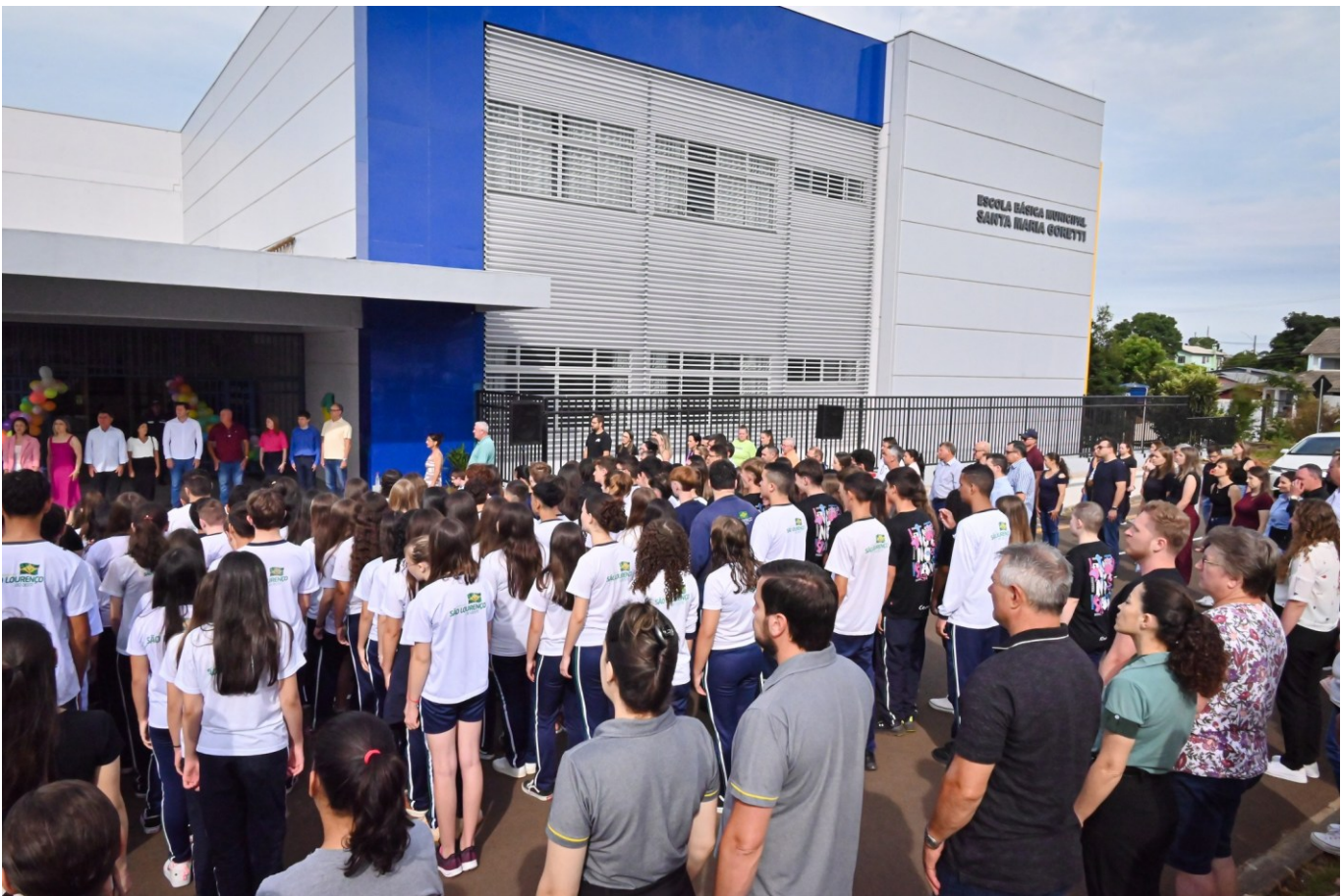
Figura 269: Inauguração da EBM. Santa Maria Goretti

Com acesso pelas Ruas Luiza Ebling e Aderbal Ramos da Silva, no Bairro Progresso, a escola tem três pavimentos e uma quadra coberta, totalizando 6.125 m², e pode atender mais de mil alunos da Educação Infantil e do Ensino Fundamental. São 24 salas de aula, biblioteca, laboratórios de arte, ciência e informática, brinquedoteca, sala de leitura, área administrativa, refeitório e playground. Com o projeto arquitetônico desenvolvido pela equipe da Secretaria Municipal de Relações Institucionais, a obra teve a ordem de serviço dada em 2020 e a execução ficou de responsabilidade da Construtora Pandini.