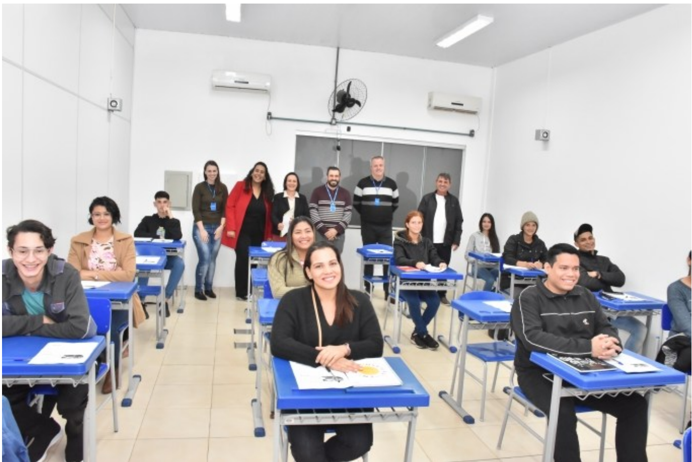
Figura 212: Autoridades com alunos de cursos profissionalizantes voltados à população imigrante

Recentemente, com a reforma administrativa, ficou criada a função técnica para a Coordenação de Políticas Públicas para a População Imigrante, vinculada à Secretaria de Assistência Social. Consta como objetivo acolher o imigrante, verificar suas demandas e fazer encaminhamento aos demais setores públicos, ofertar formações e orientar a documentação.