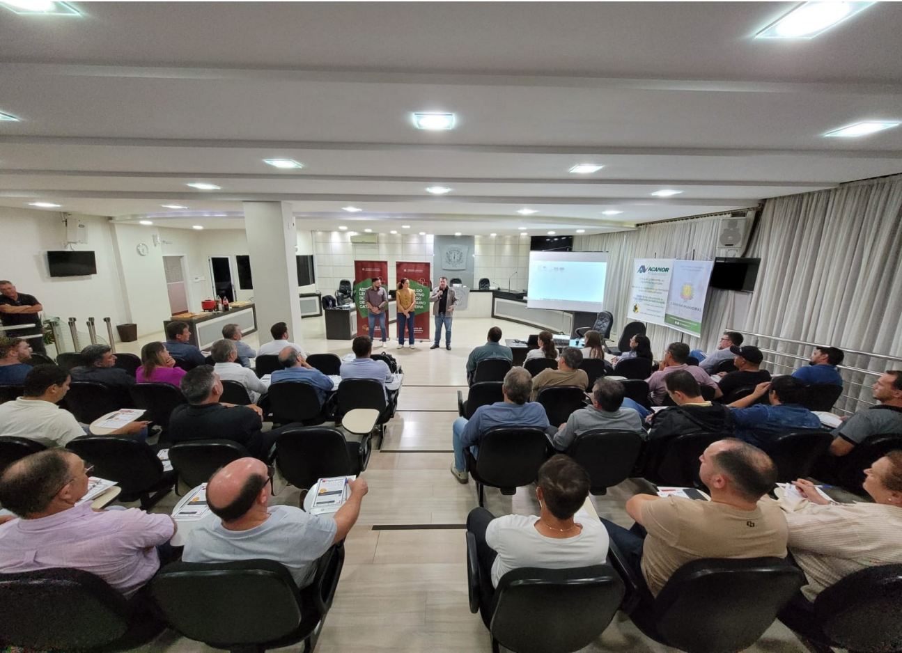
Figura 317: Seminário no Plenário Vereador Lídio Sutilli

O seminário configurou-se como uma oportunidade única de formação política para que os recém-eleitos possam exercer ou contribuir no mandato parlamentar com mais qualidade e eficiência. Do vereador são exigidas dedicação e empatia e, além de captar as demandas locais, colaborar para que se tornem políticas públicas eficazes. Além disso, ele é o responsável constitucional por fiscalizar e garantir que o recurso público seja utilizado de maneira eficaz.