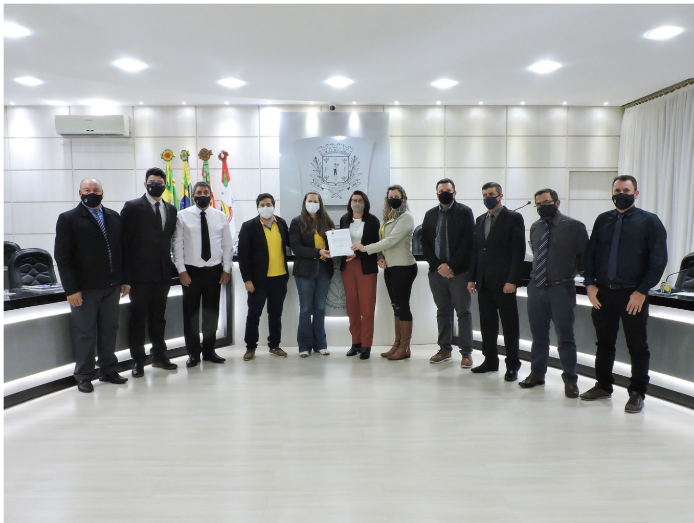
Figura 110: Entrega da Moção de Congratulação a representantes do Grupo Jovem Vida