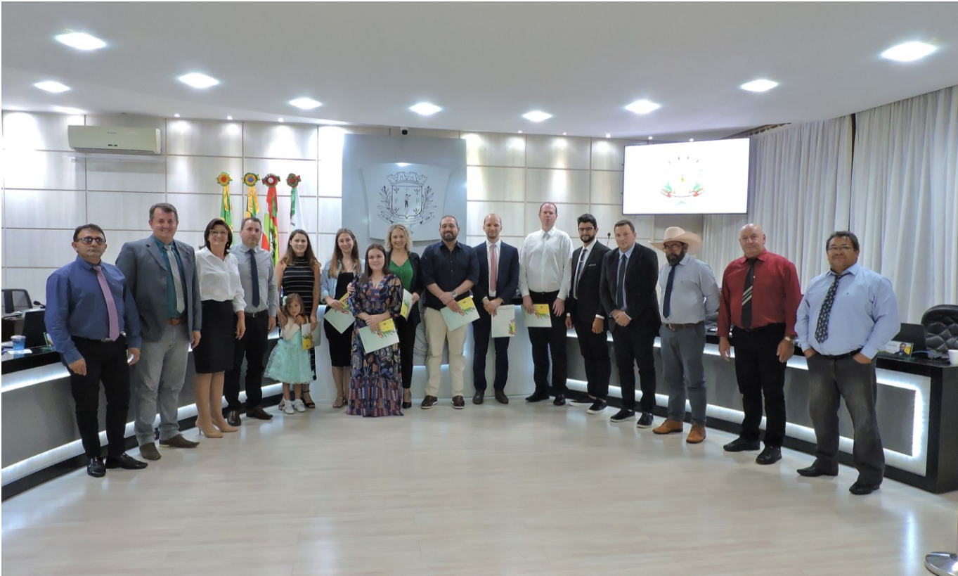
Figura 128: Representantes da Justiça Eleitoral recebendo a Moção de Congratulação