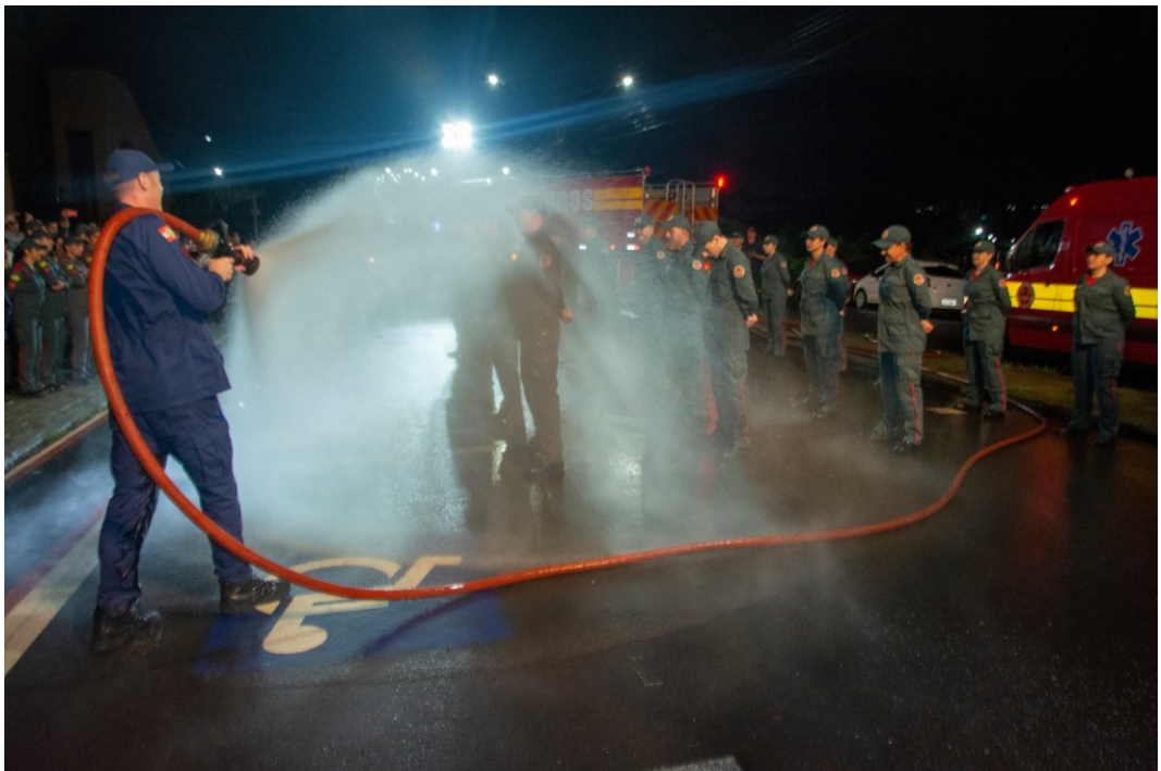
Figura 307: Tradicional banho de mangueira na formatura do curso de bombeiros comunitários