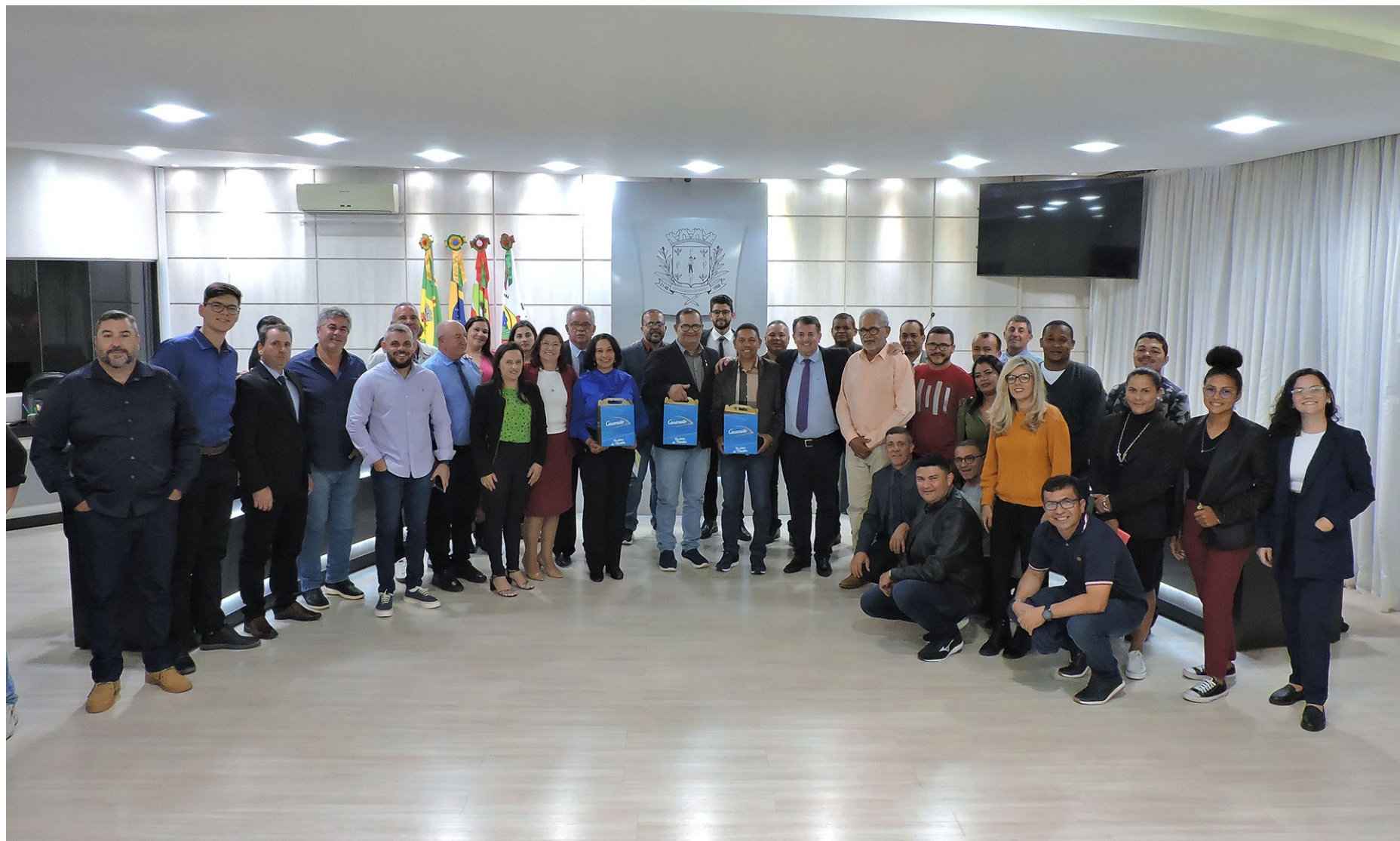
Figura 131: Entrega Moção de Congratulação a representantes da comitiva do Acre, em visita à Câmara Municipal

O Poder Legislativo aprovou, em 23 de maio de 2023, a Moção de Congratulação, assinada por todos os vereadores, entregue à comitiva do Acre, composta por 32 pessoas, que realizou missão em Santa Catarina, de 22 a 26 de maio, e visitou São Lourenço do Oeste. Trata-se de uma organização do Serviço Brasileiro de Apoio às Micro e Pequenas Empresas (Sebrae), em conjunto da Federação das Associações Comerciais e Empresariais do Estado do Acre (Federacre).