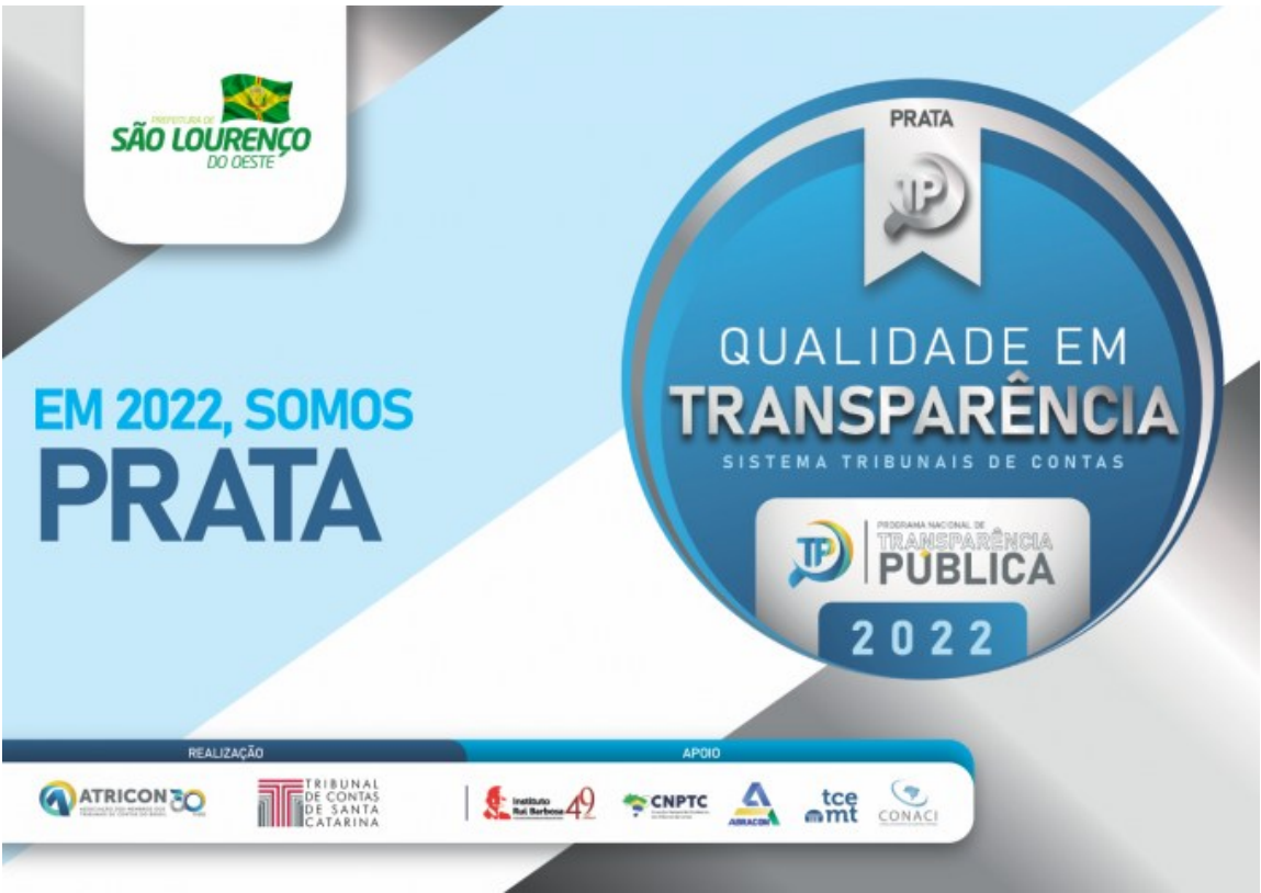
Figura 230: Selo Prata Qualidade em Transparência/2022

Concedido pela Associação dos Membros dos Tribunais de Contas do Brasil (Atricon), o Selo tem como objetivo fomentar a transparência e estimular o aprimoramento dos portais. Entre os critérios avaliados estão: disponibilização de informações à população por meio de site próprio ou portal da transparência; informações sobre a instituição e referentes às respectivas receitas e despesas; dados sobre recursos humanos, diárias, contratos e licitações; relatórios de gestão fiscal; serviços de informações aos cidadãos; acessibilidade; ouvidoria; serviços e atividades de interesse coletivo; e prestação de contas dos recursos repassados a entidades.