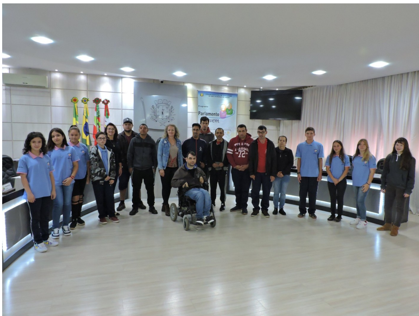
Figura 137: Alunos da APAE de São Lourenço do Oeste na sessão da Câmara Mirim

Como orienta o seu regimento interno, a Câmara Mirim realizou sessão ordinária mensal, iniciando em 11 de maio, com grande público presencial e votação de várias proposições.