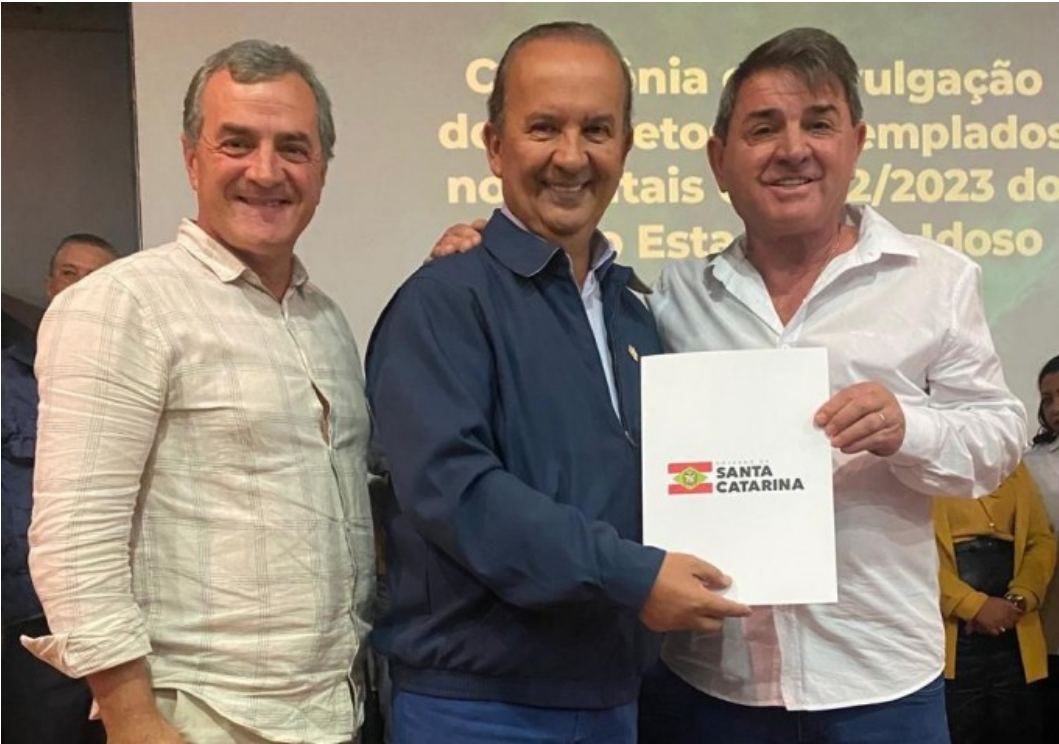
Figura 266: Anilson Spricigo, secretário de Assistência Social; Jorginho Mello, governador de Santa Catarina; e Agustinho Menegatti, prefeito

Graças à agilidade da equipe da Secretaria de Assistência Social que, em tempo hábil, cadastrou as propostas, o município foi contemplado com o recurso, a ser aplicado em oficinas de pilates, atividades físicas, artes e outras ações. O projeto poderá durar até um ano e o início das atividades estava previsto a partir da liberação do recurso pelo Estado.