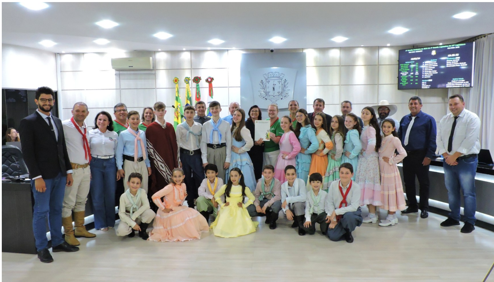
Figura 133: Entrega da Moção de Congratulação ao CTG Amizade sem Fronteiras