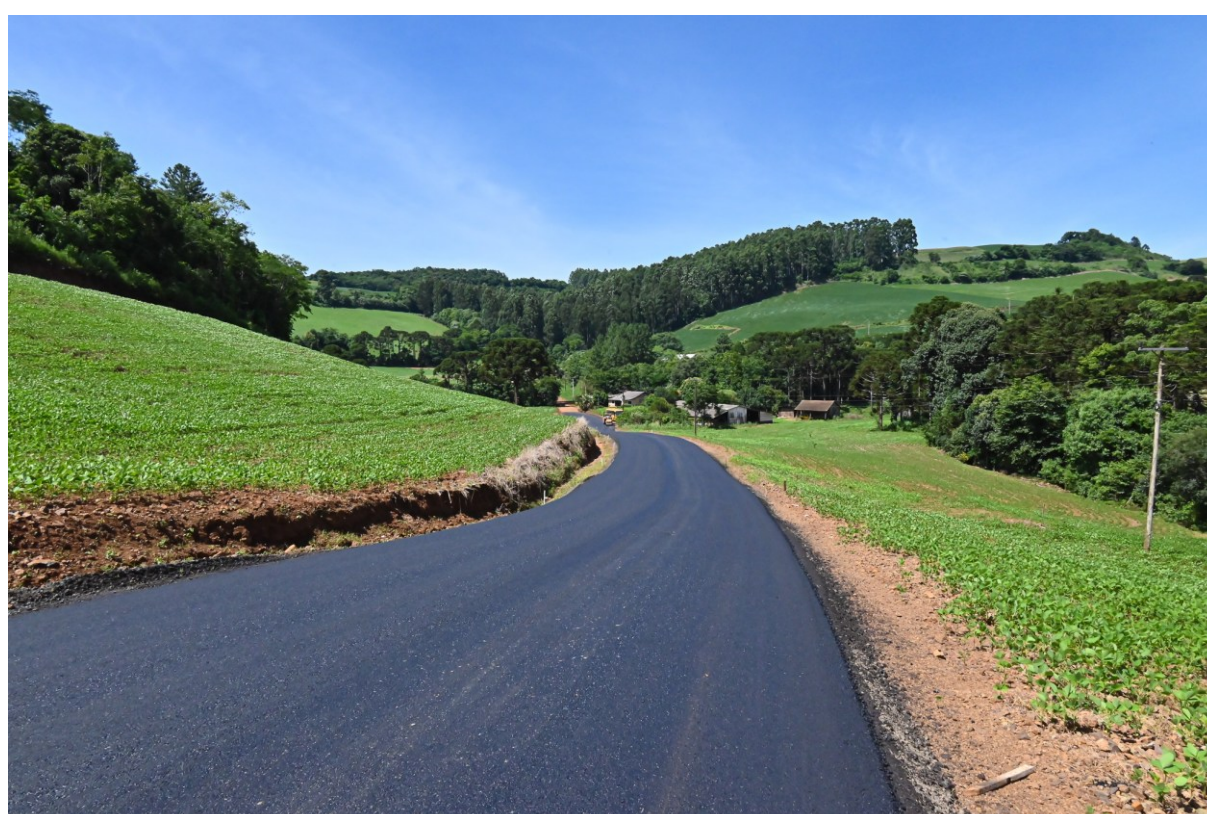
Figura 243: Estrada que liga São Roque à Linha Ouro Verde

Nesta ação, o Governo Municipal investiu pouco mais de R$ 107 mil, captados do Fundo Municipal de Saneamento Básico (Funsan). A base e o reservatório foram feitos pelo município e a rede de distribuição até as residências pela comunidade, em parceria com a CASAN, que doou os materiais. Para suprir a demanda das famílias, especialmente em período de estiagem, o reservatório instalado tem capacidade para armazenar 20 mil litros de água.