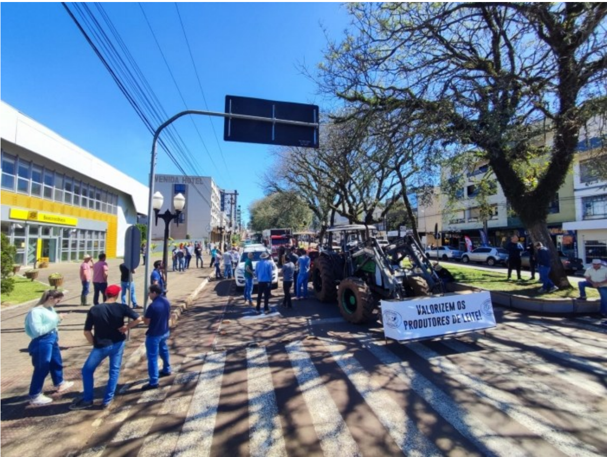
Figura 312: Produtores e apoiadores do setor leiteiro em manifesto na Avenida Brasil

Em 15 de setembro de 2023, a Sociedade Rural Noroeste de São Lourenço do Oeste organizou uma manifestação em frente ao Banco do Brasil, com o objetivo de reivindicar melhorias e chamar a atenção para a crise no setor leiteiro, visando medidas que garantam a sustentabilidade da atividade. Da manifestação participaram produtores e empresários que expuseram cartazes e faixas com frases de clamor, como, por exemplo, "Valorizem os produtores de leite".