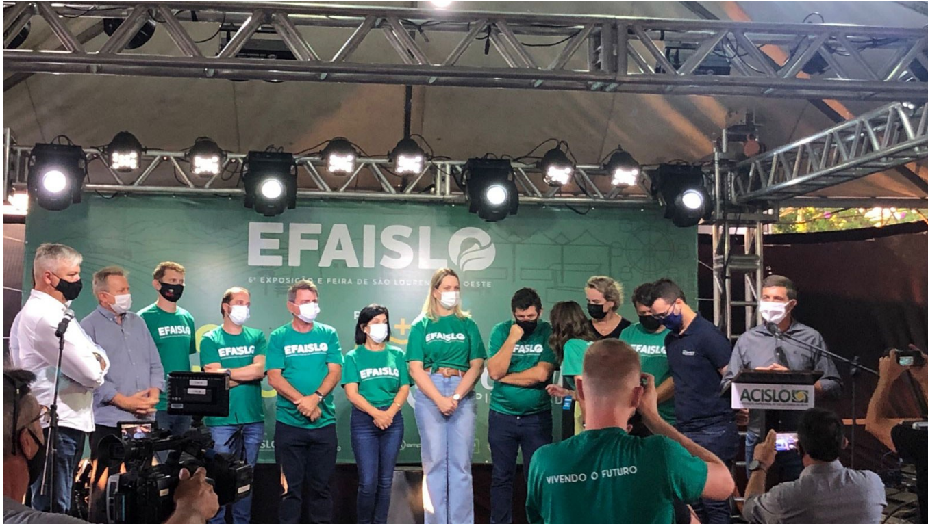
Figura 25: Presidente da Câmara Municipal, Adilson Sperança, em pronunciamento durante a abertura da 6ª Efaislo

Adilson Sperança, presidente do Legislativo, participou da abertura oficial da 6ª Exposição e Feira de São Lourenço do Oeste (Efaislo), no dia 10 de fevereiro de 2022. A Casa de Leis apoiou e agilizou os trâmites dos projetos para o evento. A Acislo realizou a Feira, com promoção do Governo Municipal e apoio da Câmara de Dirigentes Lojistas (CDL).