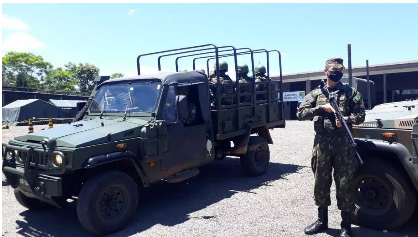
Figura 288: Ação da Operação Ágata Fronteira Sul no Centro Pastoral em São Lourenço do Oeste

Em outubro de 2021, o Exército Brasileiro realizou a Operação Ágata Fronteira Sul em São Lourenço do Oeste. Composto por tropas de São Miguel do Oeste, Florianópolis, Joinville e Curitiba, o grupo ficou instalado no Centro Pastoral da Igreja Matriz. A operação teve por objetivo principal prevenir riscos transfronteiriços e delimitar a presença destas forças na região.