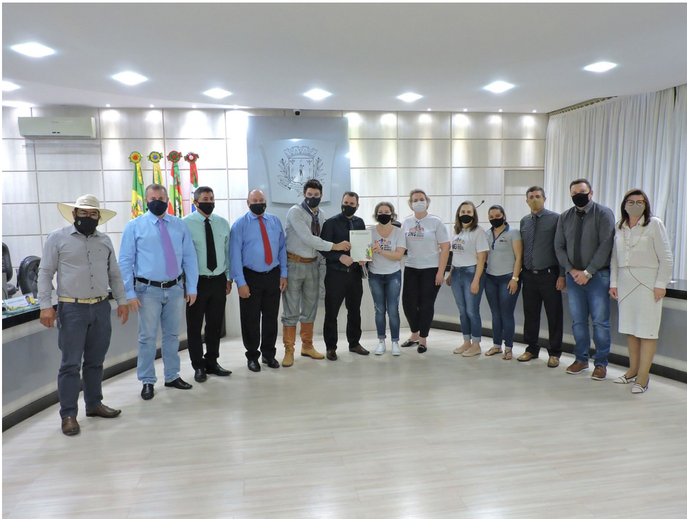
Figura 111: Entrega da Moção de Congratulação a representantes da ONG Entre Amigos e Crianças