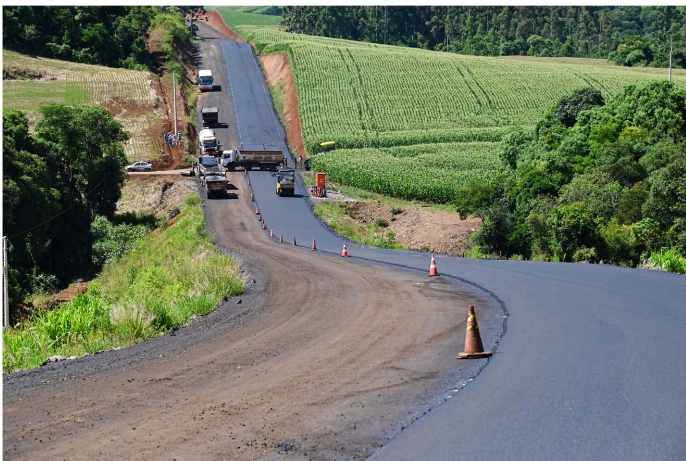
Figura 274: Pavimentação do Contorno Leste

A empresa Zancanaro retomou as obras no início de outubro, depois do aporte de R$ 6 milhões do Governo de Santa Catarina. O investimento total da obra ultrapassa os R$ 30 milhões, recursos do Governo do Estado com contrapartida do Governo Municipal.