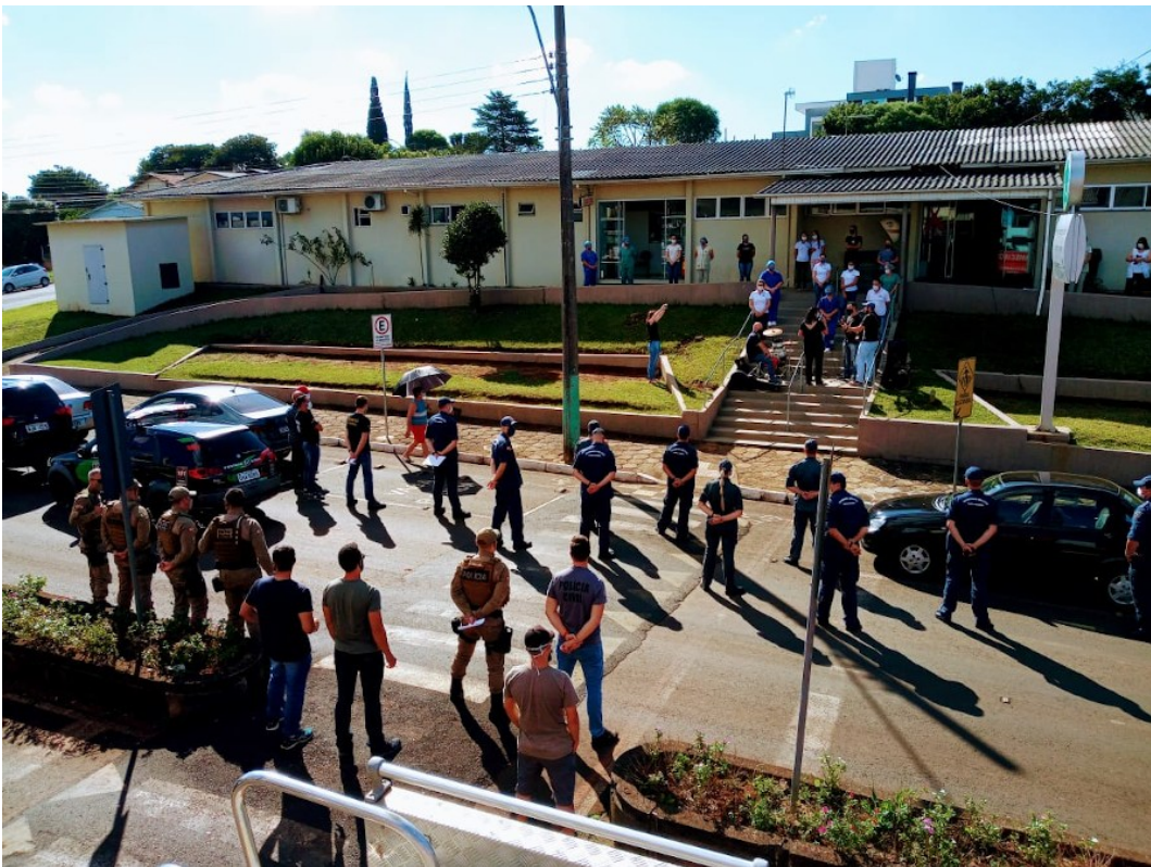
Figura 281: Representantes das Polícias Militar e Civil e do Corpo de Bombeiros Militar em homenagem aos profissionais da saúde

Corpo de Bombeiros, Polícia Militar, Polícia Civil e Instituto Geral de Perícias (IGP) homenagearam, em 09 de março de 2021, os profissionais de saúde de São Lourenço do Oeste, principalmente aqueles que formaram a linha de frente para o combate à covid-19. Na homenagem, que ocorreu em frente ao Hospital da Fundação e à UPA, representantes dos grupos cantaram, rezaram e leram mensagens de apoio e de agradecimento aos profissionais.