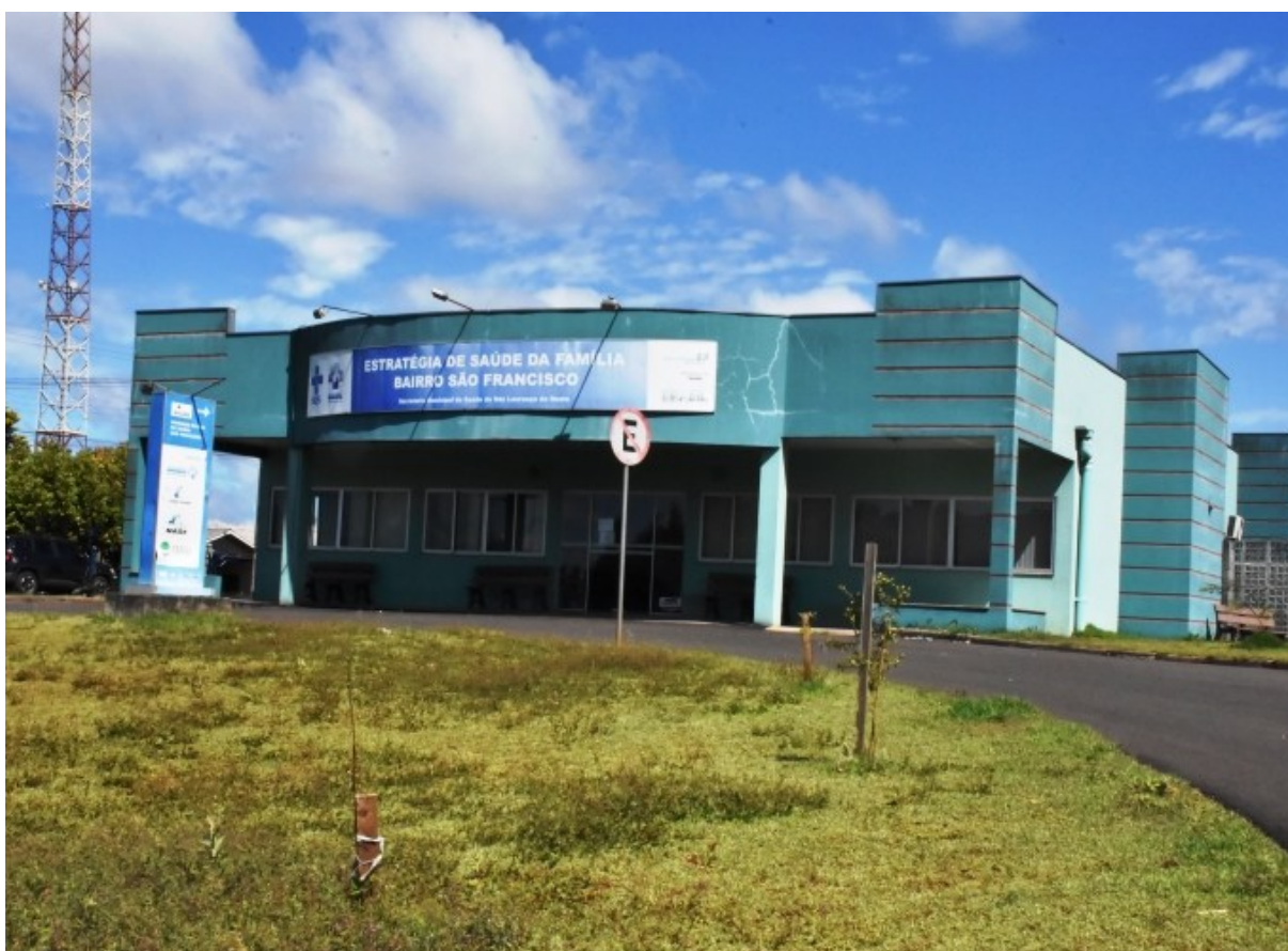
Figura 183: Unidade Básica de Saúde do Bairro São Francisco

Com as atividades suspensas em 2020 por conta da pandemia de covid-19, as Unidades Básicas de Saúde (UBSs) de São Lourenço do Oeste reabriram para atendimento ao público, sendo em 20 de janeiro de 2021, as da cidade e, em 04 de fevereiro, as do interior.