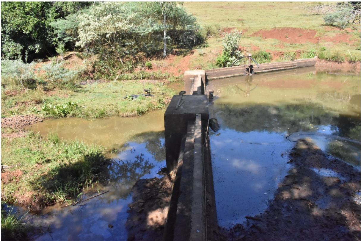
Figura 206: Barragem operada pela CASAN no Rio Macaco, com baixo volume de água