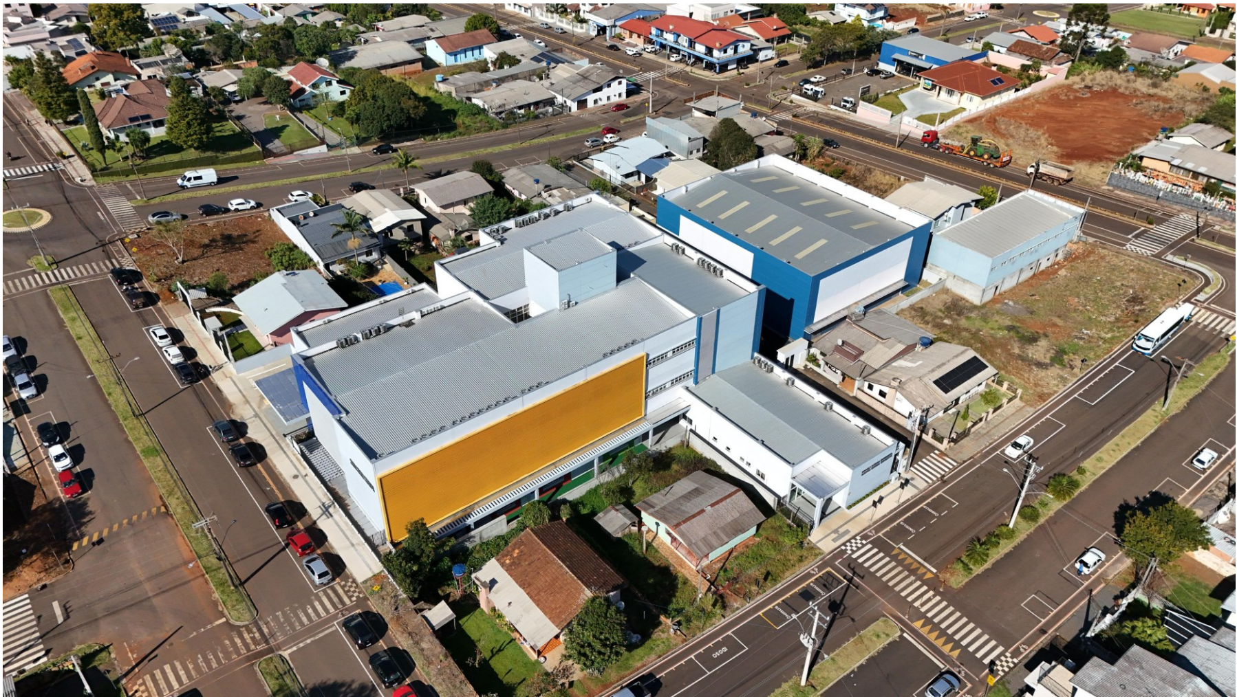
Figura 270: Vista aérea da nova EBM. Santa Maria Goretti/maio 2025