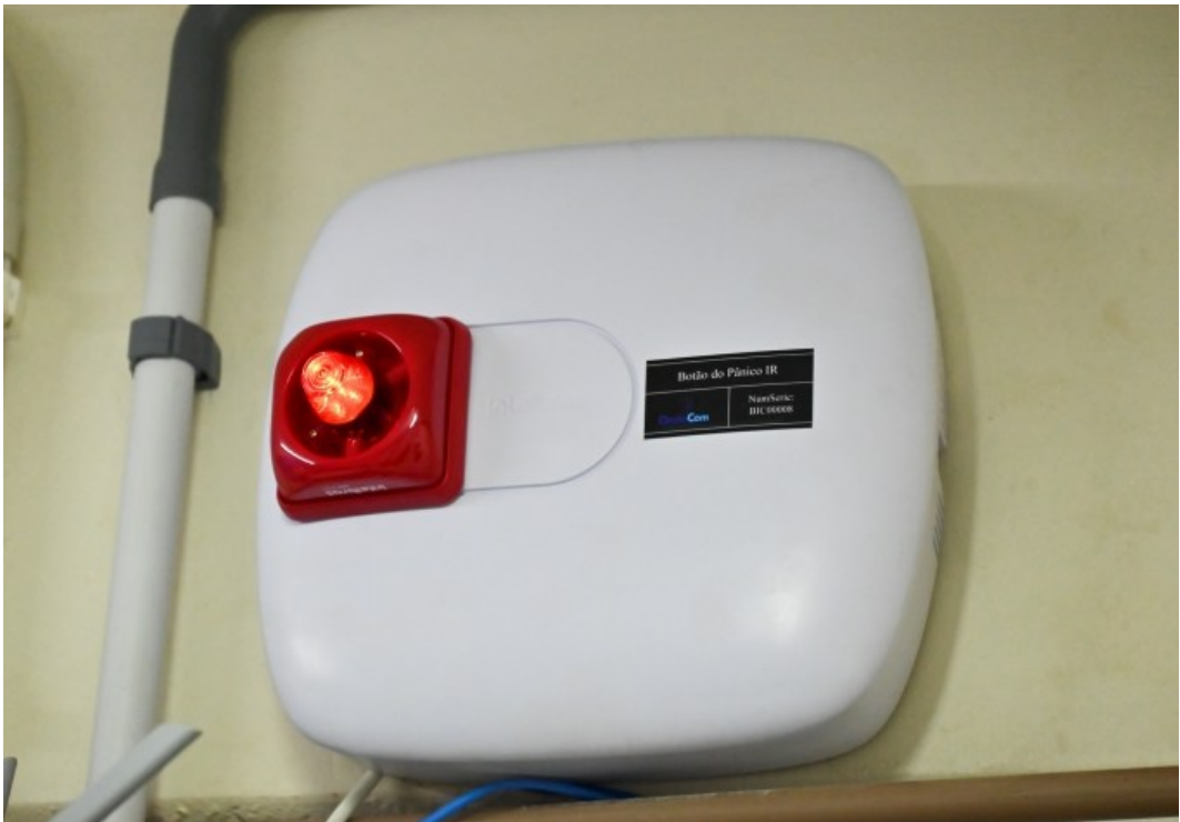
Figura 233: Botão de emergência implantado nas escolas

Professores e servidores das escolas e da Secretaria Municipal de Educação passaram por formação especial com a Polícia Militar e o Corpo de Bombeiros para entender o funcionamento do botão de emergência.