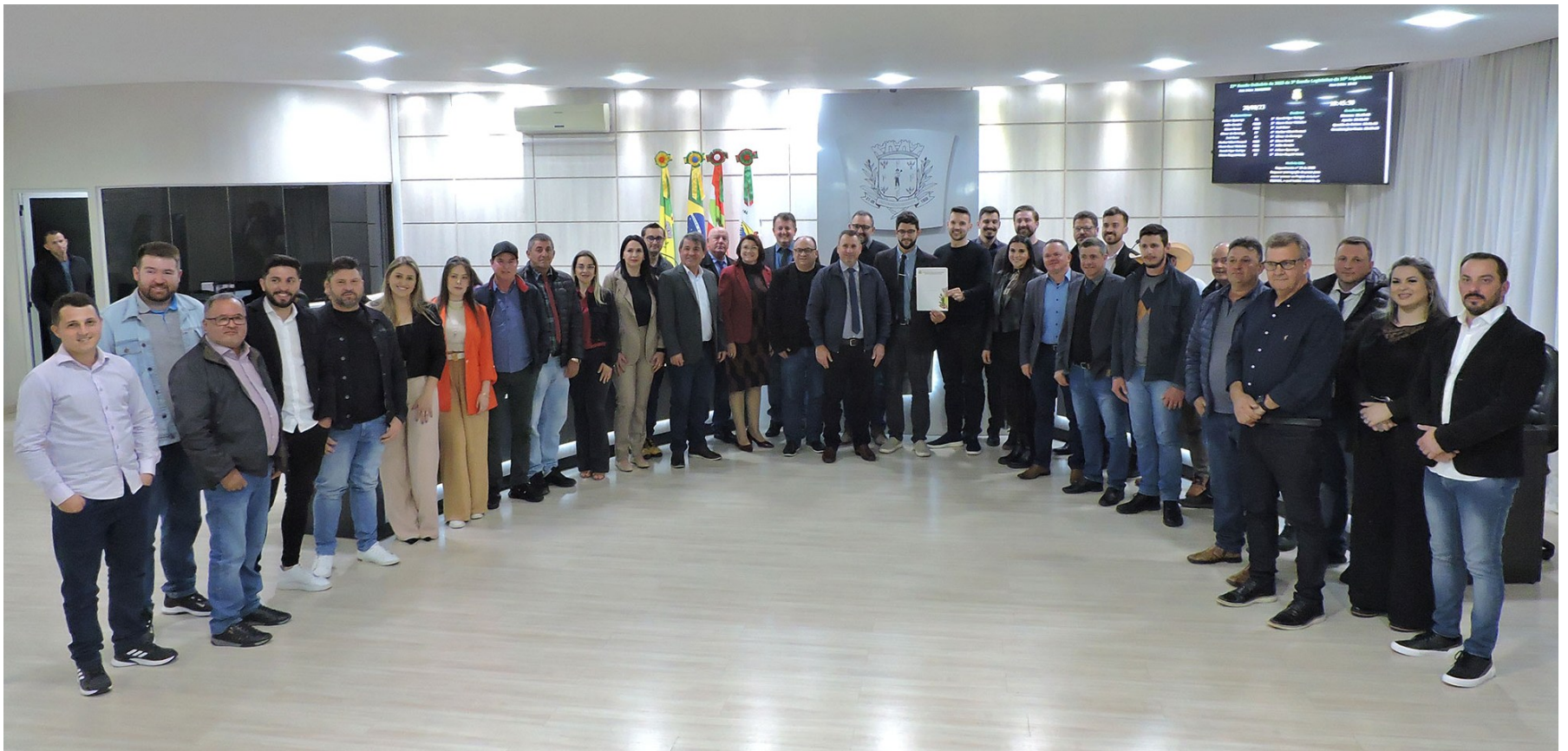
Figura 132: Representantes do Conselho Regional de Corretores de Imóveis recebendo a Moção de Congratulação