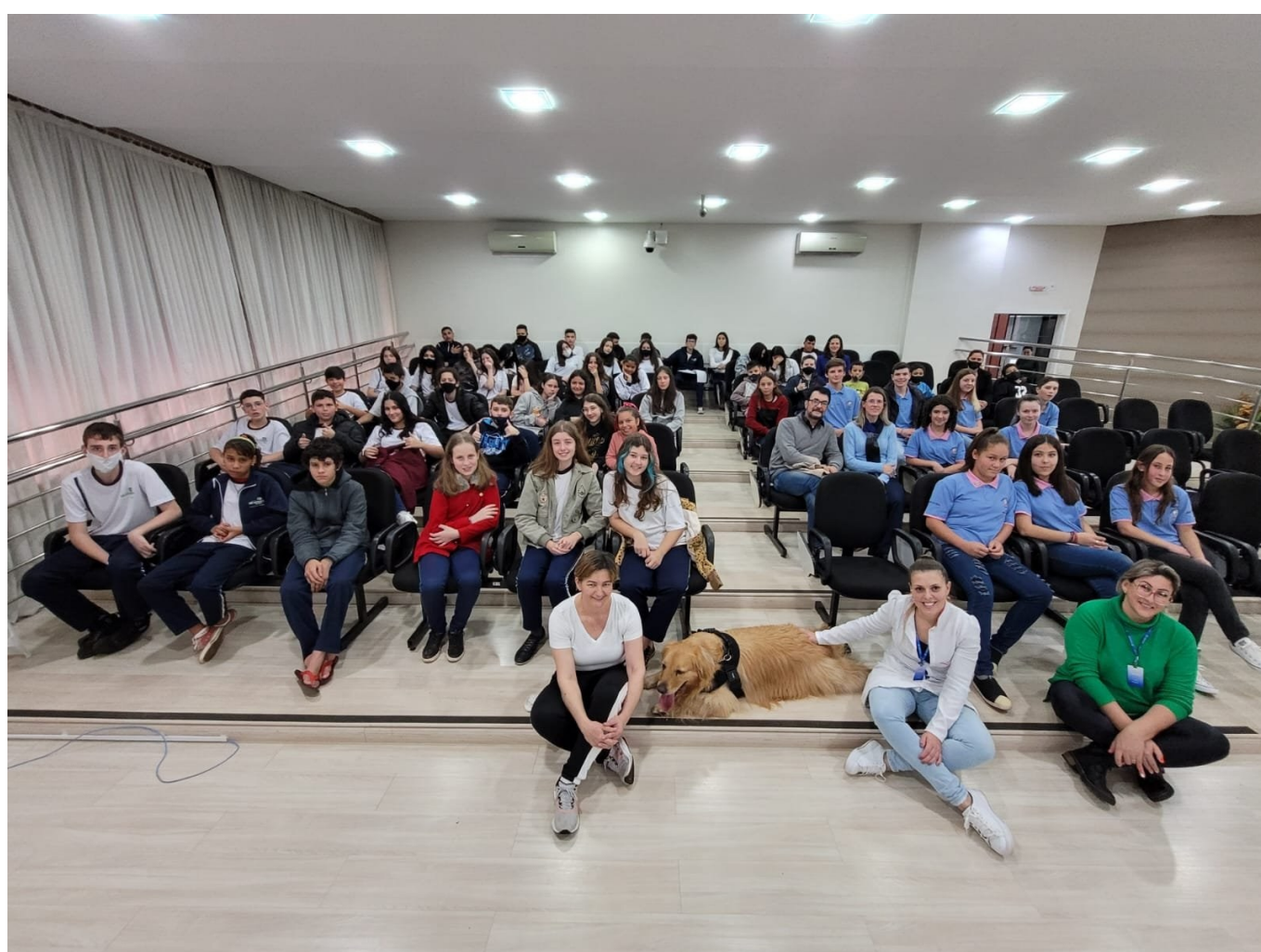
Figura 138: Profissionais da APAE de São Lourenço do Oeste e a cinoterapia

Já a segunda sessão do ano, realizada em 23 de junho, foi marcada pela presença de representantes da Escola Especial Nossa Senhora das Graças (APAE), quando falaram da cinoterapia, que é o trabalho desenvolvido pela entidade com o cão Eros.