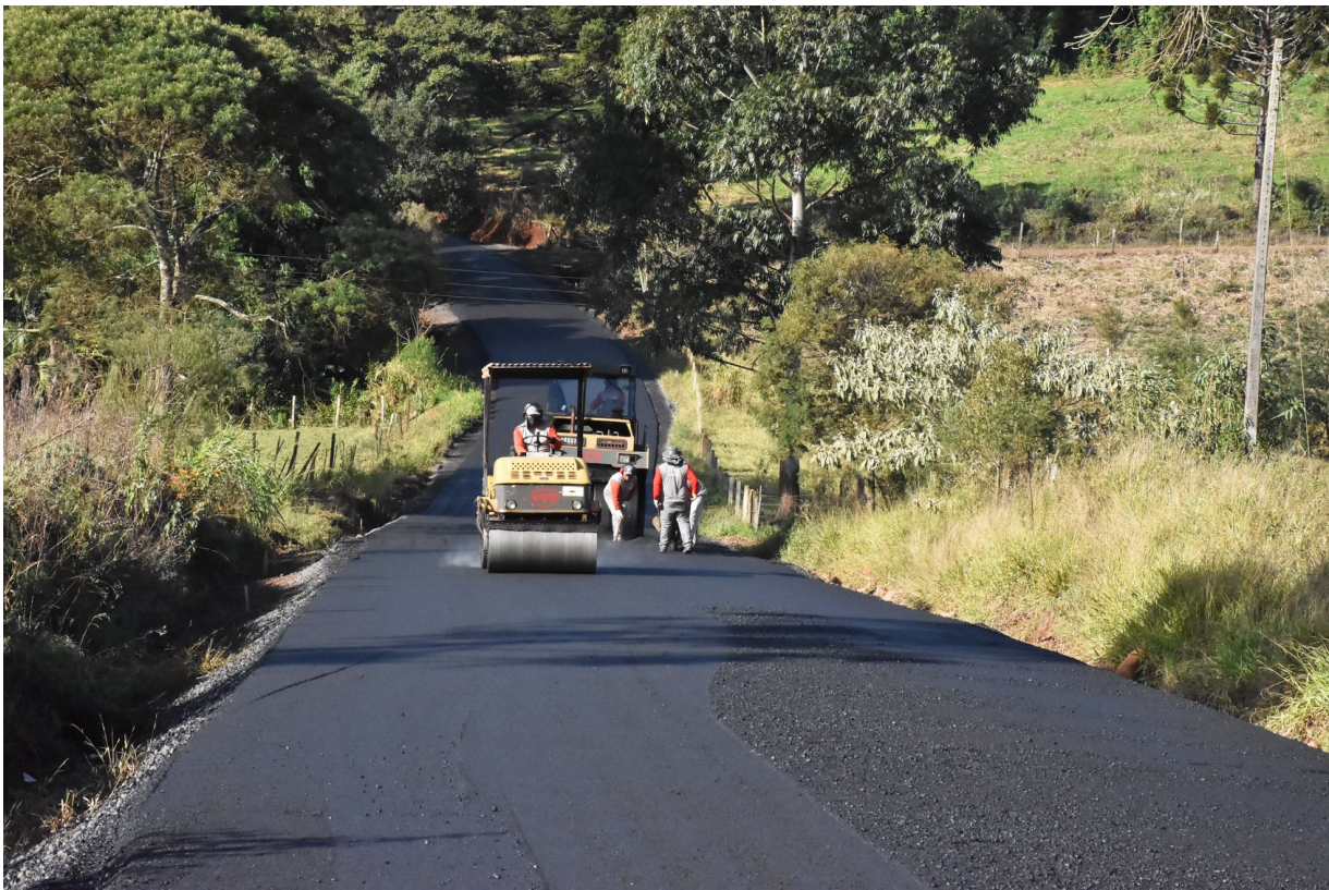
Figura 195: Asfaltamento da rodovia municipal até o Parque Bracatinga

Outras comunidades já foram contempladas com o Programa Asfalto Novo, a exemplo dos acessos a Sant’Ana da Bela Vista e, também, à gruta de Presidente Juscelino.