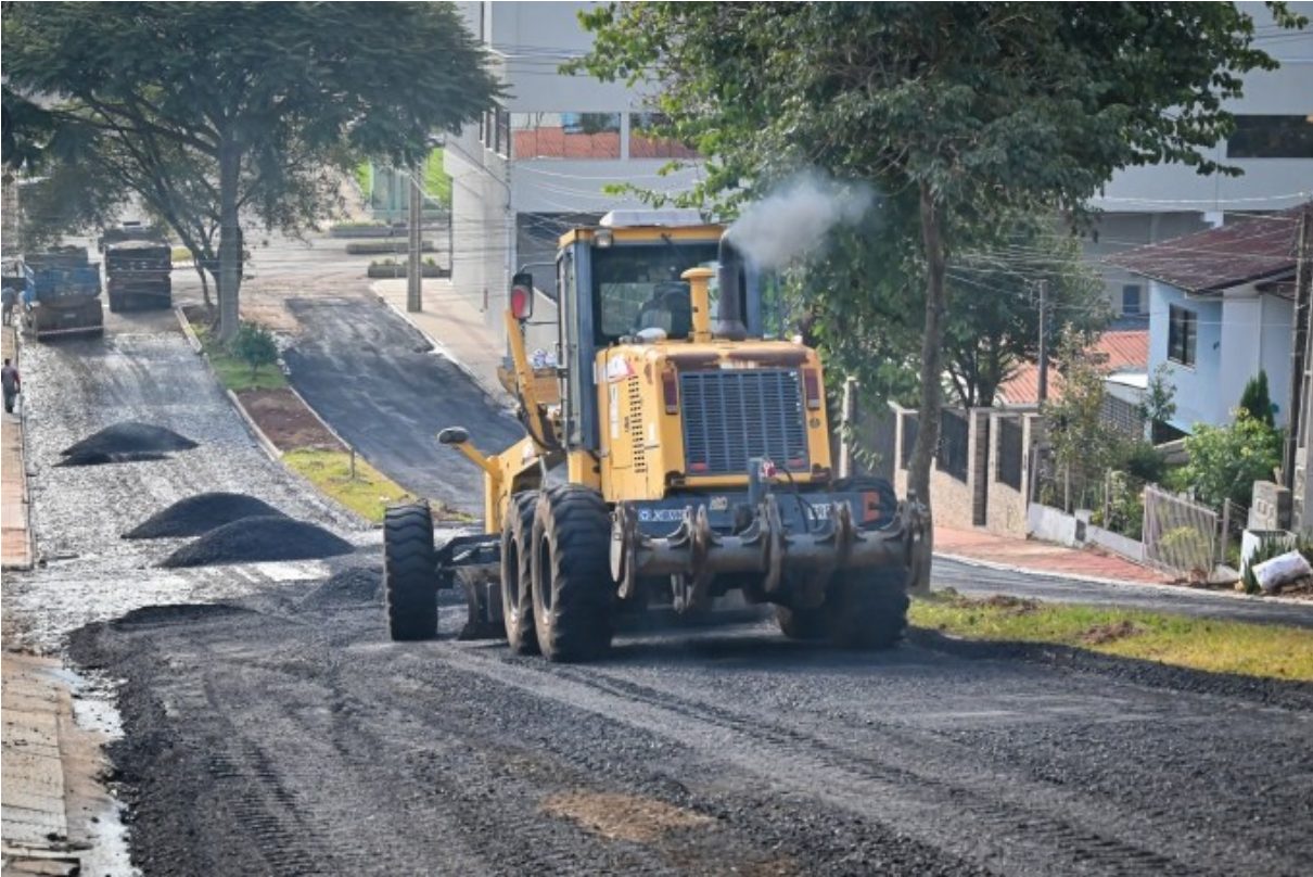
Figura 253: Asfaltamento de ruas

Além de exercer significativa valorização imobiliária e promover o desenvolvimento urbano, o asfalto é importante para uma infraestrutura adequada. Ruas pavimentadas com asfalto de qualidade agregam valor aos imóveis e proporcionam conforto e segurança aos moradores.